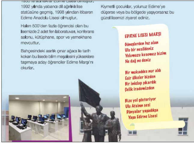
Görsel 8. TSE Öncü Çocuk Dergisi, s.15, Sayı:79,

Yazı karakteri seçiminde, hedef kitleyle birlikte dikkat edilecek temel konu okunurluktur. Tipografi, “okuma” eylemi üzerinden ihtiyaca dayalı bir grafik iletişim formu olarak ortaya çıkmıştır. Bilginin sunucu ve aktarıcısı konumunda olan tipografide, estetik kaygılar ise ikincil derecede önem niteliği taşımaktadır. Bir harf biçiminin diğerinden ayırt edilebilmesiyle ilgili olan okunurluk, tipografiye ilişkin kullanımlar üzerinden şekillenir. Bu kapsamda