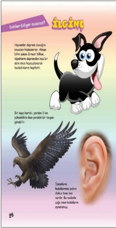
Görsel 6. TSE Öncü Çocuk Dergisi, s.26, Sayı:78

yuvarlak hatlı yazı karakterleri ve illüstrasyonlar (Görsel 6) 12 yaş üstüne hitap edecek konularda da (Görsel 7) tekrar edilmiştir (Nisan-Mayıs-Haziran 2016, Sayı: 78). Dergi 12 yaş içinse, kullanılan yazı karakterleri bu okuyucu kitlesine uygun değildir. Eğer dergi 6 yaş ve üstü içinse, puntoların küçüklüğü, fon ile kurulan kontrast ve görsellere çok yakın olmasıyla alt yaş sınırı için ciddi okuma güçlüğü yaratmaktadır.