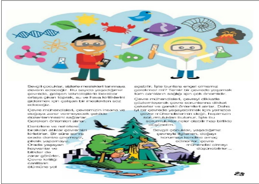
Görsel 12. TSE Öncü Çocuk Dergisi, s.23, Sayı:77

Çulha, boşluğu: “Sayfa içerisinde yer alan unsurları bir yapıya oturtan ve okutmayı sağlayan gizli tasarım elemanı” olarak tanımlar (Çulha, 2016). Tüm sayfanın yazı blokları ve görsel unsurlarla tamamen doldurulduğu örneklerde karmaşa ve beraberinde getirdiği okunaksızlık durumu göze çarpar. Tasarım öğelerinin birbiriyle çatışmasını önlemek; öğeler arasında vurgu ve hiyerarşi sağlamak amacıyla, sayfa içerisinde boşluğu kullanabiliyor olmak önem taşır.