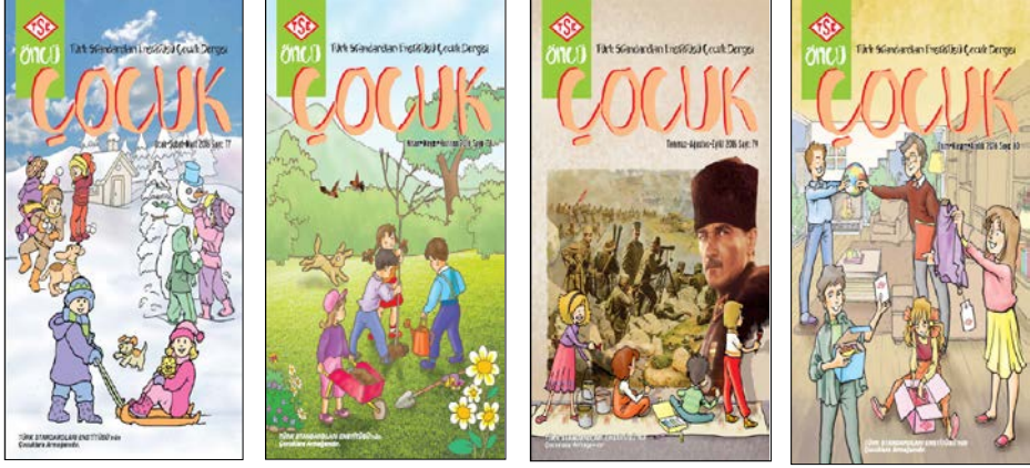
Görsel 1, 2, 3, 4. Öncü Çocuk Dergisi 2016 Sayıları (77, 78, 79, 80) kapak sayfaları.

Öncü Çocuk Dergisi'nin 2016 yılı sayılarının kapak tasarımında içeriğe dair başlıklar, derginin iç sayfalarına atıf yapan yazılı ifadeler gibi okur için merak ve okuma isteği uyandırabilecek unsurlara yer verilmemiştir (Görsel 1, 2, 3, 4). Dergide yer alan metinler: "Türk Standartları Enstitüsü Çocuk Dergisi", logotype, tarih-sayı bilgisi ve "Türk Standartları Enstitüsü'nün Çocuklara Armağanıdır" yazılılarıyla sınırlıdır ve bu yazılar, tarih ve sayı bilgisinin dışında her sayı için aynıdır, değişiklik göstermemektedir.