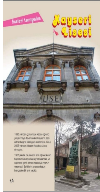
Görsel 7. TSE Öncü Çocuk Dergisi, s.14, Sayı:78

Becer'e göre sözcüğün biçimsel özellikleri (yazı karakteri, diziliş biçimi, espas vb.) içerdiği anlamı açıklayıcı ve simgeleyici bir işleve sahip olmalıdır (Becer, 2015). Derginin logotype'ında geçen "çocuk"