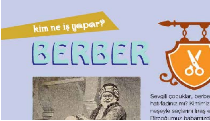
Görsel 10. TSE Öncü Çocuk Dergisi, s.22, Sayı:80

Okunurluk ve okuturluk için gerekli olan düzenlemeler, sayfa içerisindeki kompozisyondan bağımsız düşünülemez. Yazıların diğer öğelerle denge ve uyum içinde yerleşimi; okuma yönü, hızı gibi önemli hususları etkiler.