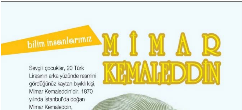
Görsel 9. TSE Öncü Çocuk Dergisi, s.28, Sayı:78, detay

Tipografik tasarımda harfin anatomik unsurlarının et kalınlıklarında incelik ve kalınlık gibi düzenlemelerine gidilir. Bu ağırlık düzenlemesi, okunabilir bir karakter yaratmak adına önemlidir. Fakat Comic Sans gibi esasen metin yazımı amacıyla tasarlanmamış çoğu yazı tipi, bu gibi ince ayarlardan yoksundur. Ağırlığın eksik olması, Comic Sans gibi yazı tiplerini hoş olmayan bir deneyim hâline getiren ana sorun olarak görülür (DFH, [19.11.2018]). Dergide pek çok farklı teşhir (display type) ve metin tipi (text type) kullanılmasına karşın metinlerde en çok Arial ve Comic Sans kullanımıyla karşılaşmıştır. Bunun dışında gövde metinleri için uygun olabilecek serifli tipler de dergide yer bulamamıştır.