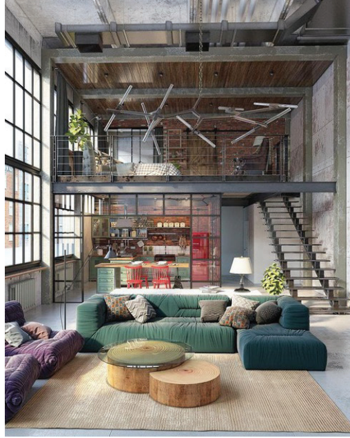
Görsel 1. Konut tasarım örneği

Gelişen teknoloji sayesinde kullanılan teknikler ve malzemeler de gelişme göstererek iç mimarlar, kullanıcıya farklı ve seçim olanağı tanıyan çeşitli öneriler sunabilmektedir. Bu gelişmeyle birlikte kullanıcı gereksinim, istek ve beğenileri de değişiklik göstermektedir. Burada önemli olan nokta iç mimarın böyle bir değişime ayak uydurabilmesidir. İç mimarlık disiplini açısından bir iç mimarın sahip olduğu kültür düzeyi ile özgünlüğü, farklı kültür yapısına sahip bireylere doğru tasarımlar yaparak hizmet verebilmesi önemli bir ölçüt sayılabilmektedir.