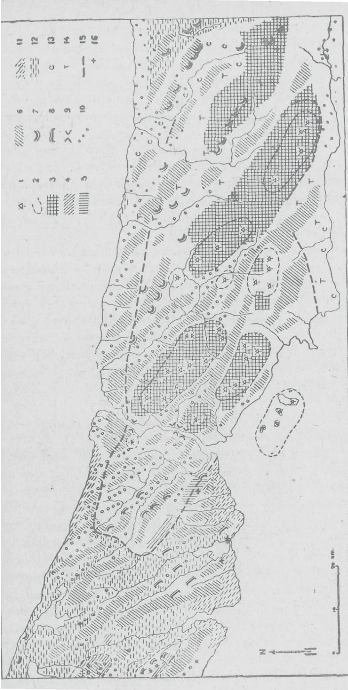
Şekil 1. İstanbul civarı ile Kocaeli yarımadasının jeomorfolojik taslağı (şekle ait izahat 139. sahifede).F