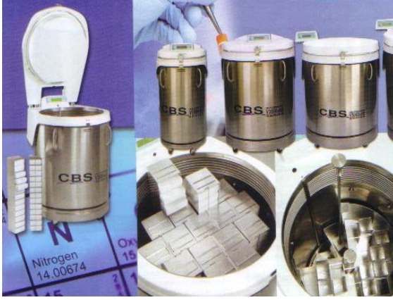
Şekil 2b. Isotermal Kuru Sistem Saklama Tankı Dış Görüntüsü (CBS V serisi)