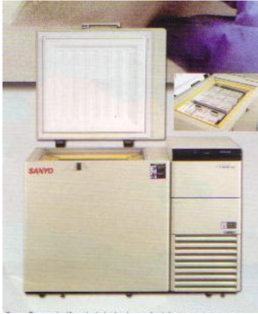
Şekil 3. -152^{\circ}\text{C} Derin Dondurucu (Sanyo, MDF-1156)