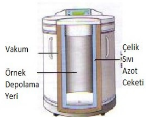
Şekil 2a. Isotermal Kuru Sistem Saklama Tankı İç Görüntüsü (CBS V serisi)