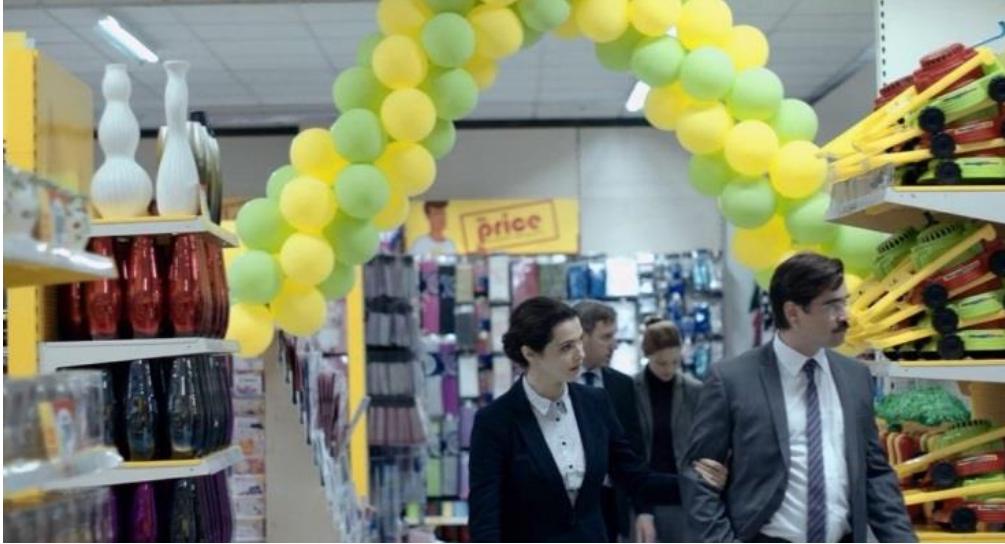
Resim 4: Şehir yaşamında bir market gezintisi

Üçüncü yaşam alanı olarak gördüğümüz mekân ise şehir yaşamıdır. Burada otel ve ormana nazaran günümüz yaşamına benzer bir yaşam mevcuttur. Süper-panoptik düzen olarak isimlendirebileceğimiz bu yaşamda tıpkı günümüzdeki gibi alışveriş merkezleri, çok çeşitli ürünler satan marketler ve mağazalar, çeşitli renk ve ihtiyaca göre tasarlanmış arabalar, makineler, kafeler, restoranlar bulunmaktadır. Bu sistemde karşımıza denetim mekanizması ve zor aygıtı olarak çıkan karakterler tıpkı günümüzdeki gibi kolluk kuvvetleridir. İktidarın güvenliğini ve mevcut ideolojinin devamlılığını sağlayan polisler toplum içerisinde yalnız başına gördükleri kişileri sorgulamakta ve kural ihlali fark ettiklerinde yakalamaktadır.