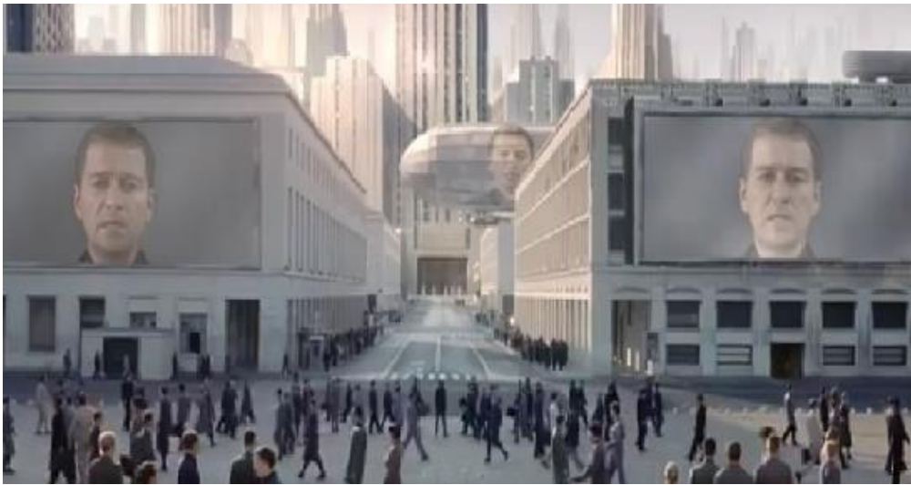
Resim 5: Peder'in dev ekranlardan görüntüsü

George Orwell'in 1984, Aldous Huxley'in Cesur Yeni Dünya gibi distopyalardan referans sunan film, III. Dünya Savaşı'nın sonrasında totaliter rejimle yönetilen Libria adındaki bir ülkenin distopik sistemini anlatır. Dev duvarlarla dış dünyadan soyutlanan topluluk, "Father/Peder" olarak anılan bir liderin idaresi altında bulunan Tetragrammaton 6 Meclisi tarafından yönetilmektedir.