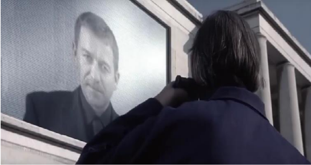
Resim 6: Peder ve Proziyum'un birey tarafından kullanılması

İnsanî duyguları dünya savaşının nedeni olarak gören yönetim, toplumdaki duyguları bastırmak için çeşitli yöntemler kullanmıştır. Bu yöntemlerin başında ise Proziyum adı verilen bir uyuşturucunun kullanımı gelmektedir. İnsanların bu ilacı kullanmaları sağlanarak tüm duygusal tepkileri/ duyumsamaları etkisizleştirilmiştir. Her ne kadar III. Dünya Savaşı sırasında ve sonrasında artan şiddet olaylarını yok etmek için geliştirilen bir ilaç da olsa aslında sisteme itaat eden, yönetilmesi kolay, duygusuz robot yaratmak için kullanılmaktadır. İnsanların düzenli olarak kendilerine enjekte etmeleri zorunlu tutulan bu uyuşturucu, duyguları köreltmekte ve sisteme uyumlu bireyler yaratmaktadır. Böylece bireylerin düşünce ve eylemleri yönetim tarafından denetim altına alınarak, toplumsal hayatları biçimlendirilmiş olmaktadır. Bu ilaçla tam bir disiplin içerisinde herkes belirlenmiş olan baskıcı kurallara uymak zorunda bırakılır. Vücuda enjekte edilen bu ilaç, yönetime göre toplumu bir arada tutan yapıştırıcıdır.