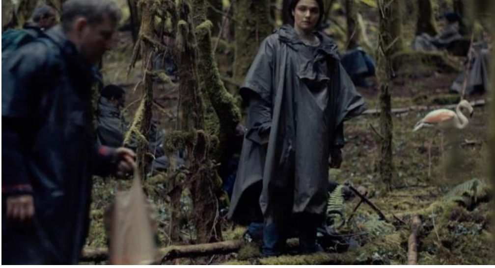
Resim 3: Orman yaşamından bir sahne

Bir diğer yaşam alanı olarak karşımıza çıkan yer otoriteden kaçış olarak adlandırabileceğimiz mekân olan Orman'dır. Günümüzde olduğu gibi filmde de sistem kendi alternatiflerini ve muhaliflerini doğurmuştur. Gözetime ve sisteme dahil olmak istemeyen kitleler oluşmuş, bu kitleler kendilerine yeni yaşam alanları yaratmaya çalışmıştır. Filmde kendilerini Yalnızlar olarak adlandıran bir grup kaçış karakteri bulunmaktadır. Bu kişiler eşli yaşamın zorunlu olduğu dünyada ideolojik görüş olarak eşsiz yaşamayı ve bunun kesinliğini benimsemişlerdir. Otel'e yakın bir ormanda illegal olarak yaşayan bu grup daha güçlü olan otorite elemanları tarafından avlanmaktadır. Bu iki grubun arasında sürekli bir savaş ve kriz mevcuttur. Kadın bir lidere sahip olan ve çok kesin kuralları bulunan bu topluluk çift olmayı reddetmenin yanı sıra yalnız olmayı mutlak koşul olarak kabul etmektedir. Sistemin belirlediği normallik sınırları dışında marjinal bir şekilde yaşayan bu grup içerisinde duygusal ilişki geliştirmek ve başka birisine ölüm tehlikesi olsa dahi yardım etmek kesinlikle yasaktır. Bu grupta da kurallar en az Otel'deki kadar serttir. Örneğin biri ile öpüştüğü tespit edilen üyenin dudakları jiletlenmektedir.