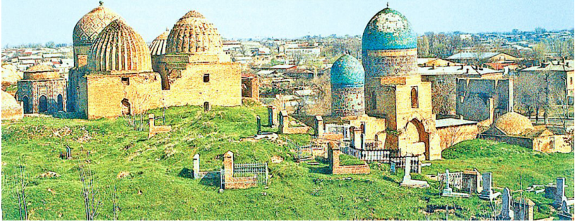
Şâh-ı Zinde; Özbekistan'ın Semerkant şehrinde Kusem b. Abbas'ın türbesi etrafında zamanla oluşan yapılar topluluğu [95]

Kusem (ra), Muâviye (ra) döneminde Horasan Valisi Saîd b. Osman b. Af-fân'ın kumandasında Horasan civarındaki fetihlere katıldı. Savaşta gösterdiği kahramanlık karşılığında ganimetten bin hisse ayrılması teklif edildiye de ganimetlerin beşe taksim edilip diğer kişilerin hakları verildikten sonra kendisine pay ayrılması gerektiğini belirtti. Fazilet ve takvâ sahibi olan Kusem (ra), Saîd b. Osman'la birlikte Semerkant seferine katıldı (56/675) ve Semerkant'ta şehid oldu. Mezarı zamanla ziyaretgâh haline gelmiş, etrafına cami ve medrese yapılmıştır. Kusem'in (ra) Semerkantlılar arasında "Şâh-ı Zinde" (yaşayan sultan) diye anılan mezarına Bâbü'r devrinde Mezarşâh adı verilmiştir. [94]