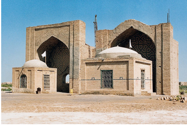
Merv'de Sahâbe türbeleri (Büreyde b. el-Husayb el-Eslemî (ra) ve Hakem b. Amr el-Gıfârî (ra)) [70]

*Ca'd b. Hübeire (جعدة بن هبيرة): Kureyş'in Benî Mahzum kolundandır. Annesi, Hz. Peygamber'in (sas) amcası Ebû Talib'in kızı Ümmü Hânî'dir. Hz. Peygamber (sas) döneminde doğmuştur. Hz. Ali (ra) adına Horasan'ı idare etmiştir. Muaviye'in (ra) hilafeti döneminde vefat etmiştir. [71]