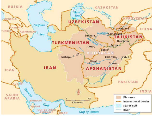
Horasan'ın günümüzde hangi ülkelerin sınırları içinde kaldığını gösteren bir harita [24]