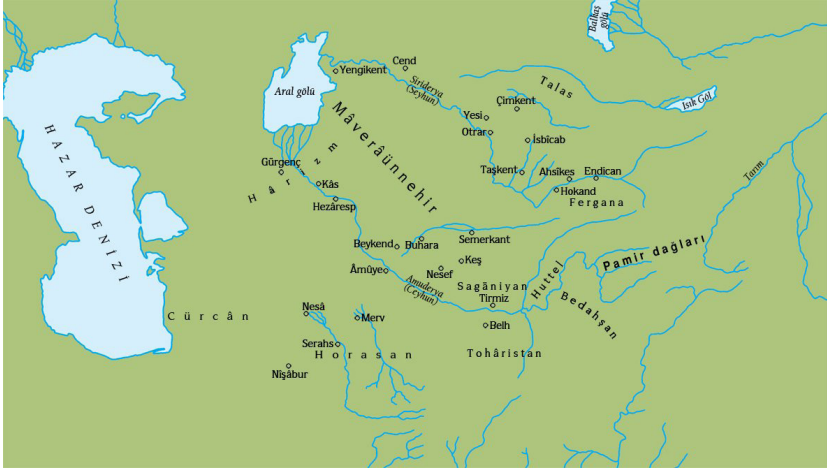
Orta Asya'da Horasan ve Mâverâünnehir

Huttal (Huttalân), Tirmiz, Guvâziyân, Ahsîkes, Hârizm, Fârâb, İsbîcâb, Talas, İlak ve Hucend'i kapsadığını; İbn Havkal doğusunda Pamir, Reşt ve düz bir çizgi üzerinde Huttel'e sınır Hint topraklarının, batısında Tarâz'dan itibaren batıya doğru Bârâb (Fârâb), SütKent, Semerkant'a tâbi Soğd, Buhara ve tâbi yerler, Hârizm ve Hârizm denizine (Aral gölü) kadar yay halindeki bir çizgi üzerinde Oğuzlar ve Karluklar ülkesinin kuzeyinde Fergana'nın doğu ucundan Tarâz'a kadar uzanan düz bir çizgi üzerindeki Karluk topraklarının, güneyinde ise Bedahşan ve Hârizm denizine kadar düz bir çizgi üzerinde Ceyhun nehrinin yer aldığını ve Huttal'in de Mâverâünnehir'e dâhil olduğunu kaydeder. [29] Mâverâünnehir, ilk fetih yıllarından itibaren idarî açıdan Horasan'ın bir parçası olarak kabul edilmiştir