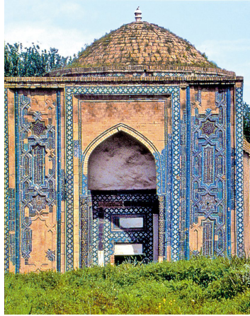
Kusem b. Abbas (ra) Türbesi – Semerkant [96]