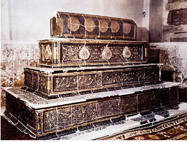
Kusem b. Abbas'ın (ra) sandukası [97]

*Muhammed: Resûlullah'ın (sas) mevlası (محمد، مولی رسول الله صلى الله عليه وآله): el-Hâkim en-Nisâbü'rî, Târîhu Nisâbü'r adlı eserinde onun Horasan'a gelen sahâbe arasında kaydetmiştir. Aslında Fars asıllı Mecusî bir tüccâr olan ve ismi "ماناهیه" olan Resûlullah'ın (sas) mevalısı Muhammed, onun (sas) peygamberlikle ortya çıktığından haberdar olunca kendisine ait ticârî eşyasıyla Merv'den yola çıkarak Medine'ye gelmiş, Müslüman olmuş, Resûlullah (sas) ona Muhammed ismini vermiş ve Müslüman olarak Merv'e dönmüştür. Evi, Merv Ulucâmisi'nin karşısındaydı. [98]