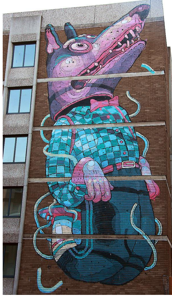
Resim 13. Aryz, See No Evil Etkinliđi, 2011

Sokak sanatı eserleri, sadece özgünlük oluşturan veya ortama renk katan dekoratif bir öge olarak sergilenmemektedir aynı zamanda mekân oluşturma, bireyleri bir araya getirme yoluyla topluma fayda sağlayarak kültürel cazibe merkezlerini dolaylı yoldan desteklemiştir. Buradan yola çıkarak sokak sanatında kullanılan muralların hayal gücünü ve yaratıcılığı ateşleme yeteneğine sahip olduğu ifade edilebilir (Kızılkın & Ocakçı, 2020: 960).