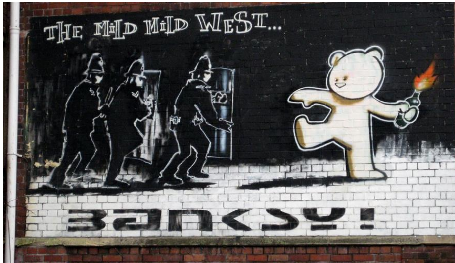
Resim 2. “The Mild Mild West”, Banksy, 1998

Duvarlar Ateşe çalışması grafiti dünyası için çok önemliydi ama Banksy’nin birkaç ay sonra yaptığı bir işi onu Bristol’de daha büyük bir çevrede tanınır kılmıştı. Resim 2’de sanatçının “The Mild Mild West” adlı eseri, metruk bir binanın duvarına yaptığı dev bir çalışmadır. Bir oyuncak ayı elindeki molotof kokteyliyle kendisine doğru gelen üç polisin karşısında durmaktadır. Buradaki mesaj aslında açıktır. Oyuncak ayı iyi vatandaşları temsil etmesine karşın molotof atamayacak kadar sevimli insanları sembolize etmiştir ve karşısında zalim polisler bulunmaktadır. Çelişkileri de bu denli sadeleştirilmiş figürlerle işleyen sanatçı, bir tepkiyi veya bu durumda kalan insanların ne düşündüğüne ait belirsiz bir duyguyu zekice yakalama becerisini ortaya koymaktadır.