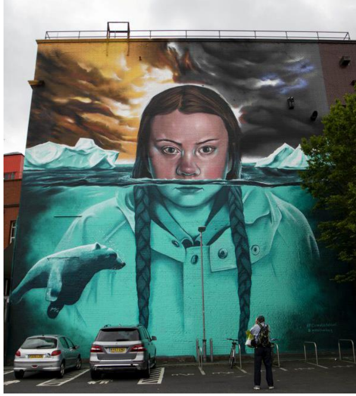
Resim 11. Jody, Greta Thunberg Eseri, Upfest Sokak Sanatı Festivali, 2019

John Lennon muralı yerine yapılacak eser hakkında birçok spekülasyon dönmüş ve birçok insan, Simpsonlar'ın 10. yıl dönümü olması vesilesiyle Simpson ailesinin yapılacağı fikrine odaklanmıştır. Ancak Lennon'ın yerine Upfest'te dünya genelinde önemli politik yaklaşımlar sergileyen son yılların en önemli iklim aktivisti Greta Thunberg'in dev bir muralı Jody adlı bir sanatçı tarafından yapılmıştır. (Resim 11.) 15 metre yüksekliğe sahip bu dev muralın yapımı 8 gün sürerken yerel bir sanatçı olan Jody, Greta'yı "İklim değişikliğine karşı mücadelede yeni bir hareketin öncüsü" olarak tanımlamıştır (Howick & Hesson, 2021). Jody'nin Greta Thunberg'i tasvir etmesinin en önemli sebebi, henüz on altı yaşında olmasına rağmen global anlamda iklim değişikliği konusundaki tartışmaları çok farklı bir boyuta taşıyabilmesinden kaynaklanmaktadır. Dolayısıyla küresel iklim krizi konusunda farkındalık yaratan çalışmalarından ötürü onu bu dev duvarda tasvir ederek onurlandırmayı amaçlamıştır.