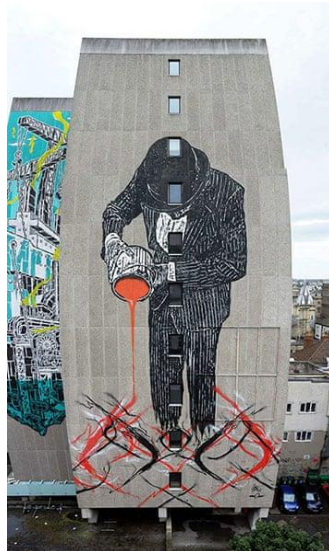
Resim 4. Nick Walker ve SheOne ortak çalışması, See No Evil Etkinliği, 2012