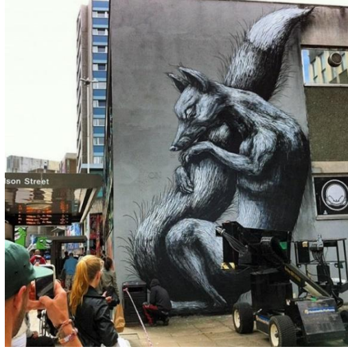
Resim 5. ROA, See No Evil Etkinliği, 2012

Bristol doğumlu Nick Walker’ın yarattığı devasa karakter de bu koleksiyonun önemli parçalarındandır. Karakterin alt bölümünde ise Londralı SheOne takma adını kullanan James Choules’un soyut fısıltıları bulunmaktadır. (Resim 4.) İki farklı sanatçının oluşturduğu bu eşsiz eser, zamanında Birleşik Krallık’taki en büyük sokak sanatı duvar resmi olarak anılmıştır.