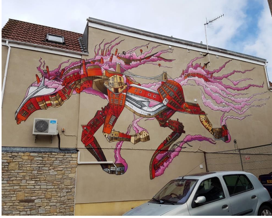
Resim 12. Andy Council, Batı Sokağı Atı, 2017

Andy Council, geleneksel animasyon ve çizim tekniklerinde eğitim almış Bristol merkezli bir illüstratördür. Bristol'ün eşsiz kent peyzajı, sokak sanatı tarihi ve şehir efsaneleriyle canavarlara olan hayranlığı onun çalışmalarının oluşumuna büyük bir etki etmiştir. Andy, tuhaf karmaşık yaratık koleksiyonları oluşturmak için çizim becerilerini ve detay sevgisini çalışmalarında sıklıkla kullanmıştır. Birbiriyle fiziksel ya da ruhsal olarak hiçbir şekilde bağdaştırılamayan birçok oluşumu tek bir potada eritmeyi başaran sanatçı tanklardan yapılmış tavşanlara, tarihi yapılardan oluşmuş dinozorlara kadar pek çok şeyi çalışmalarında kullanmıştır. Özellikle kent manzaraları ile yapı peyzajları, yarattığı mitolojik hayvanların gövde ve uzuv yapılarını oluşturmuştur. (Council, 2021)