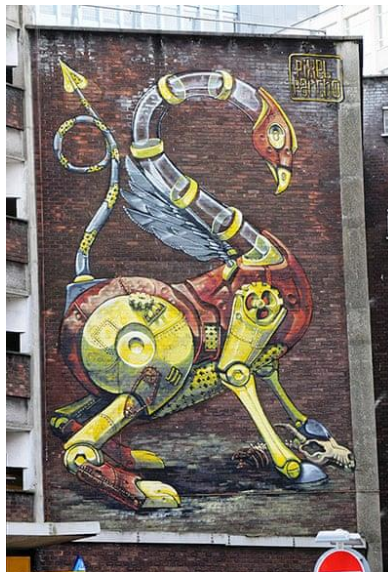
Resim 6. Pixel Pancho, See No Evil Etkinliği, 2012

ROA takma adıyla bilinen Belçika asıllı sanatçı ise dünyadaki birçok şehirde hayvanları farklı açılar ve yapılarla kompozisyonuna dahil etmektedir. (Resim 5.) Bu resimler, dünyanın mural merkezi olarak bilinen Bristol’ün çlgın ve eşsiz gerilla sanatıyla nasıl çalkalandığının bir göstergesi durumunda olmasının yanı sıra uzmanlar tarafından bu durum 'Banksy etkisi' olarak adlandırılmaktadır (DeTurk, 2015: 22)