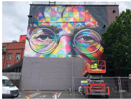
Resim 10. Eduardo Kobra'nın Lennon çalışmasının gri boya ile boyanan anı

Her yıl kesintisiz geliştirilmeye çalışılan bahsi geçen festivalde, Bristol yetkilileri zaman zaman şehir içerisinde bazı muralları temizlemektedir. Bu temizlikten maalesef Kobra'nın eseri de nasibini almış ve yeni eserler üretilmesi adına üzeri gri boya ile kapanmıştır. Lennon hayranlarının bu muhteşem sanat eserinin kaybı sebebiyle uzun bir süre yas tuttuğu bilinmektedir. Çünkü çok uzaklardan görülebilen renkli, güzel detaylandırılmış bir sanat eseri yerine artık insanların gözlerini kapatarak geçip yürüdükleri dev gri bir boşluk görülmektedir. (Resim 10.)