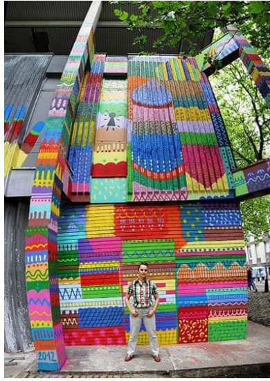
Resim 7. Kashink, See No Evil Etkinliği, 2012

Bir şehirde sokak sanatlarıyla her an karşılaşılabilir olunması ya da birkaç saatte değiştirilebilir olması gibi özellikler, bu sanatın diğer sanat tutumlarından farkını ortaya koymaktadır. Ayrıca şehirde yaşayan halkın veya turistlerin herhangi bir bedel ödemediği çalışmalara rahatlıkla erişmesi gibi mekânsal olanakları da kendi içerisinde barındırmaktadır. Zira sokak sanatı, içinde yer aldığı şehrin modern sanatla olan uğraşı ve ifade biçimidir. Bu aracı sanat yaklaşımı sanatçı ve izleyiciyi bir araya getirmeyi başarmış ve ruhsuz yapı duvarlarının renkli kompozisyonlarını halka mal etmiştir. Bu sanat anlayışının mülkiyet kavramına karşı olmasının yanı sıra şehrin her karesinin tüm insanlara ait olduğu anlamı çıkmaktadır (Karaaslan, 2008). Bu yüzden şehirde yaşamış tüm izleyiciler sokak sanatını ancak yaratıcılığın ve özgünlüğün sınırlarını kestirebildikleri kadarıyla tanımlayabilir. Özgünlük ve yaratıcılık dendiğinde ise yine See No Evil Etkinliklerinde Pixel Pancho takma adı ile bilinen İtalyan sanatçının robotumsu fantastik canavarı şehirde sürrealist bir yaklaşımla izleyicilerle buluşmaktadır. (Resim 6.)