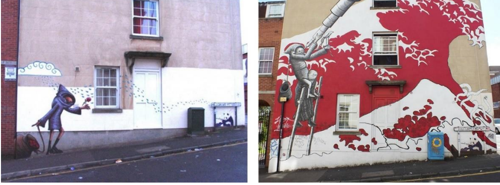
Resim 15. Phlegm, Yağmur Bulutları, 2008. MM13 ve Phlegm, Tsunami, 2009

Sokak sanatçılarının eserleri dünyanın en ünlü galerileri tarafından dudak uçuklatan fiyatlara satılıyorken onlar hiçbir zaman şöhret ve para peşinde olmamışlardır (Örnek, 2021). Bununla birlikte sanat galerilerinde sergilenmeye ‘layık’ görülecek ‘çerçevelemiş’ düşüncelerin bir parçası da olmak istememişlerdir (Özen & Eken, 2017: 501). Melez biçimler, teknikler ve mesajlarla kent içerisindeki kamusal mekânların sanatçılar tarafından boyanması sanatçıların yegâne amaçlarından biridir. Ayrıca mural sanatçılar, kent içerisindeki bir sokağın sunduğu görsel biçimlerin tespitlerini iyi yapabilme yeteneğine sahiptirler. Bununla birlikte kent halkına da alışık olduklarının dışında farklı bir estetik doyum sağlamayı amaçlamaktadırlar (Taş & Taş, 2015). Resim 15’teki eseri Stokes Croft sakinleri büyük bir sevgiyle “Tsunami” olarak isimlendirmiştir. Bu çalışma aslında bir önceki sanatçının çalışmasının üzeri boyanarak oluşmuş bir eser olduğu belirtilmelidir. Phlegm takma ismini kullanan sanatçı ilk olarak 2008’de evin duvarına soldaki resmi yapmış ve buna “Yağmur Bulutları” adını koymuştur. Ancak 2009’da MM13 adlı bir ekip, çalışmanın üstünü parlak ve devasa kırmızı dalgayla kapladıktan sonra Phlegm, karakterlerini eklemek için Temmuz 2009’da geri dönmüştür. Kırmızı dalgaların üstüne kendine has figürlerinden bir kompozisyon kurgulayan sanatçı, tiplerleriyle bu büyük eseri tescilleme gereği duymuştur. (Doyle, 2021)