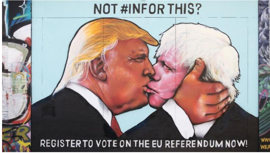
Resim 8. Painsmith Grubundan FXL ve Dones'un çalışması, 2016