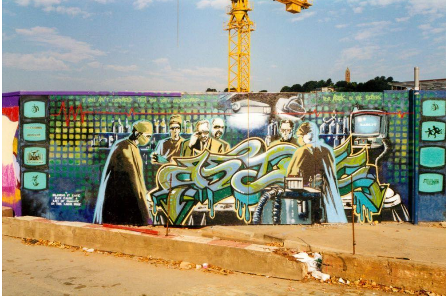
Resim 1. Banksy, Duvarlar Ateşe, 1998

sanatçı “Duvarlar Ateşe” adlı çalışmayı ortaya çıkarmışlardır. (Resim 1.) Büyük oranda elle çalışan sanatçılar eserde daha önce hiç görülmemiş şekilde karamsar bir grup doktorun ameliyat masasının etrafında toplandığı bir ân kompozisyon olarak tercih etmişlerdir. Resmin iki yanında Banksy’nin klasikleşen şablonlarından ekranlar bulunmaktadır. Ameliyat masasının üzeri düzenli grafiti harfleri ile oluşturulmuş ASTEK (ölen bir arkadaşı) yazısıyla kapanmıştır (Selvi & Koca, 2016: 281).