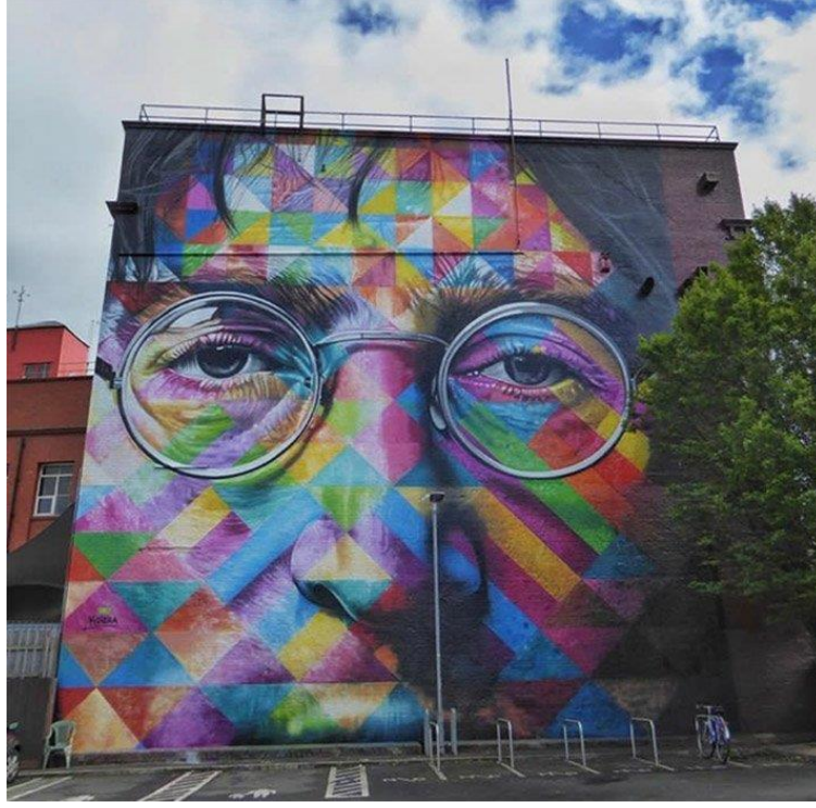
Resim 9. Eduardo Kobra, Upfest Sokak Sanatı Festivali, 2017