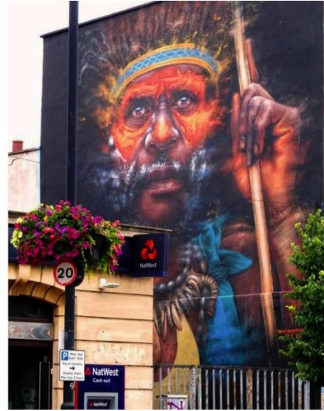
Resim 17. Dale Grimshaw, Papau Yeni Gine Halkından Portreler, Upfest Sokak Festivali, 2016 ve 2019

Dale Grimshaw, İngiltere’nin derin ve karanlık kuzeyi olarak bilinen Lancashire’da doğmuştur. Sanatçı son beş yıldır Resim 17’deki gibi Afrika halkının içinde bulunduğu yorgun durumu vurgulayarak eserler üretmektedir. Büyük ölçekli duygusal resimler yapan sanatçı kullandığı canlı renk paletleri ile bu halk üzerine daha duyarlı olunmasını amaçlamaktadır. Özellikle yerli halklara olan ilgisi, onu Papua Yeni Gine halkına odaklanmaya yöneltmiştir. Adanın batısında olup biten ve pek çok insanın bilmediği bazı siyasi olayların bilinmesi amacıyla resim yapan sanatçı, “İyi bir sokak sanatı eseri yaparsanız insanlar ona sahip çıkar. İnsanların 'Bu bizim duvar resmimiz, bizim için yapıldı.' demesi bile gerçekten çok güzel.” diyerek sokak sanatlarına dair