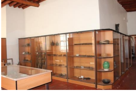
Görsel 17. Teşhir Salonunda Yer Alan Farklı Eserler