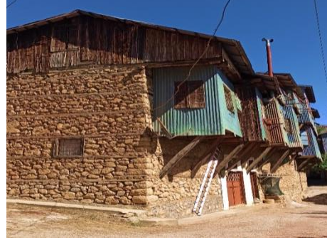
Görsel 3. Kemaliye (Eğin)Evlerinden Bir Örnek