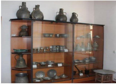
Görsel 19. Teşhir Salonunda Yer Alan Mutfak Araç Gereçleri