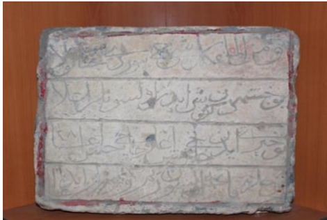
Görsel 21. Teşhir Salonunda Yer Alan Kitabe