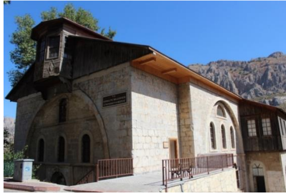
Görsel 8. Kemaliye Etnografya Müzesinden Genel Bir Görünüm