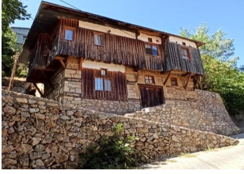
Görsel 2. Kemaliye (Eğin)Evlerinden Bir Örnek.