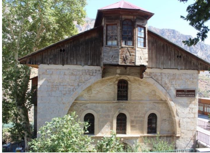
Görsel 9. Müzenin Batı Cephesinden Bir Görünüm

Yapının cephelerinde yer yer aşınma ve yıpranmalar olsa da genel itibariyle oldukça sağlamdır. Berrin Alper'in 1990 yılına ait doktora tezinde binanın farklı işlevler için kullanıldığı ve zaman içerisinde iç mekânda büyük bir değişim geçirerek özgünlüğünü büyük oranda yitirdiğini belirten ifadeler yer almaktadır (Alper, 1990: 51). Yapılan son restorasyonlarda; apsisin sağ ve solunda yer alan pastoforion hücreleri orijinal dokusunu korumakta ancak narteks ve naos arası 60 cm taş duvar ile doldurulmuştur. Yapının kurşun ile kaplı kubbesi, yerine kırma çatı ile yeni bir örtü sistemine bırakmıştır. Ayrıca binanın kesme taş duvarları, kemerleri, taş duvarlardaki ahşap doğramalar özgün yapısını korumaktadır. Fırat'a (Karasu) bakan arka cephede (güney cephe) pencere ve korkularındaki ahşap malzeme kullanımının yoğunluğu da oldukça dikkat çekicidir. Fakat kilise yer yer iç mekânda ve mekânsal yeni eklemeler ve değişimler geçirmesine rağmen hacimsel kütesini koruyarak günümüze kadar ulaşmayı başarmıştır (Kemaliye Belediyesi). ( Görsel 9-12 ).