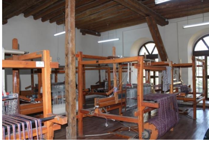
Görsel 12. Müzenin Zemin Katı Dokuma Atölyesi

Müzenin Teşhir Tanzim Düzeni: Kiliseden müzeye dönüşümü sağlanan bina, yapılan son restorasyonlar ile yeniden hizmete açılmıştır. Kilisenin zemin katı dokuma (gazenne) atölyesine, birinci katı ise müzenin teşhir salonlarına ayrılmıştır ( Görsel 12 ).