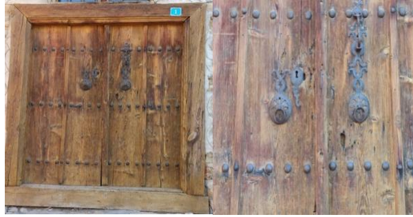
Görsel 4-5. Kemaliye (Eğin)Evleri Kapı Örneği ve Kapı Tokmağından Detay