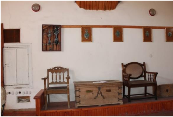
Görsel 15. Ana Salonda Sergilenen Eserlerden Detay