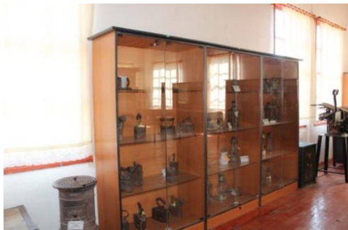
Görsel 23. Ütü ve Gaz lambalarından bir Görünüm