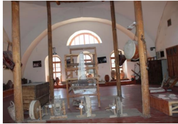
Görsel 16. Ana Salonda Sergilenen Dokuma Tezgâhı

Ana salondan sonra diğer teşhir odalarına ulaşılmaktadır. Odalar birbiri ile bağlantılı yalnızca arada küçük bir koridor bulunmaktadır. Odaların ilkinde, kırbaç, fener, kapı kilit ve anahtarlar, kapı tokmakları, ikinci oda da ise tesbihler, el yazma eserler, kuran-ı Kerimler, menkubeler, kitabe örnekleri, gaz lambaları, zemzemlik, tepsi, küllük, su testisi, maşrapa, örme sepet, çorba tası, kav çakmağı vitrinde teşhire sunulmuştur. Ayrıca taş devrinde kullanılan birkaç alete de yer verilmiştir. Üçüncü odaya baktığımızda ise kepçe, kevgir, bakraç, kömür ütöleri, taslar, tabaklar, güğümler, mataralar, havan ve ibriklerden oluşan mutfak malzemeleri teşhire sunulmuştur. Dördüncü odada ise kadın başlığı, fener, porselen lambalar, tunç gaz lambaları, dikiş makineleri bulunmaktadır. Beşinci odaya geldiğimizde ise daktilo, kadın ve erkek kıyafetleri, cezve, fener, telkâri tepsi, fincan, zemzemlik, çaydanlık, ayakkabılar, kurşun kabı, çeşitli silah aletleri, potin ayakkabı, çoraplar, ahşap oyma aletleri, ütüler, radyo, fener ve gaz lambalarına yer verilmiştir ( Görsel 17-26 ).