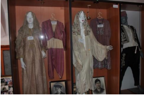
Görsel 25. Çeşitli Kıyafetlerin Sergilendiği Vitrinden Bir Görünüm