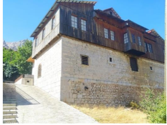
Görsel 11. Müzenin Doğu Cephesi

Müzenin Teşhir Tanzim Düzeni: Kiliseden müzeye dönüşümü sağlanan bina, yapılan son restorasyonlar ile yeniden hizmete açılmıştır. Kilisenin zemin katı dokuma (gazenne) atölyesine, birinci katı ise müzenin teşhir salonlarına ayrılmıştır ( Görsel 12 ).