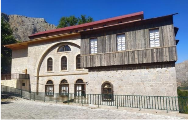
Görsel 10. Müzenin Güney Cephesi