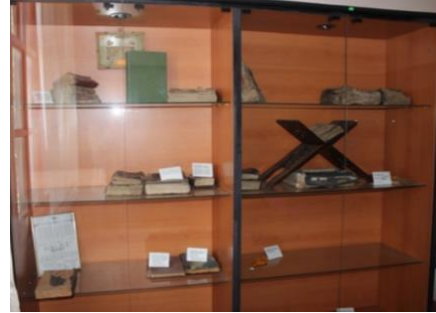
Görsel 18. Teşhir Salonunda Yer Alan Yazma Eserler ve Kuran-ı Kerimler