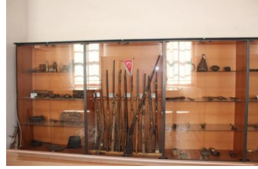
Görsel 26. Çeşitli Silah Aletlerinin Sergilendiği Vitrinden Genel Bir Görünüm