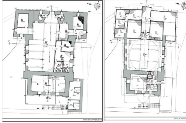
Görsel 6 Müzenin Zemin ve I. Kat Planı ( Kemaliye Belediyesi)

Müzenin Fiziki Durumu: Günümüze kadar ulaşmış olan yapı, “T” şeklinde kubbeli, kâgır ve sütunsuz plan özellikleri taşımaktadır. Yapıda kesme taş ve ahşap malzeme yoğun bir şekilde kullanılmıştır. Kilise, zemin kat, 1.2. ve 3. kat (çatı arası) şeklinde inşa edilmiştir ( Görsel 6-8 ).