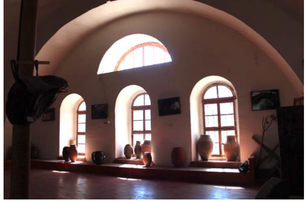
Görsel 14. Ana Salonda Sergilenen Eserlerden Detay