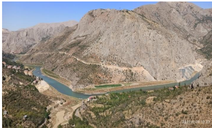
Görsel 1. Yukarı Fırat (Karasu)

Erzincan iline bağlı Kemaliye, Doğu Anadolu Bölgesi’nin kuzeybatı sınırında, Yukarı Fırat (Karasu) Vadisi’nin batı kısmında bulunmaktadır ( Görsel 1 ). Kemaliye toprakları, batıda Yama dağları, doğuda Munzur dağları ve iç doğu Toroslar olarak isimlendirilen alanda engebeli bir arazi üzerine konumlanmaktadır (Arıkan, 2003: 2). İlçe, dağlık bir arazi üzerinde, Karasu Irmağı tarafından açılmış kuzey- güney doğrultusunda uzanan vadinin batı yamacında yer almaktadır. Kemaliye, kuzeyde Ilıç, doğudan Tunceli’nin Çemişgezek ve Ovacık, batıdan Sivas’ın Divriği, güneyden Malatya’nın Arapgir ve Elazığ’ın Ağın ilçeleri ile çevrili küçük bir kasaba mahiyetindedir. Küçük bir yerleşim alanı olmasına rağmen ilçe, konumu itibarıyla Erzincan, Elazığ ve Malatya illeri arasında özel bir konuma sahip olup geçiş güzergâhı üzerinde bulunmaktadır (Akpınar, 2004: 210-211).