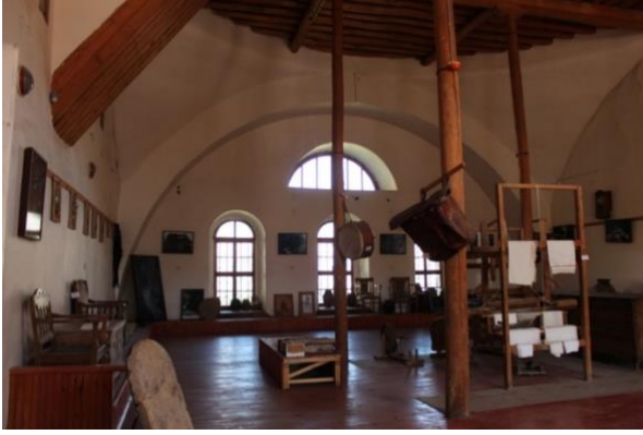
Görsel 13. Ana Salondan Bir Görünüm