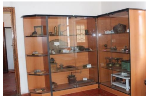
Görsel 24. Tepsi, Kahve Değirmeni ve Diğer Mutfak Genel Araç Gereçlerinden Genel Bir Görünüm