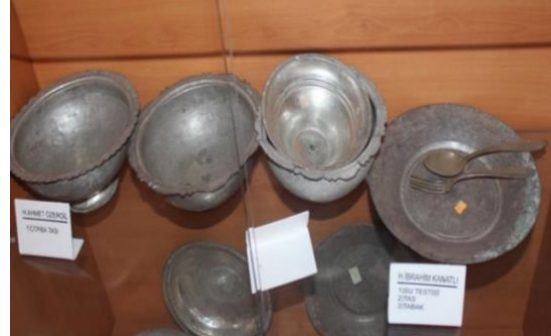
Görsel 20. Çeşitli Mutfak Malzemelerinden Detay