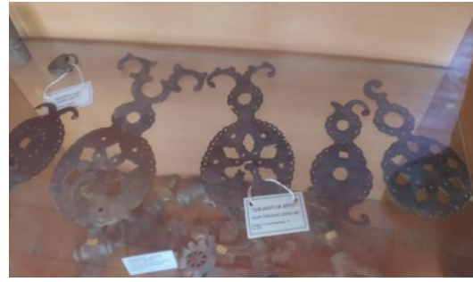
Görsel 22. Teşhir Salonunda Yer Alan Kapı Tokmak Örnekleri