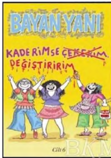
Görsel 5: Bayan Yanı Mizah Dergisi

https://leventerturk1961.wordpress.com/2014/07/17/ramiz-gokce/