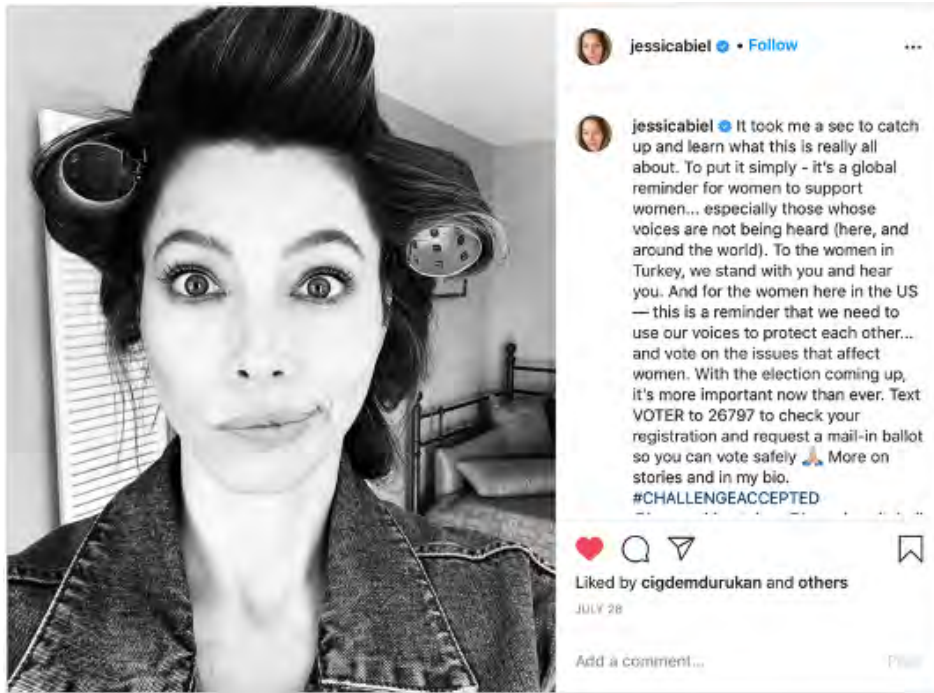
Görsel 1: Jessicabel, #challengeaccepted hashtag’iyle sosyal medyada paylaşımı.

birlikte, Dördüncü Dalga Feminizmde kadın sorunlarından çok dalganın yeniliği üzerine de tartışmalar yapılmıştır. Çünkü; Dördüncü Dalga Feminizminin, “yeni bir dalga” olarak kavramsallaştırılması kimi zaman kadınların anlatmak istediği düşünceden çok, dalganın biraz daha ön planda kalmasını sağlamıştır. Çoğunlukla dördüncü dalgaya dayandırılan yenilik kavramı daha çok Facebook, Twitter gibi gelişen medya ve teknoloji biçimleriyle yani yeni medya mecralarıyla ilgilidir (Rivers, 2017:107). Örneğin; sosyal medya mecralarında herhangi bir düşünce altında birleşen kadınlar, hemen hashtag oluşturarak tepkilerini ve görüşlerini hastag’in altına yazdıkları yorumlarla dile getirmektedirler. Ülkemizde son zamanlarda yaşanan kadın cinayetlerindeki artışın önemini belirtmek amacıyla pek çok kadın sosyal medya mecralarından #challengeaccepted hashtag’iyle siyah beyaz fotoğraflarını paylaşarak bu durumun yanında olduklarını göstermişlerdir. Yurt dışından da destek alan hashtag tüm dünyada yankı uyandırmıştır (Görsel 1). Daha önce başka hastagler altında #metoo, #heforshe gibi sosyal medya da çeşitli kampanyalar yaratılmıştır.