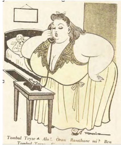
Görsel 4: Ramiz Gökçe, Tombul Teyze karakteri.

https://leventerturk1961.wordpress.com/2014/07/17/ramiz-gokce/