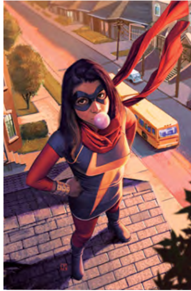
Görsel 7: Ms, Marvel # 2. Kamala Khan. Mart 2014.

https://marvel.fandom.com/wiki/Ms._Marvel_Vol_1_1