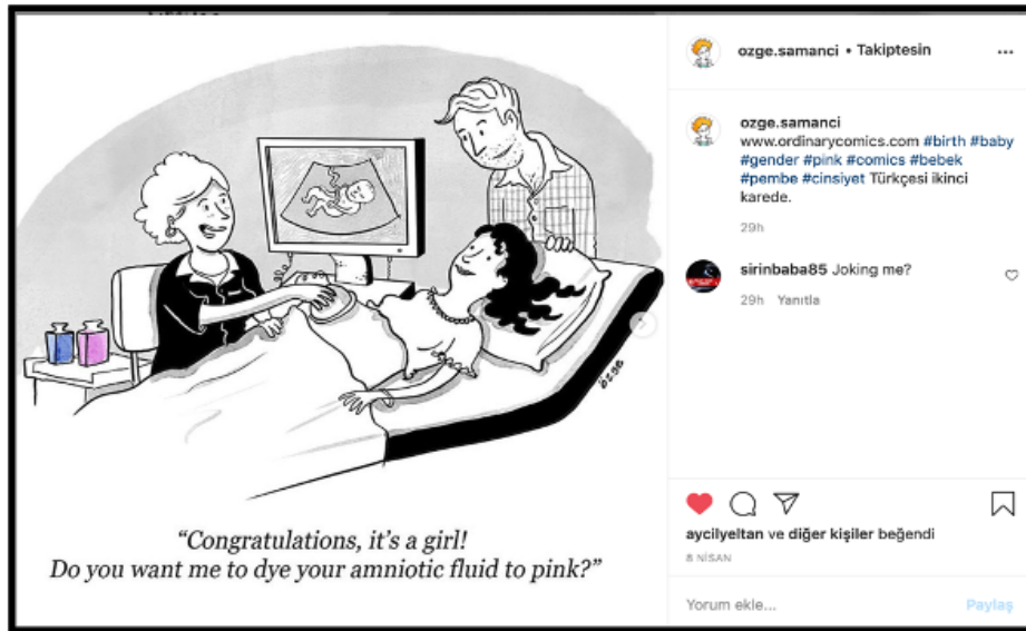
Görsel 6: Özge Samancı tarafından çizilen bir grafik anlatı.

Günümüzde ise çizgi romanların basılı yayınlardan hareketli ortamlara taşınması onların dijitalleşmesini sağlamıştır. Özellikle sosyal medyada bu çizgi romanları içeren illüstrasyonların grafik anlatı şeklinde yayınlanması kadınların ulaşımı açısından rahatlık sağlamaktadır. Yine çizer Özge Samancı'nın, Instagram hesabında paylaştığı bir çiziminde; doğum kontrolüne giden bir anne ve babanın yaşadığı bir an resmedilmiştir. Çizimde kadın doktor tarafından hamile kadına "Tebrikler, bir kız! Amniyotik sıvını pembeye boyamamı ister misin?" gibi cinsiyetçi bir soru sorulmaktadır. Arka tarafta masanın üstünde ise; ironik olarak mavi ve pembe renkle doldurulmuş şişeler durmaktadır (Görsel 6). Son yıllarda özellikle otobiyografik ve grafik anlatıların sosyal medya hesaplarından paylaşıyor olması feminizmdeki yeni dalga hareketlerinin etkisinin bir göstergesidir. Dördüncü ve Beşinci Dalga Femizim ile kadın hareketlerinde yaşanan teknolojik gelişmeler, yeni medya mecralarının kullanımının kadınlar arasında artması, çizgi romanların hem okunmasında hem çiziminde başka bir boyuta ulaşmasını sağlamıştır. Zaman, kadınların grafik anlatılarını çizdiği ve paylaştığı feminist harekete ilerlemektedir. Feminizmde yaşanacak olan altıncı bir dalganın bu grafik anlatı ve kadın çizerler üzerine odaklanmasını düşünmek olanaklıdır. Ayrıca son dönemde çizgi romanlarda ve filmlerde yaratılan süper kahramanlar ele alındığında çoğunlukla popüler feminist kadın karakterler yaratıldığı görülmektedir.