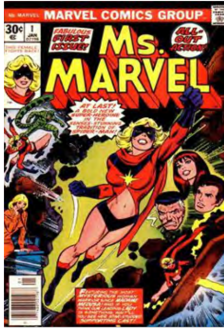
Görsel 8: Carol Danvers. Ms. Marvel #1. 1977.

Avengers'ın bir üyesi olarak göstermiştir. 1980'lere doğru ise Ms. Marvel tecavüze uğrayarak hamile kalmıştır. Yıllarca çeşitli çizgi roman ve sinema filmlerinde Carol Danvers; Binary, Warbird, Captain Marvel gibi farklı isimlerle anılmıştır. Ayrıca Carol Danvers'a, Ms. Marvel'a dönüşmesinden dolayı feminist yaklaşımlarda da bulunulmuştur. Görsel 8'de de görüldüğü üzere Ms. Marvel karakteri, göbeği açık ve hatlarını olduğu gibi gösteren seksi kos-tümüyle erkeklerin ilgisini uyandıracak tarzda resmedilmiştir. Yine Kamala Khan karakterinde olduğu gibi Ms. Marvel'da tanınmamak için siyah bir göz maskesi takmaktadır.