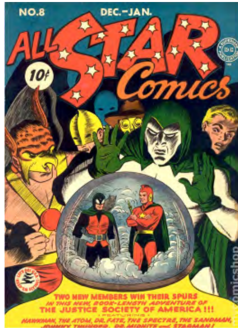
Görsel 9: All Star Comics #8 kapağı. DC. 1941 December. (Mycomicshop).

Çizgi romanlardaki kadınların temsili, özellikle Amerika’da İkinci Dünya Savaşından sonra değişmiştir. Çünkü bu tarihten sonra çizgi roman panellerine politik ve sosyal bir yaklaşım geliştirilmiştir. Bu değişimin içerisinde yaratılan karakterlerden biri de DC yayınevini yaratmış olduğu Wonder Woman’dır. Wonder Woman, çizgi romandaki kadınların erkek kahramanın maceralarına ikincil karakter olarak eşlik ettiği, ev kadını ve birer anne figürü olarak gösterildiği zamanlardan sonra güçlü ve feminist bir karakter olarak ortaya çıkmıştır. Bu nedenle kadınları güçlü bir varlık olarak temsil eden Wonder Woman, ataerkil düşünceden bağımsız olarak her bireyin eşit olduğu feminen bir toplumun simgesidir (Sabin, 1996:86). İlk olarak Amerikan çizgi romanında 1941 yılında, All Star Comics #8’de ortaya çıkan Wonder Woman, dünyadaki takipçileri tarafından dikka-te alınması gereken bir güçtür (Görsel 9). Fakat Görsel 9’da da görüldüğü üzere sadece erkek karakterler kapakta gösterilerek Wonder Woman’dan çizgi roman içerisinde bahsedilmiştir. Aslında çizgi romanda Wonder Woman’ın güçlü bir karakter olarak resmedilmesine rağmen kapakta gösterilmemesi karakterin yaratımında hedeflenen feminist söylemin bir anlamda başarıya ulaşamadığının göstergesidir.