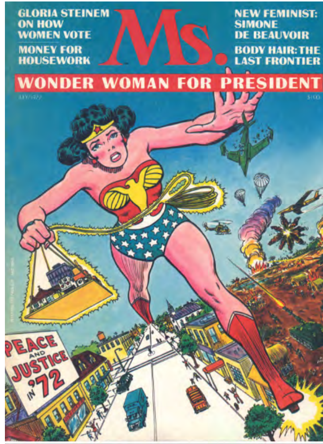
Görsel 10: Ms. Magazine kapağında Wonder Woman. 1972. (Psmag). https://www.kisa.link/MXvq .

Bu durum Wonder Woman'ın feminist yaratılış öyküsüne ters düşmektedir (Munder, 2017). Fakat o dönemde İkinci Dalga Feminizm hareketinin etkisiyle kadınların hak arayışına girmeleri, toplumda bastırılmaya çalışılan kadının güçlü bir şekilde tekrar topluma ka-zandırılmasını sağlamıştır. Bu doğrultuda Wonder Woman'da güçlerini toparlayarak Ms. Magazine kapak olmuştur (Görsel 10). Görsel 10'da görüldüğü üzere Wonder Woman'ın güçlü bir kadın al-gısı oluşturması için tüm şehri kaplayan gövdesiyle dev gibi resmedilmiştir. Araştırmada daha öncede incelenen görseller de düşünüldüğünde Wonder Woman'ın kostümü sadece bir mayodan ibarettir. Mayo da, herhangi bir pelerin ya da tayt bulunmamakta daha çok Amerikan bayrağını simgeleyen yıldız ve kartal figürü öne çıkmaktadır. Bu anlamda yaratımında ortaya atılan feminist söylemden uzaklaşarak tüm kadınların kurtarıcısı feminist bir karakter değil, dünyayı kurtaran seksi bir kadın süper kahramana dönüştüğü söylenebilir.