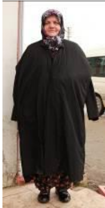
Resim 20. Feracenin giyim şekli.

Ferace; yün (Eriş) siyah ve karışık desenli kumaş, krem rengi, siyah, kırmızı, ip kullanılmıştır. Giysi boyu uzun, diz altında, sıfır yakalı, sıfır kapama, kare uzun takma kollu, yanları peşli ve kuşlu tasarlanmıştır. Giysi elde oyulgama ve çırpma dikişi tekniği kullanılarak dikilmiştir. Yakası desenli kumaş kullanılarak pervazla temizlenmiştir. Zincir işi ve elde makine dikişi tekniği kullanılarak ön ortasında beden hattı hizasında dikdörtgen süsleme yapılmıştır. Kol ağzı kırmızı, krem renkli, yaka ve ön ortası krem rengi iplikle zincir çekilerek hazırlanan kordon ile tutturularak süslenmiştir.