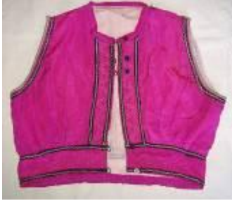
Resim 3. Yelek (a) Ön görünüm.

Pembe şalvar ile birlikte bürümcük gömlek üstüne giyilir ve gelinliğin (özel gün giysisi) üst parçası olarak urba ile birlikte veya ayrı olarak kullanılırdı. 72 yıllıktır (Kaynak Kişi: Şahin, 2012).