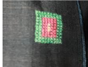
(b) Süsleme detay.

Feracede Yün (Eriş) siyah ve kırmızı kumaş, mavi, siyah, sarı, yeşil ip, mavi ince kordon kullanılmıştır. Giysi boyu uzun bileğe yakın, sıfır yakalı, kare uzun takma kolları, yanları peşli, koltuk altı kuşlu, kruvaze kapamalıdır. Makinede ve elde dikilmiştir. Yaka farklı kumaşla pervaz çalışılarak temizlenmiştir. Ön ortasında bel hizasında kare şeklinde kanaviçe işleme yapılmıştır. Kol ağzı kırmızı kumaş bant ile kol ucu, ön ortası ve yaka kenarı mavi renk iplikle zincir çekilerek hazırlanan kordon ile süslenmiştir.