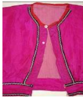
(b) Ön detay görünüm.