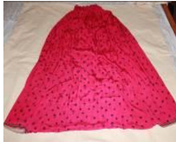
Resim 8. Urba donu-Şalvar.

Urba ve bürümcük iç göynek ile birlikte ve göynek etek uçları şalvarın içinde kalacak şekilde giyilirdi. Özel gün giysisi, gelinliğin alt parçası olarak kullanılırdı.