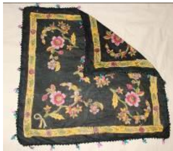
Resim 22. Çember.

Genç ve yaşlı bütün kadınların kullandığı başörtüsüdür. Genç kızlar başlarını pelik altı (başın arkasından, enseden), evli kadınlar gıdık altı (önden) bağlarlardı. 66 yıllıktır (Kaynak Kişi: Şahin, 2012).