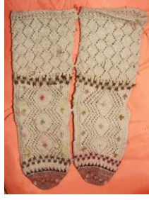
Resim 23. Desenli, Ajurlu kadın çorabı.

Yün iplik eğrilerek elde örme kadın çorabıdır (Selamlar Köyü Müzesi, 2012).