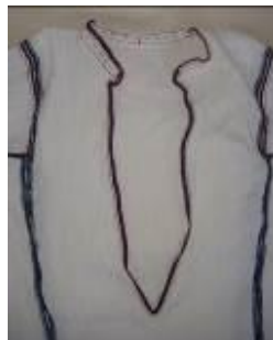
(b) Yaka yırtmaç detay.