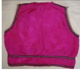
(b) Arka görünüm.