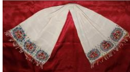
(b) Peşkir 65 yıllık.

Peşkirler, bezayağı pamuklu dokuma beyaz/krem kumaş kullanılarak dikdörtgen şeklinde yapılmış, iki kenarın da nakışlı ve püsküllü tasarlanmıştır.