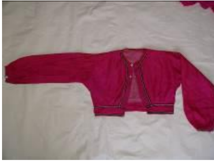
Resim 2. Urba (a) ön görünüm.

Pembe şalvar ile birlikte bürümcük iç göynek üstüne yelek ile birlikte veya ayrı olarak giyilen bir özel gün giysisidir. Gelinliğin üst parçası olarak kullanılırdı (Kaynak Kişi; Aydın, 2012).