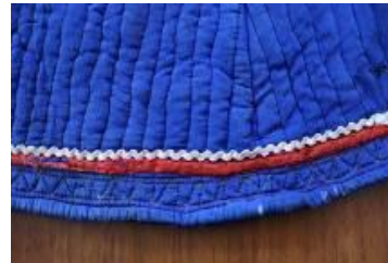
(b) Etek ucu görünümü.

Koyu mavi ipek kumaş (mariken), ara dolgusu olarak pamuk, astar olarak emprime desenli koyu pembe baskılı pamuklu kumaş, ön ortası iç kenarlarında lacivert desenli şerit kumaş, süslemesinde pembe ve kırmızı pamuklu kumaş, krem, kırmızı, lacivert iplik, beyaz sutaşı kullanılmıştır. Giysinin boyu; kalçanın altında, ön ve yanlar pensli, uzun takma kolları, sıfır yaka, sıfır kapama, arkası kuplu, yanı dikişsiz, ön arkaya kaydırılarak kup oluşturulmuş, applike cepli olarak tasarlanmıştır. Makinede dikilmiştir. Emprime desenli (baskılı) koyu pembe pamuklu kumaş makinede dikildikten sonra,