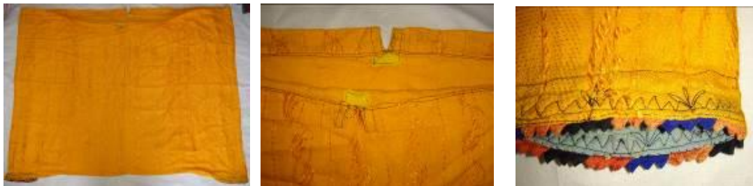
Resim 6. Şalvar (a) Ön görünümü. (b) Uçkurluk görünümü. (c) Paça detay görünümü.

Urba ve bürümcük iç göynek ile birlikte ve göynek etek uçları şalvarın içinde kalacak şekilde giyilirdi. Özel gün giysisi, gelinliğin alt parçası olarak kullanılırdı. 68 yıllıktır (Kaynak Kişi: Aydın, 2012).