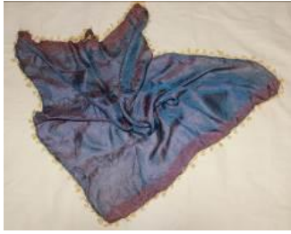
Resim 21. (a) Mor grep.

Genç kızlar başlarını grep ile pelik altı şeklinde (başın arkasından, enseden) bağlayarak kullanırlardı. 68 yıllıktır (Kaynak Kişi: Şahin, 2012).