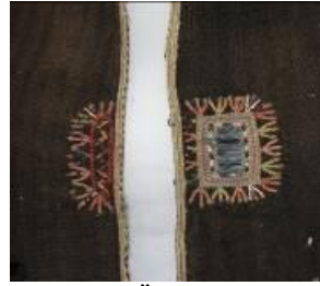
Resim 18. Ferace (a) Kol ucu süsleme detay görünümü. (b) Ön süsleme detay görünümü.