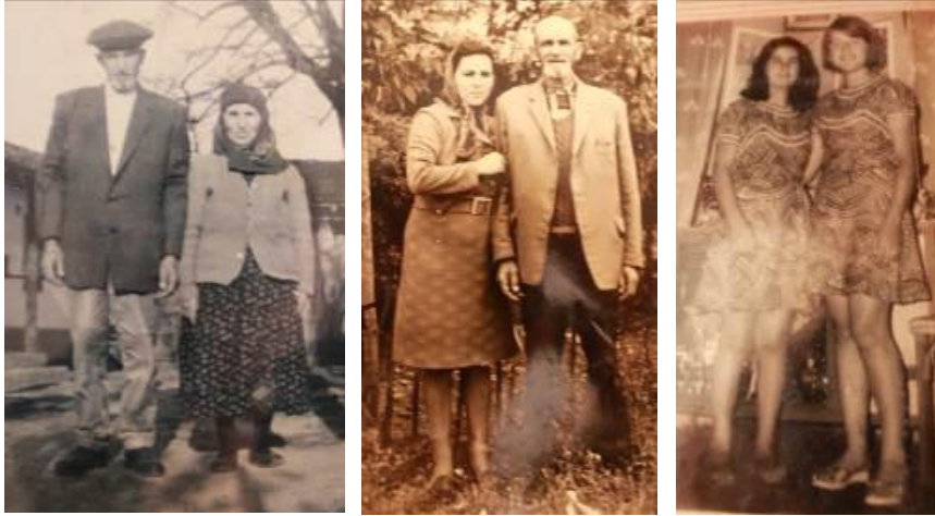
Resim 29. Eski fotoğraflar (Kadın ve erkek kıyafetleri-1970).

Heybeler; Kilim deseni verilerek el tezgahında dokunmuşlardır. İki heybede de kare, dikdörtgen (geometrik)desenler ön plandadır. Heybelerin askılıkları yün ipliklerden bükülerek hazırlanmış olup kenarları battaniye iğnesi tekniği ile yine yün iplikle birleştirilmiştir. Koca ve Komanlar (2019) çalışmalarındaki heybelerin aksine bu heybelerde, şu taşı kullanılmamıştır. Süslemesinde sadece kilim desenleri ön plana çıkmaktadır. Ve kenarlarında saçak bulunmamaktadır. Bunların dışında diğer özellikleri benzerlik göstermektedir (Koca-Komanlar 2019: 937).