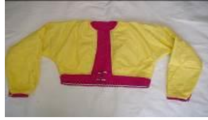
Urba (b) Astar görünümü.

Kumaş olarak pembe Mariken (ipek), astar olarak sarı pamuklu kumaş, siyah kurdele, sim sutaşı, siyah düğme kullanılmıştır. Boyu göğüs altında, sıfır yakalı, uzun oyuntusuz takma kolları, sıfır kapama, kemerli, kol ucu ve yaka kenarı biye ile temizlenmiş, kol ucu yırtmaçlı, göğüs altından pilili, beş adet birit ilik ve düğmeli, astarı ise; kuşlu japone kollu çalışılmıştır. Sarı pamuklu kumaş kullanılarak, astar makinede dikilerek, elde bedene tutturulmuştur. Urbanın süslemesinde; siyah kurdele üstüne sim sutaşı sabitlendikten sonra giysiye (makinede) dikilmiştir ve ön ortasına, kemere (makine dikişi ile) su şeklinde üçgen kapitone dikişi yapılmıştır.