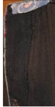
Resim 98. Ferace (a) Yan peş kol altı detay görünümü. (b) İç yaka pervaz detay görünümü.

Ferace; yün (Eriş) siyah ve karışık desenli kumaş, krem rengi, siyah, kırmızı, ip kullanılmıştır. Giysi boyu uzun, diz altında, sıfır yakalı, sıfır kapama, kare uzun takma kollu, yanları peşli ve kuşlu tasarlanmıştır. Giysi elde oyulgama ve çırpma dikişi tekniği kullanılarak dikilmiştir. Yakası desenli kumaş kullanılarak pervazla temizlenmiştir. Zincir işi ve elde makine dikişi tekniği kullanılarak ön ortasında beden hattı hizasında dikdörtgen süsleme yapılmıştır. Kol ağzı kırmızı, krem renkli, yaka ve ön ortası krem rengi iplikle zincir çekilerek hazırlanan kordon ile tutturularak süslenmiştir.