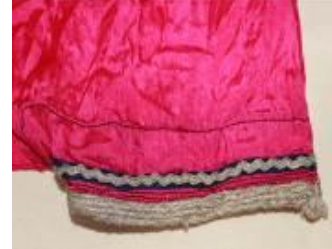
Resim 7. Şalvar (a) Ön görünümü. (b) Uçkurluk görünümü. (c) Paça detay görünümü.

Pembe Mariken (ipek), süslemesinde siyah kumaş şerit, balıksırtı ve sutaşı harç, dikiminde siyah dikiş ipliği kullanılmıştır. Boyu ayak bileğinde, beli uçkurlu, bol kesim, hafif ağ oyuntulu, uçkurluk ön ve arka ortası yırtmaçlı çalışılmıştır. Kumaş eni (ön-arka ve yanlar) olarak dört en kullanılmıştır. Makinede dikilmiştir. Siyah şerit kumaşların üzerine sutaşı yerleştirilerek dikilmiş ve paçaların uç kısmına balıksırtı harçlar tutturularak süslenmiştir.