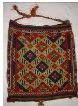
(b) Heybe- çanta 80 yıllıktır.