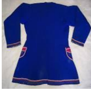
(b) Arka görünümü.