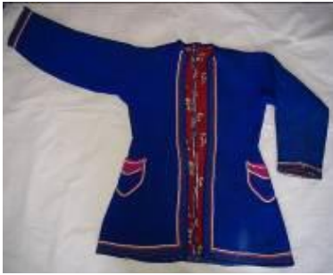
Resim 10. Gocuk (a) Ön görünümü.

Gezmeye giderken üst giysisi olarak kullanılırdı. 66 yıllıktır (Kaynak Kişi: Cebeci, 2012).