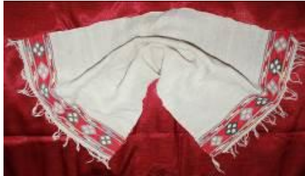
Resim 27. (a) Peşkir.

Gelinin yüzü, renkli pullar kullanılarak, çeşitli desenlerle süslenirdi. Yapıştırıcı olarak yumurtanın beyazı kullanılırdı. Gelinin duvağına uzun parlak teller takılırdı (Kaynak Kişi: Albayrak, 2012). Osmanlı gelin başı süslemelerinde; gelin teli denilen ince, uzun gümüş telin başlığa tutturulduğu üzerine ise kırmızı duvak örtüldüğü bilinmektedir (Aktepe-Erol 2019:340). Osmanlı'nın bir parçası olan Bulgar göçmenlerinde de gelin başı süslemede gelin teli adı verilen, uzun parlak tellerin kullanıldığı saptanmıştır.