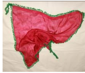
(b) Kırmızı grep.

Mor ve kırmızı ipek kumaş, sarı, yeşil kuka iplik ve pul kullanılmıştır. Kare hazırlanan mor grep; kenarları sarı renk ip ile mekik oyali, kare hazırlanan kırmızı grep; yeşil renkli ip ile pullu tığ oyası ile süslenmiştir. Abanoz ve diğerlerinin araştırmasında Düzce ili Yeni Taşköprü köyünde sarı ve bordo ipek kumaştan, kare, mavi, kırmızı, krem ve sarı kuka iplikle, yelpaze ve badem deseninde iğne oyali iki grep incelenmiştir. Greplerin ortak özelliği ipek kumaş kullanılması, parlak ve canlı renklerinin olmasıdır.