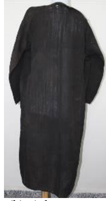
Resim 17. Ferace (a) Ön görünümü. (b) Arka görünümü.