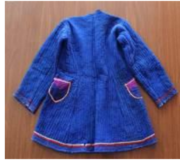
(b) Arka görünümü.