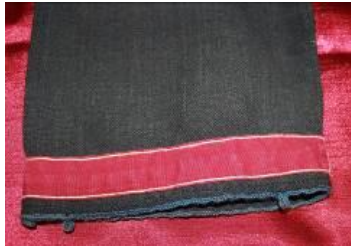
Resim 16. Ferace (a) Kol ucu detay.