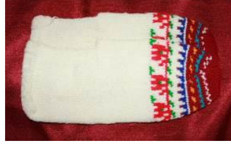
Resim 24. Elde örülmüş çetik

Çorapta krem renkli yün iplik, süslemesinde kırmızı, mavi, yeşil, kahverengi, siyah, pembe renkli iplikler kullanılmıştır. Kısa konçlu, elde beş şiş ile örülmüştür. Renkli iplikler kullanılarak desen oluşturulmuş ve ajur ile süslenmiştir. Çetik ise yine elde beş şiş ile örülmüş, burun kısmında sekiz farklı renk kullanılarak desen verilmiştir.