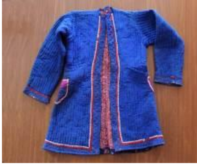
Resim 12. Gocuk (a) Ön görünümü.

Gezmeye giderken üst giysisi olarak kullanılırdı. 87 yıllıktır (Kaynak Kişi: Albayrak, 2012).