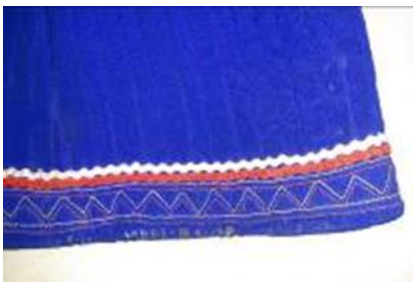
Resim 11. Gocuk (a) Süsleme detay görünümü.