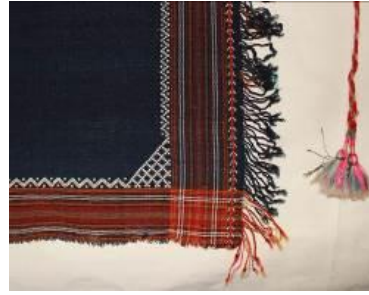
(b) Süsleme detayı görünümü.

Bezayağı dokuma olarak yünden, çufallık adı verilen el tezgâhında dokunmuştur. Lacivert, turuncu, krem, bordo, yeşil renkler kullanılmıştır. Dar dokuma olduğu için iki parçadan dikdörtgen oluşturularak tasarlanmıştır. İki parça birbirine elde sarma ve ajur ile tutturulmuştur. Elde renkli iplerle saç örgüsü yapılarak uçkur, bağcık çalışılmış ve ucuna püskül yapılmıştır. Futanın iki kenarından ipler çekilerek oluşturulan püskül ile süslenmiştir.