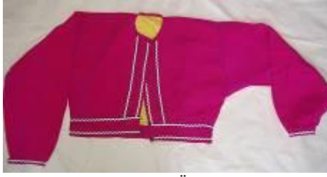
Resim 1. Urba (a) Önden görünüm.