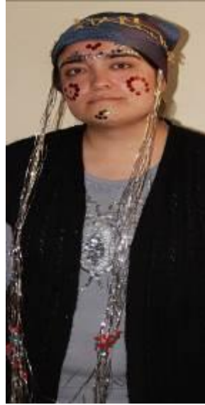
Resim 26. Muhacirlerde gelin yüzünün süslenmesi.

Gelinin yüzü, renkli pullar kullanılarak, çeşitli desenlerle süslenirdi. Yapıştırıcı olarak yumurtanın beyazı kullanılırdı. Gelinin duvağına uzun parlak teller takılırdı (Kaynak Kişi: Albayrak, 2012). Osmanlı gelin başı süslemelerinde; gelin teli denilen ince, uzun gümüş telin başlığa tutturulduğu üzerine ise kırmızı duvak örtüldüğü bilinmektedir (Aktepe-Erol 2019:340). Osmanlı'nın bir parçası olan Bulgar göçmenlerinde de gelin başı süslemede gelin teli adı verilen, uzun parlak tellerin kullanıldığı saptanmıştır.