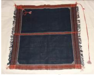
Resim 9. Futa (a) Ön görünümü.

Evli kadınlar dış giysi üzerine gündelik ve aynı zamanda gezmeye giderken de takarlardı. 88 yıllıktır (Kaynak Kişi: Aydın, 2012).