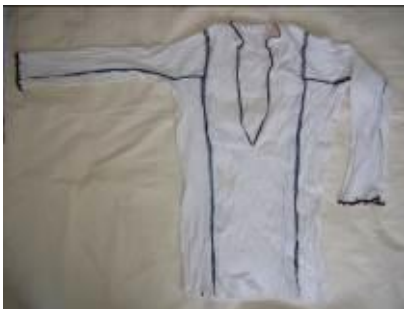
Resim 4. İç göynek (a) Ön görünüm.

Yeleğin altına ve şalvarın üstüne giyilir, iç giysisi olarak kullanılırdı. Bürümcük ve buruşuk isimleriyle de anılmaktadır. 78 yıllıktır (Kaynak Kişi: Aydın, 2012).