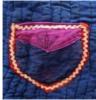
(b) Cep görünümü.