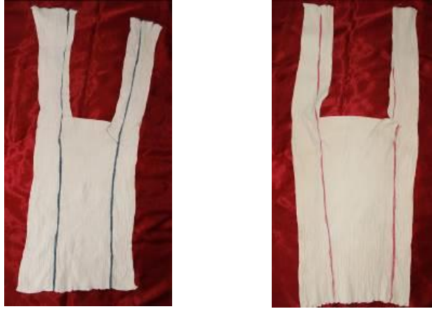
Resim 5. Yaka oyuntusu açılmamış (kullanılmamış) iç göynek ön ve arka görünümü.

Abanoz ve diğerlerinin (2013) çalışmasındaki iç göynek ile aynı özellikleri göstermektedir (Abanoz, vd. 2013: 80-81).