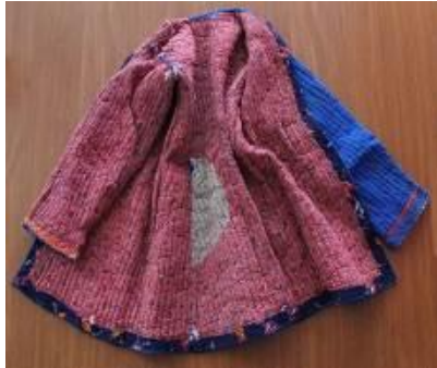
Resim 13. Gocuk (a) Astar görünümü.