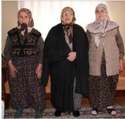
Resim 30. Yaşlı kadınların giydiği günümüz kıyafetleri

Resimde görüldüğü üzere urba donu (şalvar), çember (başörtüsü) ve ferace kullanımı hala Düzce ili Gümüşova ilçesi Selamlar köyünde devam etmektedir.