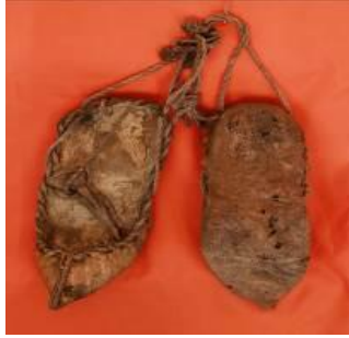
Resim 25. Deriden yapılmış çarık (Selamlar Köyü Müzesi, 2012).

Bulgar göçmeni kadınların ayaklarına elde yünden örülmüş çorap ve çetik giydikleri, her ikisinin de burun, topuk ve bilek kısımlarında değişik motiflerle süsleme yaparak ördükleri tespit edilmiştir (Koca-Komanlar 2019: 938).