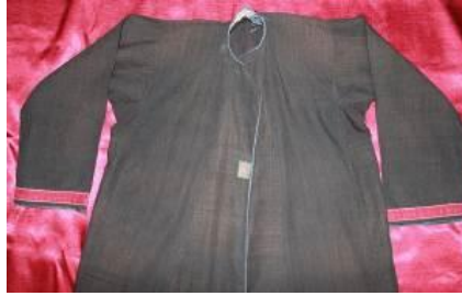
Resim 15. Ferace Ön görünümü.

Dış giysisi olarak (manto- pardösüsü gibi) giyilirdi. 98 yıllıktır (Kaynak Kişi: Şahin, 2012). Düzce ili Hasanağa köyünde de dış giysi olarak tüm kadınlar tarafından sokağa çıkarken kullanılmıştır. Günümüzde hala üst giysisi olarak giyilmekle birlikte kara çarşaf olarak isimlendirilmektedir (Abanoz, vd. 2016: 204-205).