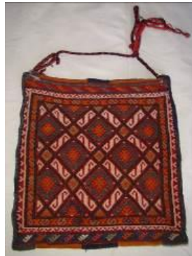
Resim 28. (a) Heybe- çanta.

Peşkirler, bezayağı pamuklu dokuma beyaz/krem kumaş kullanılarak dikdörtgen şeklinde yapılmış, iki kenarın da nakışlı ve püsküllü tasarlanmıştır.