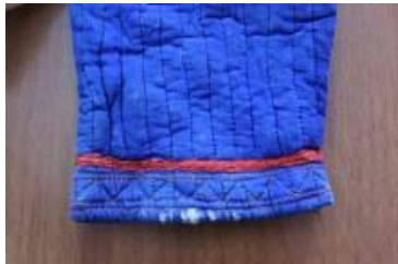
Resim 14. Gocuk (a) Kol ucu detay görünümü.