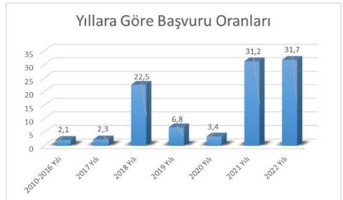
Şekil-1. Uluslararası Sağlık Turizmi Birimine Başvuruların Yıllara Göre Dağılımı

Çalışmaya, 1 Ocak 2010-31 Aralık 2022 tarihleri arasında uluslararası sağlık turizmi biriminde açılan 895 dosya dâhil edildi. Yıllara göre değerlendirildiğinde en fazla başvurunun %31,7 ile (n=284) 2022 yılında olduğu saptandı (Şekil 1). Aylara göre değerlendirildiğinde ise en fazla başvuru %14,3 ile (n=128) Ağustos ayı, %13,9 ile (n=124) Temmuz ayı idi (Şekil 2).