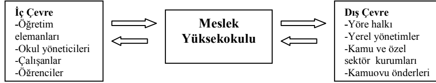
Tablo: 1 Meslek Yüksekokullarının Toplumsal Çevresi

Yerel yönetimler, kamu kurumları, sanayi ve ticari kuruluşlar, sivil toplum örgütleri, kamuoyu önderleri ve yöre halkını meslek yüksekokulunun dış toplumsal çevresi olarak ifade edebiliriz. Meslek yüksekokulunun iç çevresi ise, öğretim elemanları, okul yöneticileri ve çalışanları, öğrenciler ve velilerden oluşmaktadır. Meslek yüksekokulunun toplumsal çevresi aşağıdaki tabloda görülmektedir.