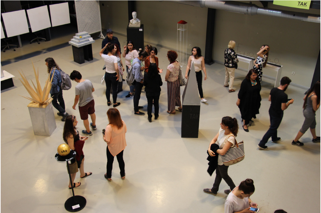
Resim 1. Çalışma Grubu Öğrencilerinin “Fikirtepe/Kamusal Alanda Heykel” Sergisinden Kesit, 13.06.2017, Kadıköy Tasarım Atölyesi, İstanbul.

10 Kişiden oluşan çalışma grubun öğrencisinden 9’u “Fikirtepe (Kamusal Alanda Heykel)” projesinin sonunda üç boyutlu heykellerini hayata geçirebilmiştir. Workshop projesi için üretilen bu heykeller “Fikirtepe/Kamusal Alanda Heykel” adıyla Kadıköy Tasarım Atölyesi’nde 13.06.2017 ile 20.06.2017 tarihleri arasında sergilemiştir.