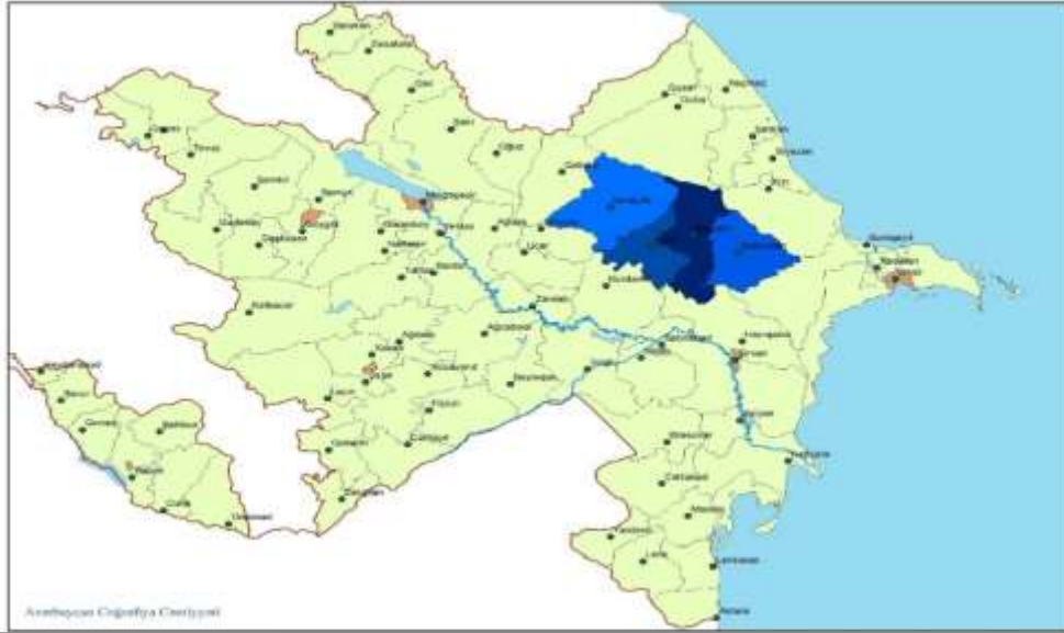
Harita 1: Dađlık Şirvan ekonomik-coğrafi bölgəsi

ve teknolojinin geliştiđi alanlar yerleşmenin fazlaşmasını sağlamaktadır. İnsanlar bilim sayesinde hem daha güzel imkanlar ve hayatlar sürmekte hem de teknoloji sayesinde insanlar iletişim araçlarından ve teknolojik eşyalardan faydalanmaktadır. Nüfusun yoğun olduđu yerlerde genellikle ulaşım, ticaret, sanayi ve tarım gelişmiştir. Nüfusun seyrek olduđu yerler ise engebeli ve dađlık alanlardır. Aynı zamanda bu alanlar, ulaşım, ticaret, sanayi ve tarımın gelişmediđi yerlerdir (Tablo 1).