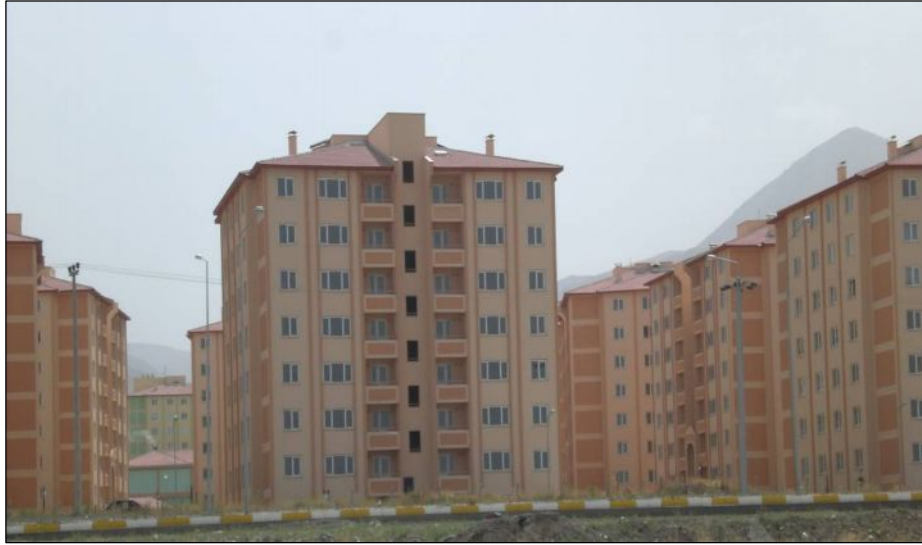
Foto 5. TOKİ Yıldızkent 2. Bölge Kentsel Dönüşüm Konutlarından Bir Görünüm

mahallelerinde 1000 civarında gecekondu yıkılmıştır. Gecekonducularda yaşayan halktan isteyenlere enkaz bedeli ödenmiş, isteyenlere ise mülkiyeti Yakutiye Belediyesine ait olan Yıldızkent semtinde bulunan arsalar üzerine inşa edilen modern konutlar verilmiştir. TOKİ desteğiyle belediye tarafından 6 ay gibi kısa sürede tamamlanan 340 konuttan oluşan bu proje, Türkiye’de belediye ve TOKİ işbirliğiyle yapılan ilk kentsel dönüşüm uygulaması olarak geniş yankı bulmuş ve birçok belediyeye de örnek olmuştur. Hasan-ı Basri ve Mehdi Efendi mahallelerinde yıkılan gecekonducuların arsaları toplu konut yapımı için TOKİ’ye tahsis edilmiş, tahsis edilen arsalar üzerinde 512 konuttan oluşan yeni bir semt kurulmuştur (Yakutiye Belediyesi, 2004; Kocaman, T., 2004).