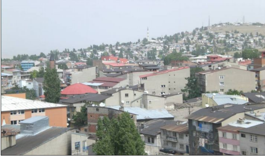
Foto 1. Dağ Mahallesinden Bir Görünüm

gecekondu mahallesinin kuzeyeye doğru hızlı bir yayılış göstermesine neden olmuştur. Kuzeyde görülen yayılışa karşı ise yine benzer parselasyon çalışmaları yapılarak II Nolu Gecekondu Önleme Bölgesi oluşturulmuştur. Bu bölge ise kısa bir zaman sonra Gaziler Mahallesi adını almıştır.