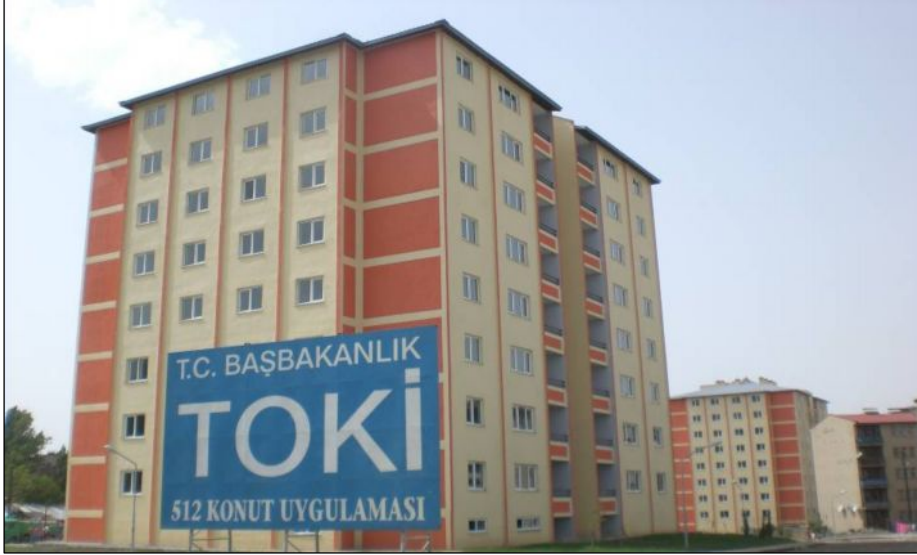
Foto 5. TOKİ Yakutiye (Rabia Hatun ve Habip Efendi Mahalleleri) Kentsel Dönüşüm Konutlarından Bir Görünüm

yeralan hayvan pazarının yerinin değiştirilmesi kapsamında burada bulunan 8 kaçak konutu yıkmıştır (Erzurum Büyükşehir Belediyesi, 2007).Yine bu yıl içinde TOKİ, Yıldızkent Kentsel Dönüşüm Projesi Konutları adı altında Çat yolu üzerinde toplam 700 konutun (1. Bölge: 280 ve 2. Bölge: 420) inşasına başlamıştır (TOKİ, 2008). Bu yıl itibariyle yapımı tamamlanan konutlar kentte yer alan gecekonu sayısının azaltılmasında doğrudan etkisi bulunmamasına karşın kentteki konut açığını giderme, düşük ve orta gelirli aile grubuna yönelik ucuz konut sunma ve kentteki konut piyasasını dengeleme adına önem arz etmektedir.