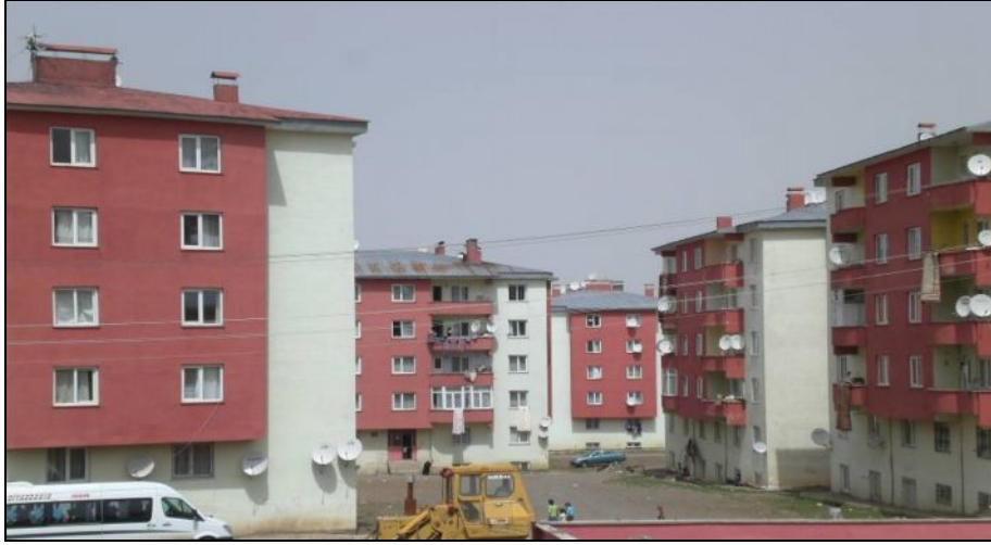
Foto 4. Yakutiye Belediyesi, Yıldızkent Kentsel Dönüşüm Konutlarından Bir Görünüm

Ayrıca Kayakyolu üzerinde yer alan tuğla ocağı olarak işletilen ve aynı zamanda gecekondular vasfı kazanan 18 gecekondular yıkılmıştır. Buralarda yaşayan halkın mağdur olmaması için Yunus Emre Semtinin Palandöken Dağı eteklerine doğru olan kuzey kısımlarında mülkiyeti belediyeye ait olan arsalar gecekondular sahiplerine tahsis edilerek Küme Evler (Palandöken) Mahallesi kurulmuştur (Erzurum Büyükşehir Belediyesi, 2004a).