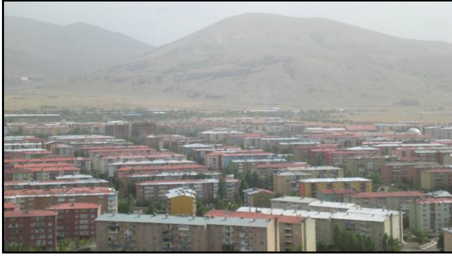
Foto 2. Yenişehir’den Bir Görünüm

Bölge, İmar ve İskân Bakanlığının desteği ile halk, belediye ve diğer kurumlarla işbirliği sonunda kısa sürede tamamlanmıştır. III nolu gecekondular önleme bölgesinin kuruluşuyla kentin çehresi değişmiş, kente yeni ve güzel bir görünüm kazandırılmıştır. Daha sonra III nolu gecekondular önleme bölgesinin ismi “Yenişehir” diye anılmaya başlanmıştır.