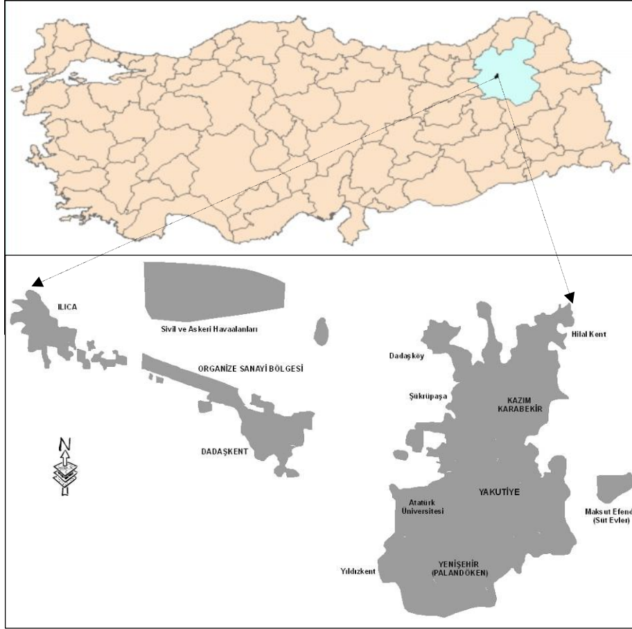
Harita 1. Erzurum Kentinin Lokasyon Haritası Map 1. The Location Map of Erzurum City

Çağlayan, Aşağı Sanayi, Kurt Deresi, Yukarı Sanayi ile Kavak... Mahaleleri vb.) yükselti 1730-1800 m dolaylarındadır (Doğanay, 1983; Kocaman, 2005).