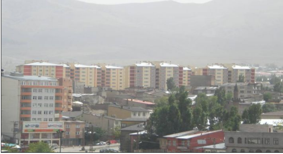
Foto 6. TOKİ Yakutiye (Mehdi Efendi Mahallesi) Kentsel Dönüşüm Konutlarından Bir Görünüm

kaynaklanan kentteki çirkin görüntünün ortadan kaldırılmasının yanında kentteki konut ihtiyacının karşılanacağı önemli bir projedir. Bunun yanında Büyükşehir Belediyesi ile Palandöken Belediyesi, Eski Hayvan Pazarı ve Harput Mahallelerinde bulunan gecekonduları ve mandraları kaldırarak buralarda TOKİ ile ortaklaşa modern konutlar kurup, 2009 yılında bu bölgelerde kentsel dönüşüm proje uygulaması başlatmayı planlamaktadır (Erzurum Büyükşehir Belediyesi, 2007).