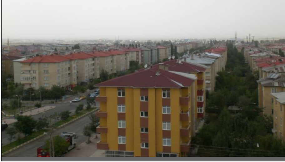
Foto 3. Dadaşkent'ten Bir Görünüm

oluşturulmuştur. Yapılaşmanın hızla devam ettiği Dadaşkent 2004 yılında ise 5216 yasayla ilk kademe belde kimliğine kavuşmuştur. Dadaşkent sınırlarına 5 köy dâhil edilmiştir. 22.03.2008 tarihinde yürürlüğe giren 5747 sayılı Büyükşehir Belediyeleri sınırlarını düzenleyen kanun ile ilk kademe belediyelerinin kapatılması kapsamında 2009 yerel seçimleri ardından Ilıca ilçesiyle birleşerek Aziziye Merkez ilçesini oluşturacaktır (Resmi Gazete, 2008).