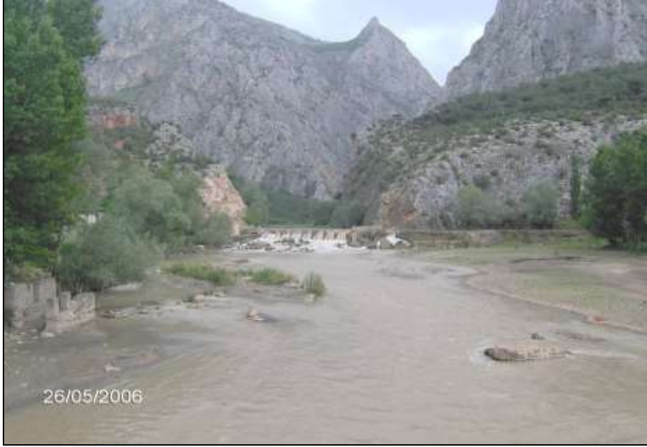
Foto -4 İncesu Yarmavadisi'nin çıkışında görülen etek düzlüğü. Güneye bakış.

bu vadilerin aralarındaki sırtlar üzerinde “kıran” veya “omuz düzlükleri” şeklinde kalmışlardır (Foto-6). İlk oluşumlarında bile, vadi içerisine doğru eğimli olan bu sekilerin, alüvyal dolgularının olmaması, zaman içinde akarsuyun vadinin bir yamacını daha çok aşındırması veya dikey yöndeki tektonik hareketlere bağlı olarak vadinin her iki yamacında da aynı yükseklikte takip edilememelerine sebep olmuştur. Ayrıca, 110-200 m ler arasında çeşitli seviyelerdeki sekiler vadinin farklı kesimlerinde dikkati çeker. Ancak, farklı seviyelerdeki bu sekilerin aynı seviyeye mi yoksa farklı sekilere mi ait olduklarını ayırmak şimdilik mümkün olmamıştır.