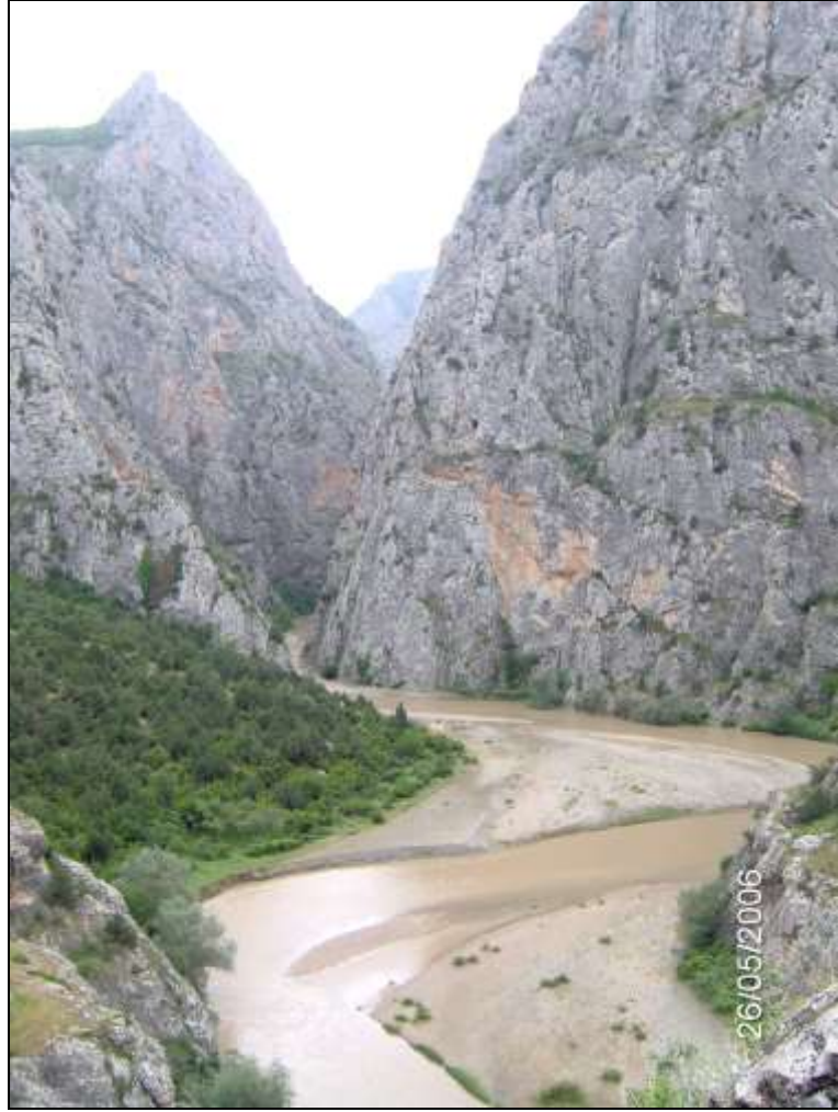
Foto-2 İncesu yarmavadisi, tabansız ve derin yarılmış bir boğaz görünümündedir.

birikinti konilerini saymak gerekir. Bu kesimlerde ana akarsu genellikle karşı yamaç dibine sıkıştırılmış bir biçimde akmaktadır.