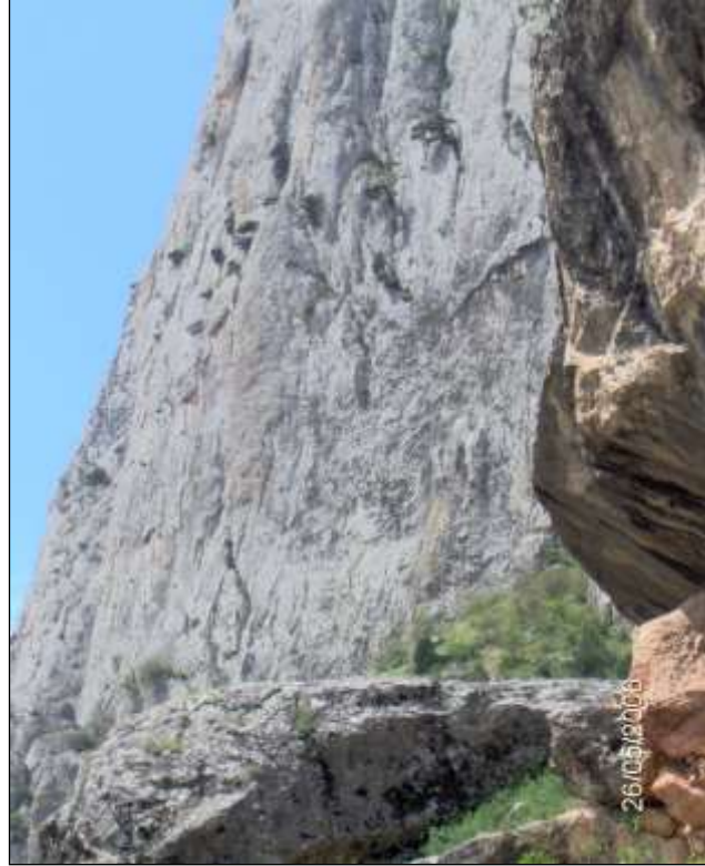
Foto -6 Boğazın orta kısmında kuzeydoğu-güneybatı istikametinde uzanan bu dikliğin bir fay yüzeyine karşılık geldiği görülmektedir.

Yine, yarmavadinin orta ve çıkış kısmında kalkerler 350-400 m yi aşan dik bir yamaçla birden azami yüksekliklerine ulaşmaktadırlar (Foto-7).