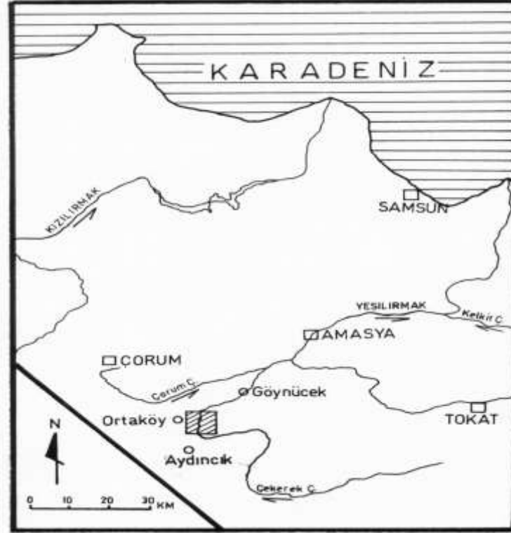
Şekil-1 İnceleme Sahasının Lokasyon Haritası.

mümkün olmaktadır. Bunlar arasında, vadinin enine profilinde dikkati çeken asimetrikler ile farklı seviyelerde omuz ve seki düzlükleri önem taşır.