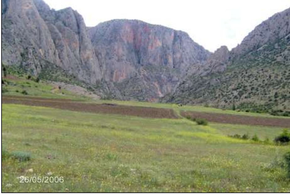
Foto -1, Kazankaya köyü kuzeyinde İncesu Yarmavadisi'nin giriş kısmı. Önde vadi tabanından 40 m yükseklikteki taraça görülmektedir. Kuzeye bakış.

İncesu yarmavadisinin tamamı Jura-Kretase dönemine ait kalker yapı içerisinde açılmıştır. İncesu-Kazankaya köyleri arasındaki kalker kütlesinde bu büyük ölçülü yarıma sonucunda meydana gelen vadinin yamaçları çok yerde büyük diklik gösterir. Bu durum gerek resimlerden gerekse topoğrafik haritadan da kolaylıkla anlaşılır. Yamaçların bu derece dik olarak oluşumunda gömülmelerin şiddeti yanında kalkerlerin petrografik özellikleri de önemli rol oynamışlardır. Gömülmelerin süratli oluşu, akarsuyun bükümlerinin gömülmesi sırasında herhangi bir kaymaya maruz kalmadan, kalkerler içine olduğu gibi yerleşmiş bulunmasından anlaşılmaktadır. Ancak, yarmavadinin üzerinde olduğu kalker kütle çok çatlaklı bir yapıya sahiptir. Boğaz içerisinde bu çatlaklar boyunca kalkerlerin aşındırılması kolaylaşmış ve bu çatlakların istikametine uygun olarak yamaçlar büyük diklik kazanmıştır (Foto-3). Bundan sonra da yamaçların gerilemesi bu çatlaklar boyunca olacaktır.