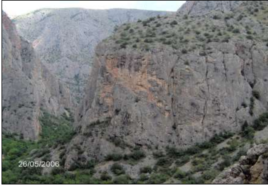
Foto-5 Boğaz içerisindeki farklı seviyelerde sekiler oluşmuştur. Çok düzenli takip edilemeyen busekilerden birçoğu parçalanmış durumdadır. Fotoğrafta yaklaşık 180 m yükseklikte takip edilebilen seki görülmektedir. Kuzeydoğuya bakış.

çökmesi ve buna bağlı olarak kuzeydeki kesimin daha fazla çökmesi sonucu sahanın genel eğiminin de kuzeye doğru değiştiği anlaşılmaktadır (Zeybek-1998:76). Böylelikle, bu zamana kadar, Amasya çevresindeki Miyosen gölüne sularını boşaltan Çekerek Irmağı ve Tokat Irmağı, Amasya güneyinde birleşerek yeni eğim şartlarına uygun olarak, sularını Taşova-Erbaa depresyonuna boşaltmaya başlamışlardır. Yani, yeni tektonik hareketlerle oluşan, yeni eğim şartlarına bağlı olarak bugünkü akarsu şebekesi ana hatlarıyla Pliyosen'de kurulmuş olmalıdır (Zeybek-1998:76). Böylece, saha bütünüyle kara durumuna geçmiş ve yeni şartlara göre kurulan Çekerek Irmağı, bu az eğimli yüzey üzerinde menderesler çizerek kuzeye doğru akmaya başlamıştır.