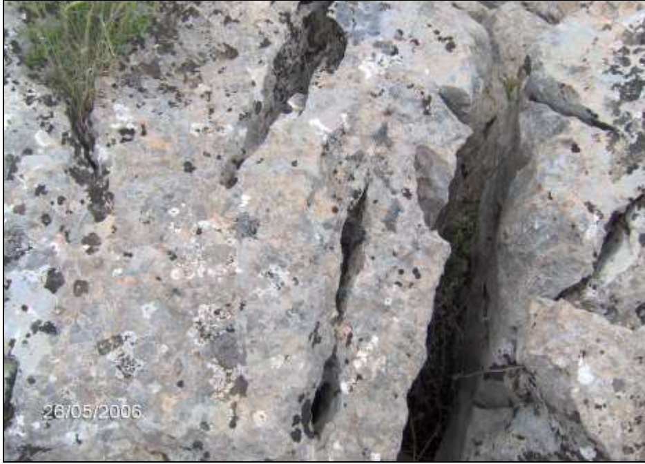
Foto-4 Boğaz içerisinde görülen karstik şekillerden en yaygını olan oluklu lapyalar.

köyü güneyinde oluşan etek düzlükleridir (Foto-5). Bu şekiller, günümüz morfordinamiğinin etkisi altında meydana gelirler. Nitekim, yazın şiddetli sağanaklar sonrası yüzeyi kaplayan sel suları etkin bir denüdayona sebep olmakta ve çoğu yerde de anakayayı bütünüyle açığa çıkarmış bulunmaktadır. Bununla birlikte, yukarıdan taşınan malzemenin bir kısmının da biriktiği etek yüzeylerinin aşağı kesimlerinde, çok taşlı olmalarına rağmen, tarımsal etkinliklerin yürütülmeye çalışıldığı gözlemlenir.