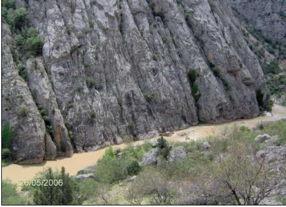
Foto-3 Yarmavadinin üzerinde olduğu kalker kütle çok çatlaklı bir yapıya sahiptir. Bu çatlaklar boyunca kalkerlerin aşındırılması kolaylaşmış ve bu çatlakların istikametine uygun olarak yamaçların eğimi artmıştır.

sahalarda daha yatık olan yamaçların üzerlerindeki kornişler dikkat çekicidir.