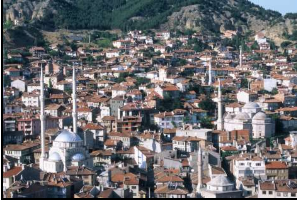
Foto 5. Tosya Őehrinden Genel Bir GörüntüŐ. Photo 5. A General View of Tosya City

Kuruçay'ın vadisi içerisinde yaklaşık 870 metre yükseklikte bulunan Tosya Őehri, Kuruçay'ın vadisi boyunca her iki yamaç üzerinde yükselerek uzanmaktadır. Őehrin merkezi eski Çankırı yolunun bir devamı olan Atatürk Caddesi'nin Kuruçay vadisine ulaştığı kesimde bulunan meydanın etrafıdır. Hükümet ve belediye gibi yönetim merkezleri bu meydanın çevresinde bulunmaktadır.