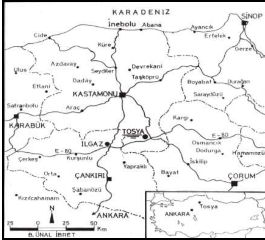
Şekil 1. Tosya Şehri'nin Lokasyon Haritası.