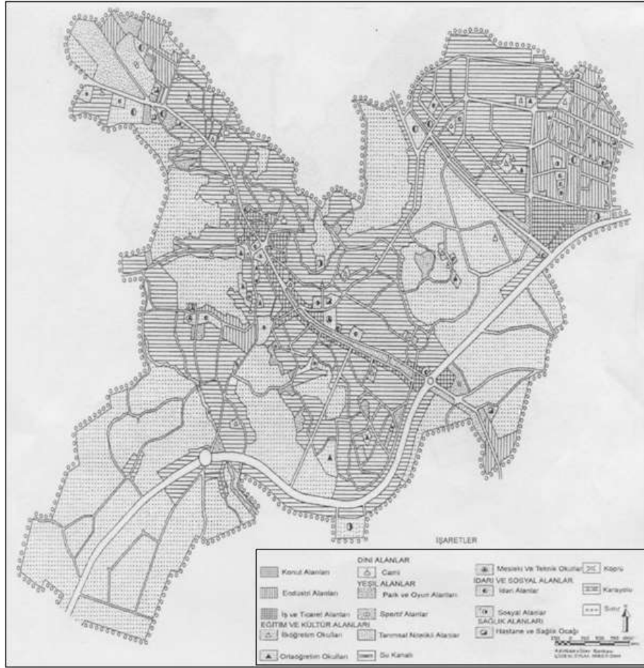
Şekil 3. Tosya Şehrinde Fonksiyon Alanlarının Dağılışı Haritası Figure 3. The Functional Field Distribution Map of the Tosya City

edilmiş ve şehir bu merkezi yapıların etrafında yayılmıştır. Şehrin tarihi dokusunun dışında kalan güneydoğu kesimlerinin imar planı çağımızın modern şehircilik anlayışına uygun bir şekilde çizilmiştir. Bu sebeple şehrin yeni imara açılan güneydoğu kesimlerinde geniş caddeler, parklar ve yeşil alanlar bulunmaktadır.