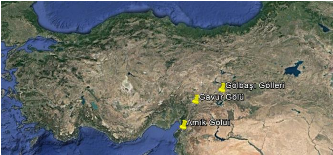
Şekil 1. Amik Gölü, Gavur Gölü ve Gölbaşı Gölleri sulak alanı

Amik Gölü, Antakya-Kahramanmaraş grabeninin en güneyini oluşturan Amik Ovası'nın tabanında bulunmaktadır. Ova deniz seviyesinden ortalama 83 m yükseklikte yer almaktadır. Ovanın toplam alanı yaklaşık 65000 ha' dır. Kuaterner yaşlı alüvyal dolgudan oluşan Amik Gölü çevresinde geniş serpantinlerde geniş yer kaplamaktadır (Küçük, 2002). Gavur Gölü, Antakya-Kahramanmaraş grabeninde ve deniz seviyesinden ortalama 478 m yükseklikte yer almaktadır. Bu sulak alan, güneyindeki Sağlık Ovası'nın en çukur alanında bulunmaktadır. Doğal durumunda kapladığı alan 7125 ha'dır. Pre Alpin, Alpin ve Post Alpin formasyon şeklinde gruplandırılan Gavur Gölü havzının temeli metamorfik ve metamorfik olmayan çeşitli kuvarsit, kumtaşı, silttaşı ve şeyller oluşurmakta ve alanda serpanitler ile birlikte diğer ultrabazikler yaygın olarak bulunmaktadır (Gürbüz ve ark., 2003). Gölbaşı Gölleri Doğu Anadolu Fay Zonu içerisinde Gölbaşı Depresyonunda yer almakta, Kuzeydoğu ve Güneybatı yönündeki çöküntü hendeğinin deniz seviyesine göre ortalama yükseltisi 885 m'dir. Toplam 1687 hektarlık bir alanı kaplamaktadır. Karstik-tektonik kökenli olan Gölbaşı Gölü, kuzeydoğu-güneybatı istikametinde bir çöküntü hendeği içinde yer almakta olup, Doğu Anadolu Fay Zonu üzerindedir (Akdemir, 2004). Toprak örnekleri Amik, Gavur ve Gölbaşı Gölleri'nin göl aynasından enine kesit olarak açılan toprak profillerinden horizon esasına göre alınmış ve GPS yardımı ile koordinatları belirlenmiş, Şekil 1'de araştırma alanları verilmiştir.