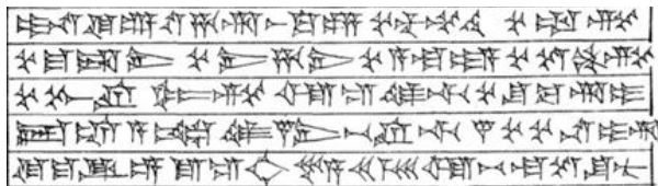
Resim 2. Alzi ve komşuları I. Tukulti-Ninurtanın metninde (Schroeder 1922, № 61)

Asur çivi metinlerinde Alzi ülkesi ile ilk defa I. Tukulti-Ninurtanın zamanında (M.Ö. 1244-1208) karşılaşıyoruz. Şu metinlerden anlaşılmaktadır ki, Alzi krallığı Mutmuhi, Madani, Nihani, Alaya, Tepurzi, Purulumzi gibi Subaru (=Hurri) gurupu ülkelerin komşuluğunda yerleşiyordu (bkz. Resim 2). I. Tukulti-Ninurta Alzi kralı Ehli-Teşubun 4 kale-kentini, saray muhafızları ve oğulları ile birge devirmiştir. 2