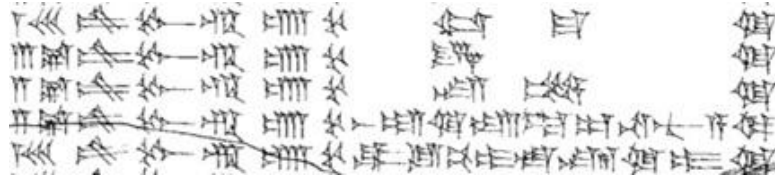
Resim 1. (Schroeder 1920, s.68, № 92).

Doğu Anadolu'nun eski siyasi merkezlerinden olan Elazığ elverişli coğrafi konumu nedeniyle, M.Ö. XIII. yüzyıldan beri, Asur krallarının yürüşlerinin hedefine dönüşmüştür. Elazığ'dan ve Tur-Abdin'den (eski adı Kaşiyari) Fırat'a ve Anadolu'nun merkezine stratejik güzergahlar geçiyordu. M.Ö. I. binyılda, Akkad kralı Sarrumken'in (I Sargon) devletinin sınırlarını gösteren bir kadastro haritası derlenmiştir. Orada 120 bēru (=1200 km) uzaklıkta, Subartu (su-bir 4 ) ülkesi ile Lulubilerin ve Turukkuların ülkeleri yakınlığında Aşşi (KUR. aš-ši/ze 2 ) adlı ülkenin olduğu kaydedilmektedir (bkz. Resim 1).