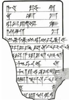
Resim 3. (Eidem, Lossoe J. 2001, text 44, obverse).

"Kuvari'ye söyle: Kardeşin Etellum şöyle diyor:" Kakmum ülkesinin kralı Muskave Kiqibişe ülkesine saldırdı, 100 koyun, 10 koyun, esir [apardı], komşulara ... Kikibişe ... şehri kuşattı ...". 13