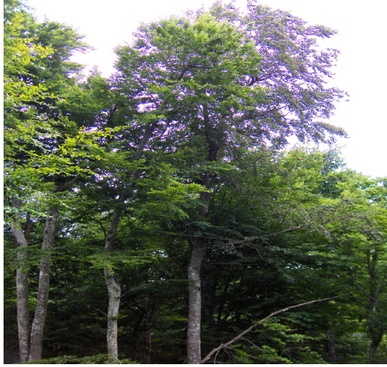
Foto 5:İğneada – Sislioba köyleri arasındaki Fagus sylvatica topluluğu.