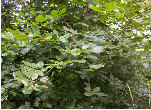
Foto 6:Binkılıç – Çilingoz arasında çalı şeklindeki Fagus sylvatica 'lar..