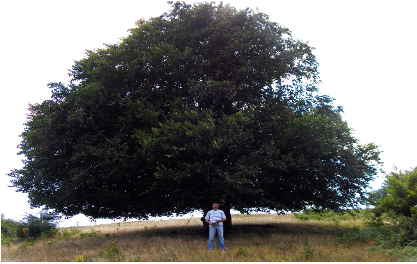
Foto 1:Ahmetler köyü kuzeyindeki Fagus sylvatica ağacından bir görünüm.

Asıl yayılış alanı Bulgaristan Istrancaları olan Fagus sylvatica 'nın, Yıldız (Istranca) dağlarında 20 ayrı yerde tespit ettiğimiz yeni yayılış alanları, hudut bölgesinden doğuya doğru uzaklaştıkça bu kayın türünün hem sıklığından kaybettiğini, hem de ağaç formundan çalı formuna dönüştüğünü aksettirmektedir. Çalışmada varılan diğer bir sonuç, Fagus sylvatica 'nın Trakya'da ulaştığı son sınırın, bilinenin aksine, Demirköy hattı değil, daha doğuda Binkılıç – Çilingöz hattı olduğudur.