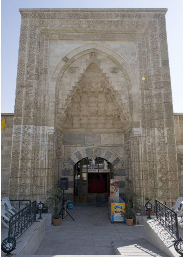
Resim 1. Hatuniye Medresesi Giriş Kapısı

Hatuniye Medresesi'nin kapısından içeri girdiğimizde sanki zamanda yolculuk yapacağımız hissine kapılmaktayız. 4500 yıllık bir yolculuk gözümüzün önünden akıp geçmekte ve bu kültür birikimini geleceğe taşımaktadır (Resim 1).