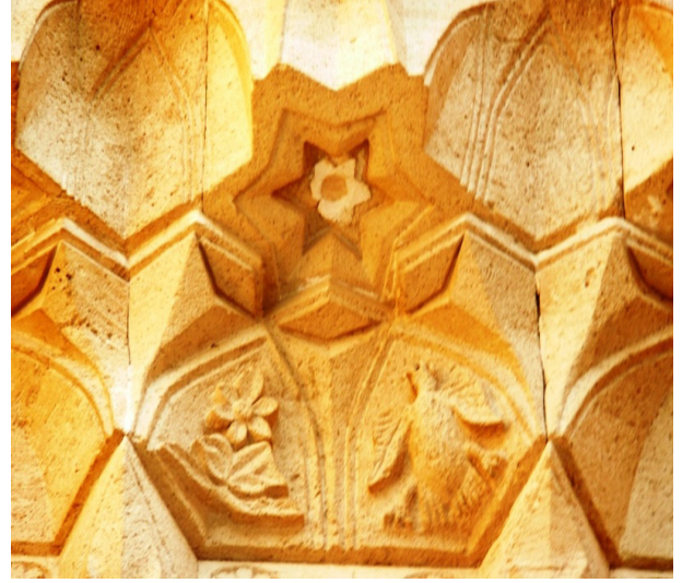
Resim 5. Sütunlardaki Bitkisel Motifler

(Gündoğdu 2008) (Resim 3 ve Resim 4). Medrese'nin ihtişamı, geçmişte eğitime verilen önemi göstermektedir. Dönemin alimleri, bilim adamları, müderrisleri bu mekanda yetişmişlerdir (Resim 5)