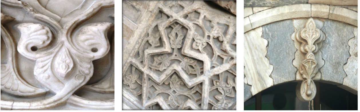
Resim 3. Hatuniye Medresesi'ndeki Süsleme Örnekleri