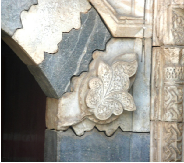
Resim 4. Süslemelerdeki Meşe Yaprağı ve Ongun Kuşu Ayrıntısı