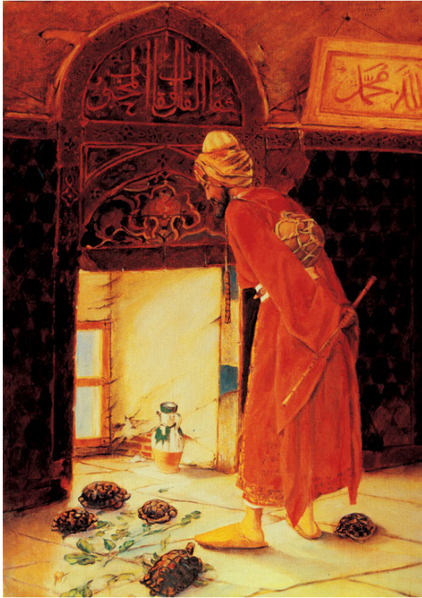
Resim 6. Osman Hamdi Bey'in "Kapumbağa Terbiyecisi" tablosu

□ Medrese'nin soldaki kubbeli bölümünde Nefise Sultan'ın türbesi (mezarı) bulunmaktadır.