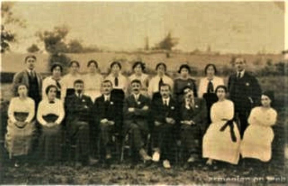
Konya Ermeni Sahakyan Okulu öğretmen ve öğrencileri