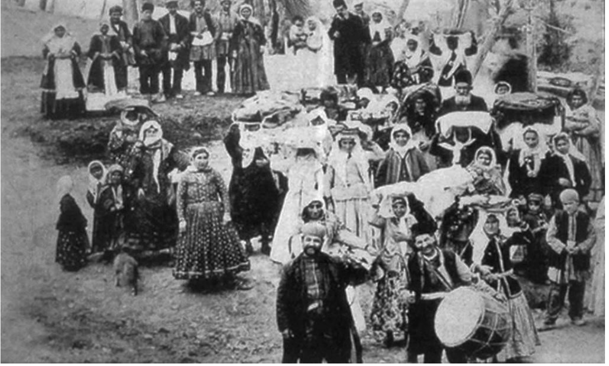
Konyalı Ermenilerin düğünlerinden “gelin alayı” 1900