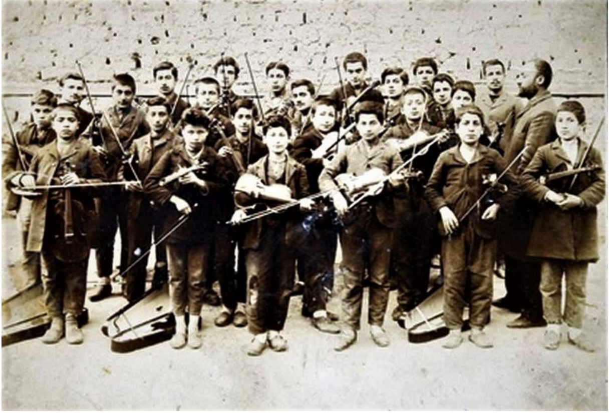
Konya Cenanyan Okulu Yessasiyan Orkestra Kulübü öğrencileri toplu halde görülüyorlar