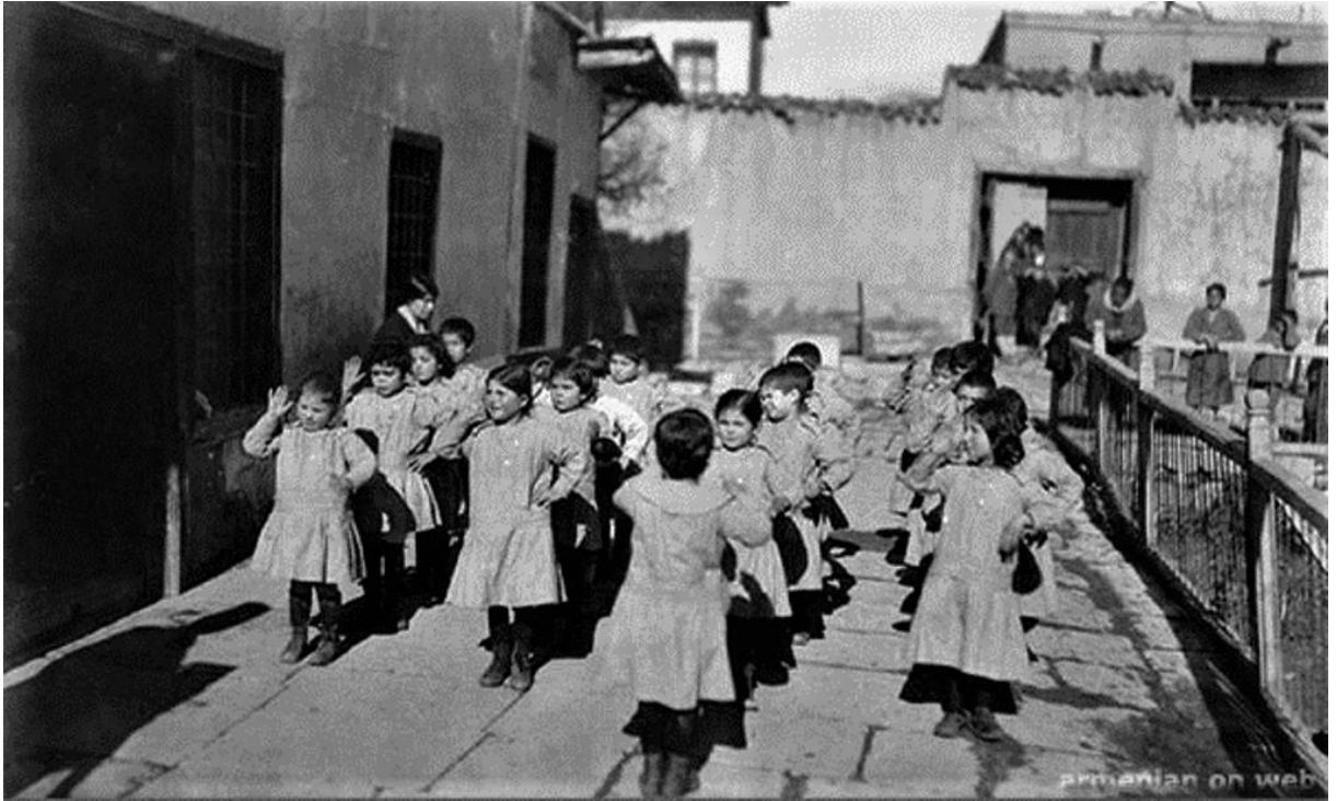
Konya Ermeni Kortoprus Mektebi öğrencilerine ait çekilen tek fotoğraf karesi