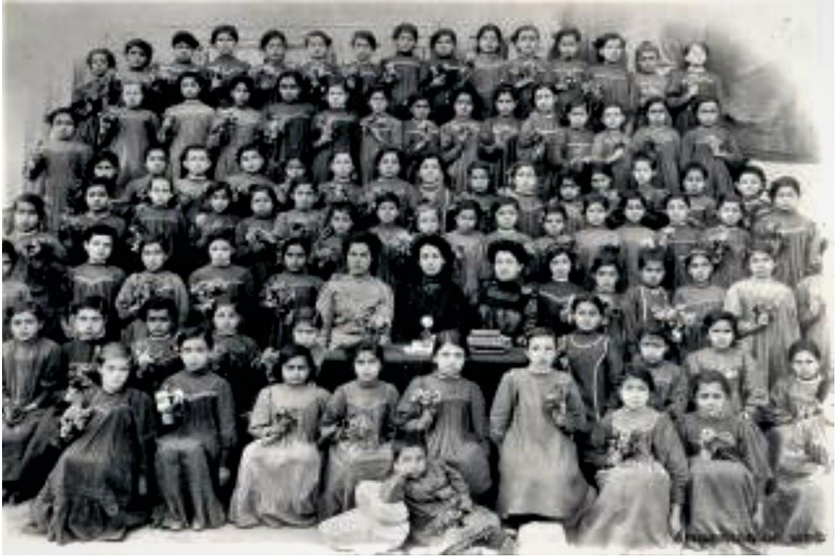
Ermeni Sahakyan Okulu kız öğrencileri