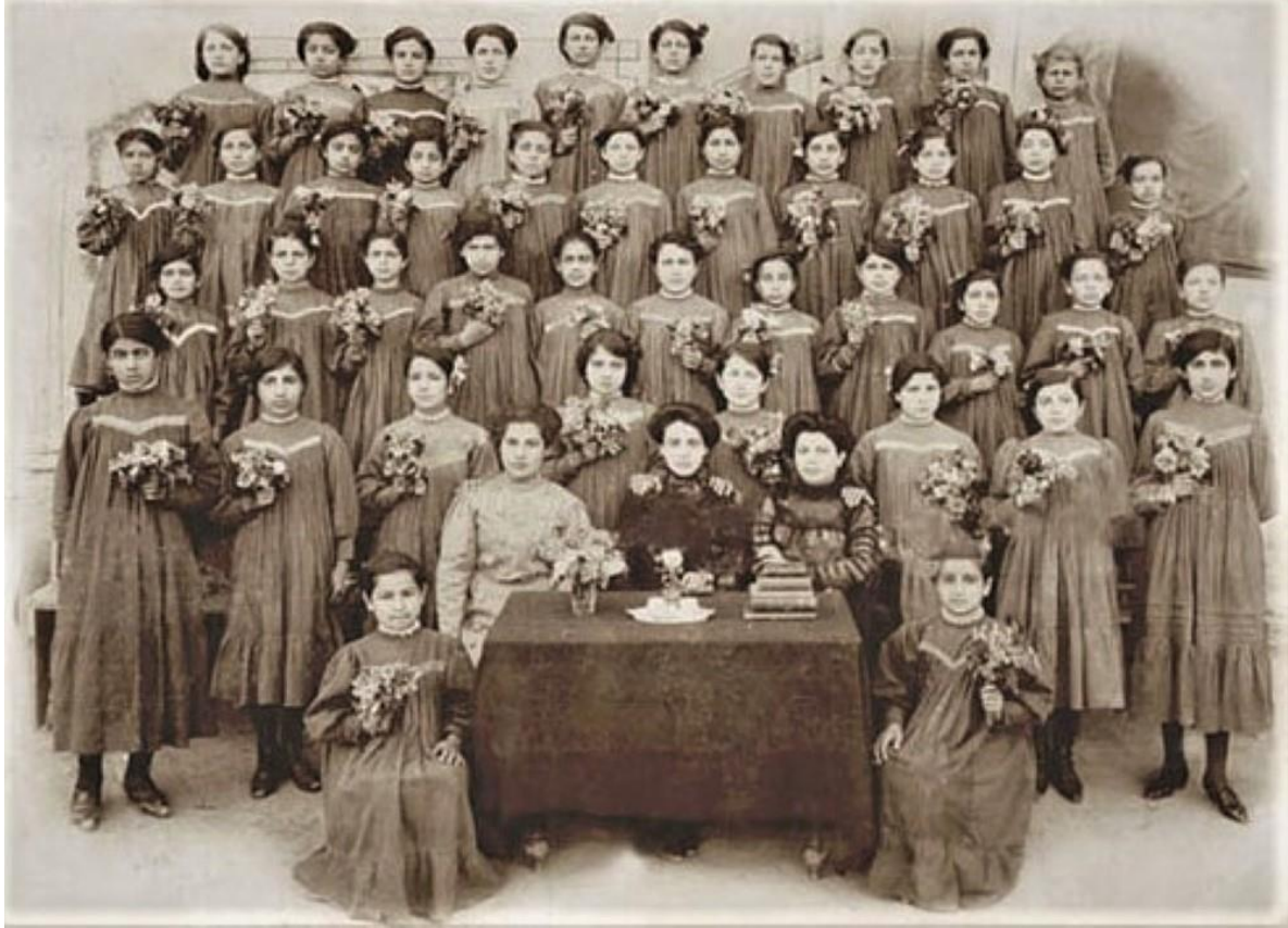
Ermeni Sahakyan Okulu kız öğrencilerinin başka bir anısı