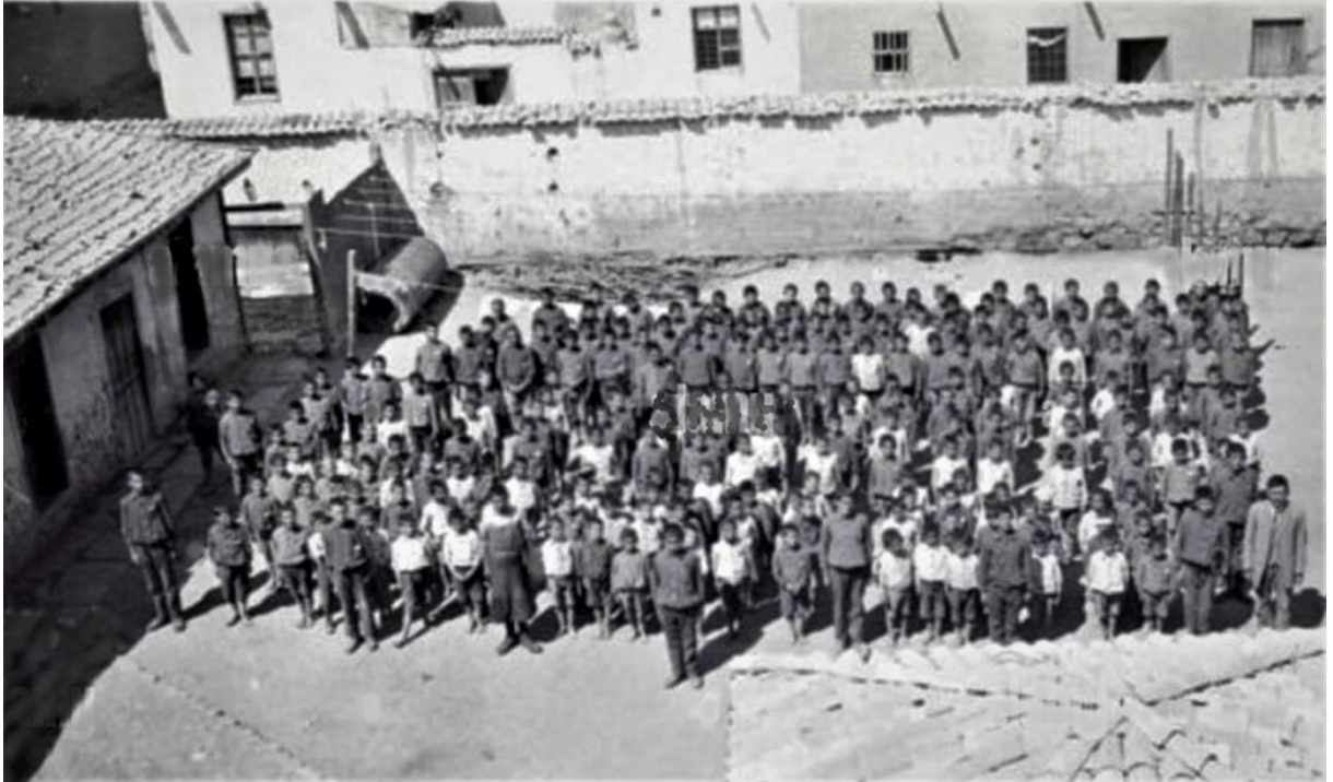
Ermeni Sahakyan Mektebi'nde okuyan Yetim ve öksüz Konyalı Türk Çocuklar