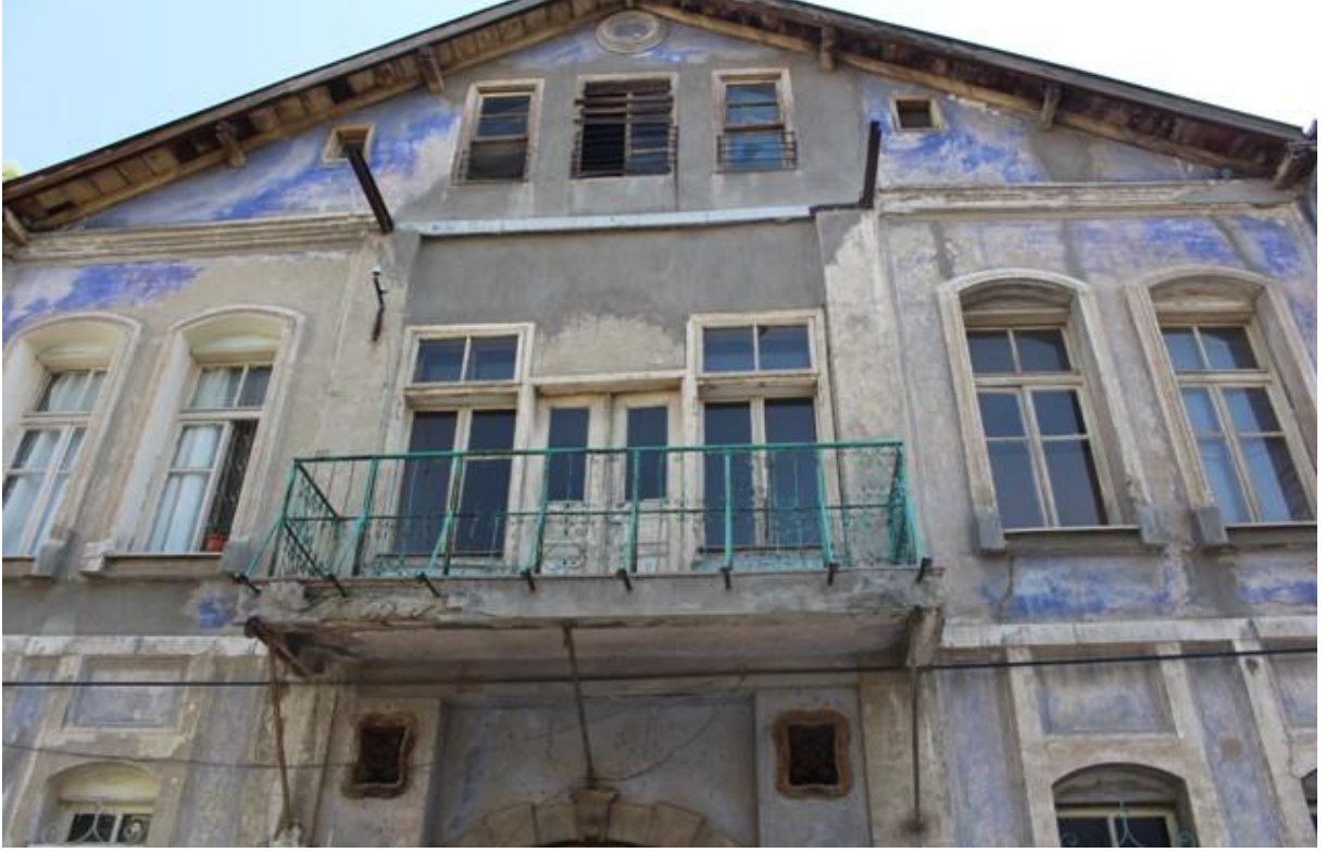
Günümüzde Şems-i Tebrizi Mahallesi Dr. Abdullah Salim Sokakta bulunan Ermeni Cenanyan Mektebi (Eski Konya Polis Mektebi) Binasının ön cephesinden bir görüntü