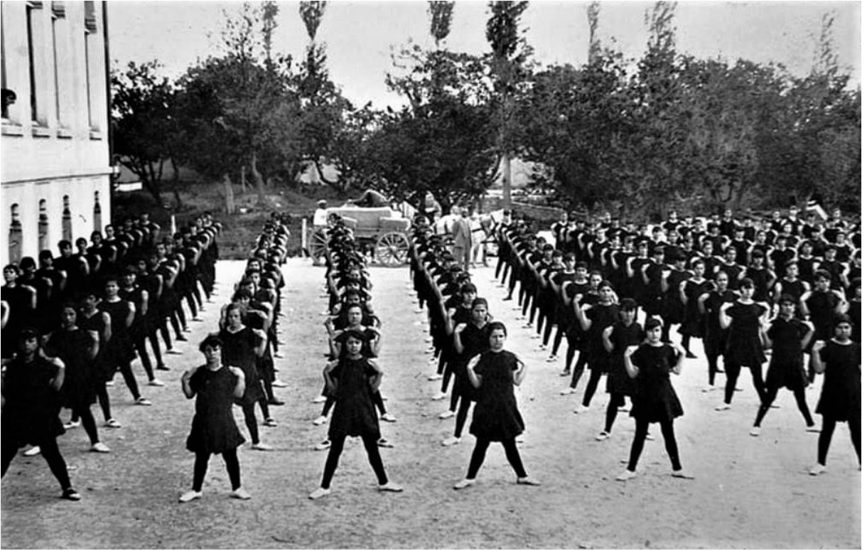
Konya Ermeni Cenanyan Okulu'nun Atletizm Kulübü'nün beden eğitimi faaliyetine katılan öğrencilerine ait bir görsel