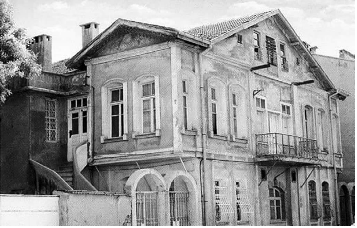
Konya Ermeni Cenanyan Okulu Binası