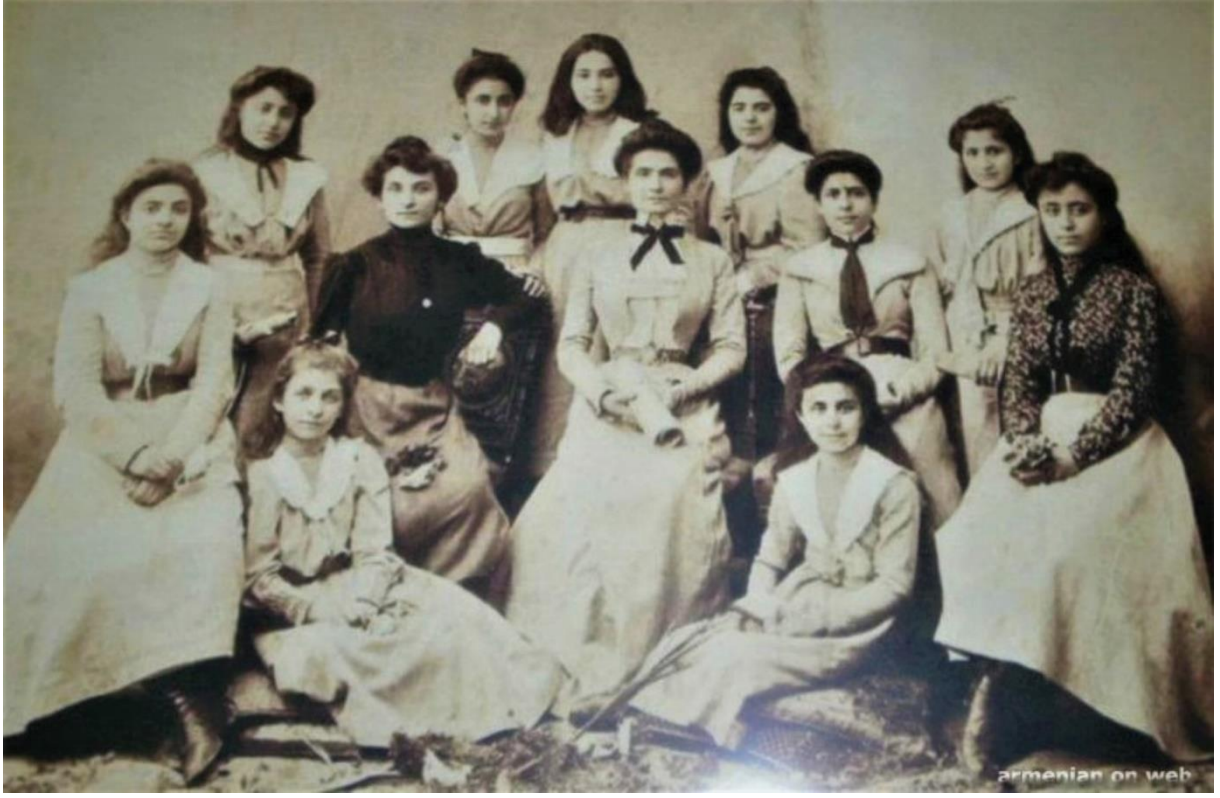
Konya Ermeni Sahakyan Okulu öğrencilerinden başka bir grup