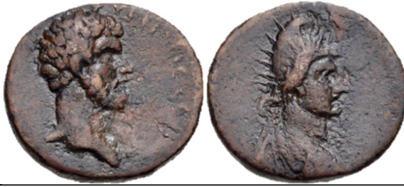
Fig 4: Trapezos (AD 161-169) AE 24 - Lucius Verus. http://www.asiaminorcoins.com/gallery/displayimage.php?pid=11816