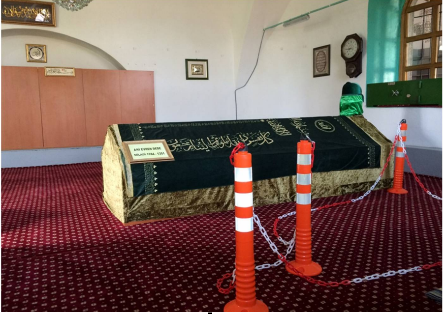
Resim 7: Ahi Evran Dede Türbesi (Trabzon / Boztepe)