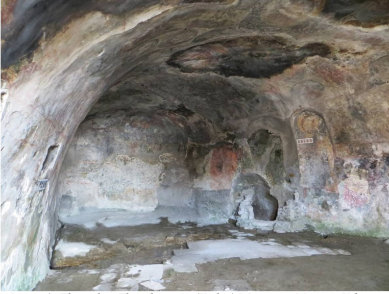
Resim 1: Theotokos Theoskepatos (Kızlar) Manastırı Mağara Kilisesi (Mithra Tapınağı)