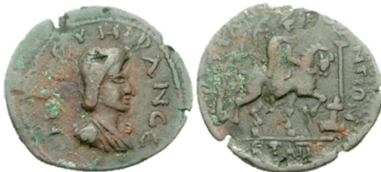
Fig 7: Trapezos (AD 244-249) AE 30 - Otacilia Severa http://www.asiaminorcoins.com/gallery/displayimage.php?pid=6635