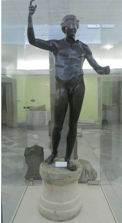
Resim 6: Hermes Heykeli (Trabzon Müzesi)