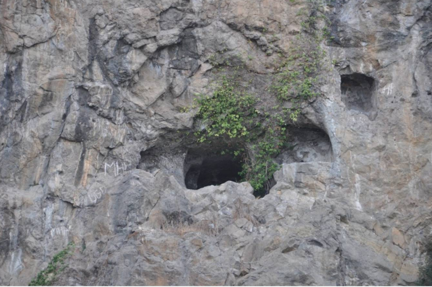
Resim 4: St. Sabbas Mağara Kiliseleri (Batıdaki Mağara)