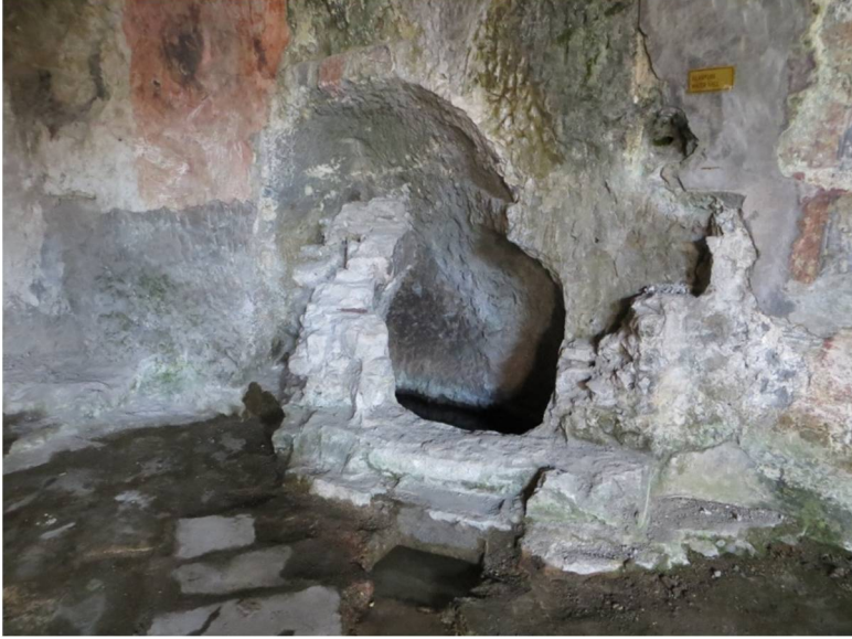
Resim 2: Theotokos Theoskepatos (Kızlar) Manastırı Mağara Kilisesi İçindeki Pınar