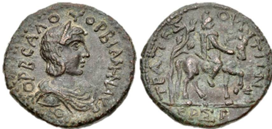
Fig 6: Trapezos (AD 225-227) AE 29 - Orbiana http://www.asiaminorcoins.com/gallery/displayimage.php?pid=8164