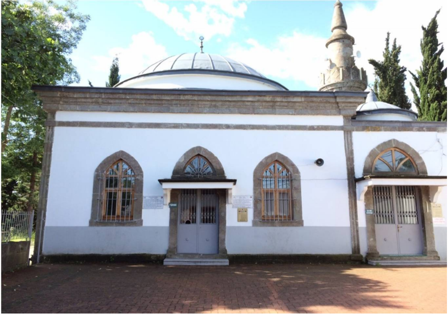
Resim 8: Ahi Evran Dede Cami (Trabzon / Boztepe)