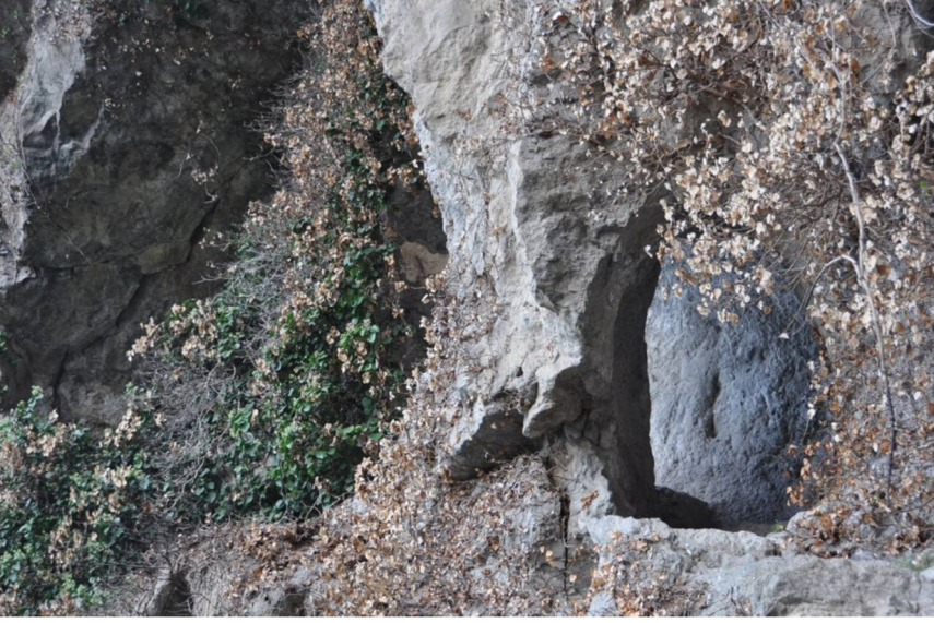
Resim 3: St. Sabbas Mağara Kiliseleri (Doğudaki Mağara)