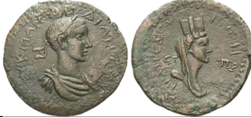
Fig. 1: Trapezos (AD 238-244) - Gordian II http://www.asiaminorcoins.com/gallery/displayimage.php?pid=8457