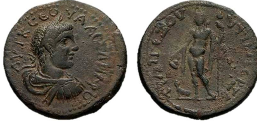
Fig. 2: Trapezos (AD 222-235) - Severus Alexander