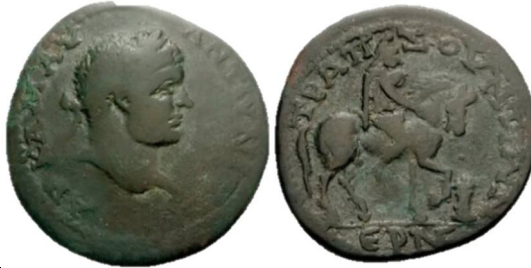
Fig 5: Trapezos (AD 198-217) AE 27 - Caracalla