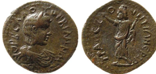
Fig. 3: Trapezos (AD 222-227) – Orbianus