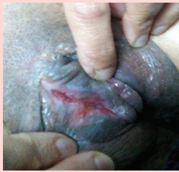
Resim 1. Crohn hastalığında vulvar ülser