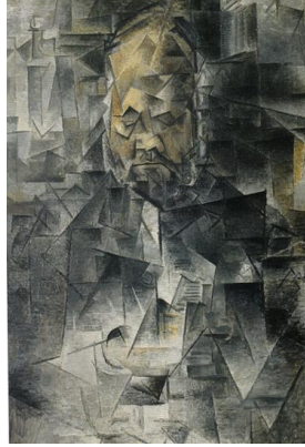
Pablo Picasso, 1910. 93X6

Vollard ve Picasso'nun arasındaki ilişki sürekliliği olan ve 1901'de başlayan sonrasında 40 yıl devam etmiş bir ilişkidir. Bu ilişkinin zaman zaman niteliği değişmekteydi, arkadaşlık ve ticari ilişkiyi içeriyordu. Vollard Picasso'nun ilk Paris gösterisini yapmıştır, muhtemelen çok ucuz fiyatlara birçok resmini satışa çıkarır ama bunu satın almak isteyenleri redderek yapmıştır. Bu Vollard'ın sürekli yaptığı yöntemdir, böylece satılmayan eserler kendisine kalmaktadır. Yıllar ilerledikçe Picasso'nun ünü artmıştır, bu dönemde de Vollard sanatçının birkaç çalışmasını satın almıştır, fakat hiçbir zaman aralarında bir sözleşme yapılmamıştır. Vollard Picasso'nun mavi ve pembe dönemi öncesi çalışmalarını ve bazı heykellerini ve plakaları da yayınlamak üzere almıştır, aynı zamanda Picasso'nun illüstrasyonlarını yaptığı yayınlar da basmıştır. Picasso bu dönemde zaman zaman Kahnweiler gibi farklı sanat simsarları ile de çalışmıştır. Fakat gerek sanat eser gerekse kitap illüstrasyonları gibi bir çok konuda birlikte çalışmışlar ve Vollard ölene kadar bu ilişkileri devam etmiştir. Vollard'ın öldüğü gün orada bulunanlardan birisi de Picasso'dur (Tinterow ve Miller, 2006, s101-117).