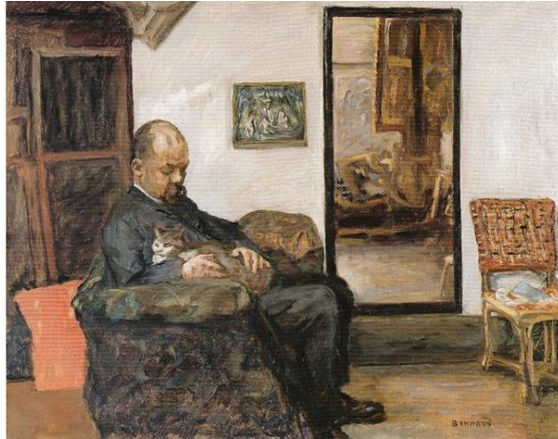
Pierre Bonnard, 1904. 74X92,5

Ticari zekası yüksek olan Vollard, riskleri yok etmek açısından genç sanatçılarla çalışmak için iyi tanınmış genç izlenimcilerin işlerini satın almaya çalışmıştır. Aynı zaman da bu sanatçıları tanıtmıştır da. 1894'de Pissarro'nun "Kar" yansımaları işleri ve Manet'in "Cenaze" adlı eseri bunlara örnektir. Degas 1890'da dikkat çekici koleksiyonlarına başladığında, Vollard'ın satması için yağlıboya resimlerinde tarzını değiştirmiştir. Renoir'in de bir çok çalışmasını alan ve satan Vollard ile Renoir'in arkadaşlığı Renoir 1919'da ölene kadar sürmüştür. Vollard monografilerinde Paul Cézanne, Auguste Renoir ve Degas'ın eserlerine büyük bir hayranlık duyduğundan bahsetmektedir. (www.artic.edu)