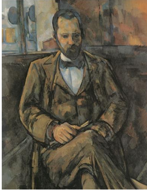
Paul Cézanne, 1899. 101X81 cm