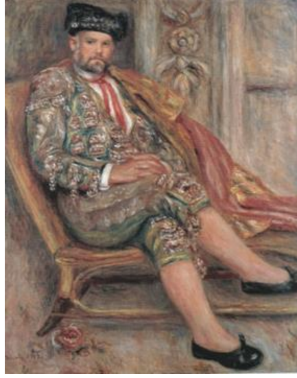
Auguste Renoir, 1917. 102.6X83.6

Ambroise Vollard tüm ileri görüşlülüğü ve ticari zekasının yanında kesinlikle sınırları olan bir sanat simsarıdır. Mesela Matisse ve Picasso'nun potansiyellerini görmekte başarısız olur ve bazı büyük sanat hareketlerini de görmezden gelir, örneğin Kübizm ve Sürrealizm gibi. Buna karşılık düzenlediği de sergiler ile Picasso, Gauguin, Matisse ve Cezanne'yi çalışmaya teşvik etmiştir. "Vollard'ın yanlışları bir elin parmakları kadardır" diye yazar Kahnweiler (Dumas,2006,s23). Vollard, onun zamanının en büyük sanat tüccarıdır. Uluslararası ortamda da parlak bir girişimci olarak Fransız sanatından daha çok modern Fransız sanatının yayılmasını yardım etmiştir (www.musee-orsay.fr). İlginç kişiliği ve görüntüsü ile etrafında farklı enerji yaratan Vollard, bazı sanatçıların yakın dostu ve destekçisi, bazı sanatçıların da çekindiği ve uzak durduğu bir sanat simsarıdır. Vollard aynı zamanda şanslı bir adamdır da, sanat tarihine yön veren pek çok sanatçı onun resimlerini yapmış, fotoğrafları çekilmiş hakkında çok yazılmış, çok konuşulmuştur.