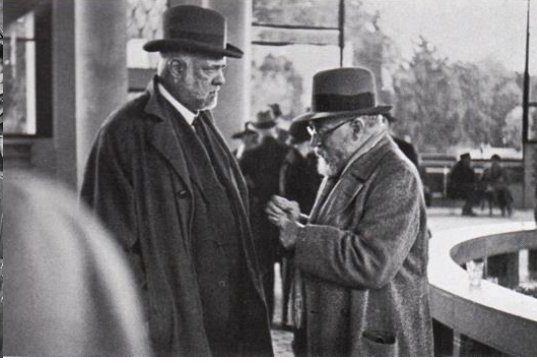
Thérèse Bonney, 1932