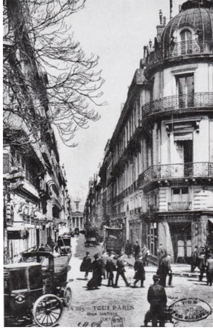
1908, Rue Laffitte, Paris