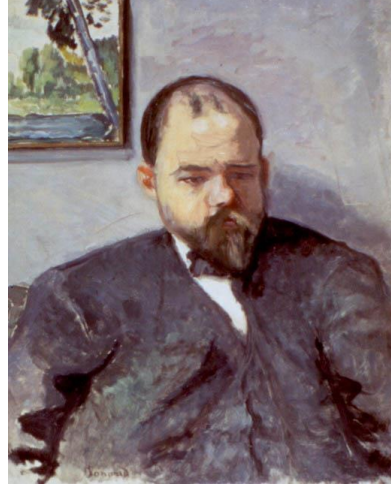
Pierre Bonnard, 1904