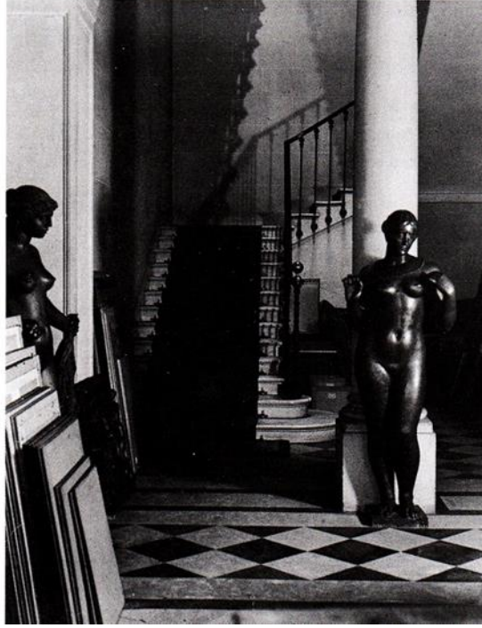
1934, 28 rue Martignac'daki evinin holü

Tüm bu özelliklerinin onu ilginç kılması, hem pek çok sanatçının patronu hem de arkadaşı olması sebebi ile Vollard'ın birlikte çalıştığı pek çok ressam onun resmini yapar, bunlardan en alımlı ve onu ifade eden resmini Pierre Bonard yapmıştır. Eserde aynı zamanda adı "Vollard" olan kedisini okşarken resmedilmiştir (Dumas,2006,s3). Genellikle asık suratlı ve sessiz bir hali olması ve özellikle Galerisinde hiç bir şey yapmadan oturuyormuş gibi görünmesine rağmen 1890'ların sonu ve 1900'lerin başlarında 12'den fazla sergi açmış, pek çok sanatçı ile anlaşmış, eserlerini satın almış ve bunların ticaretini yapmıştır.