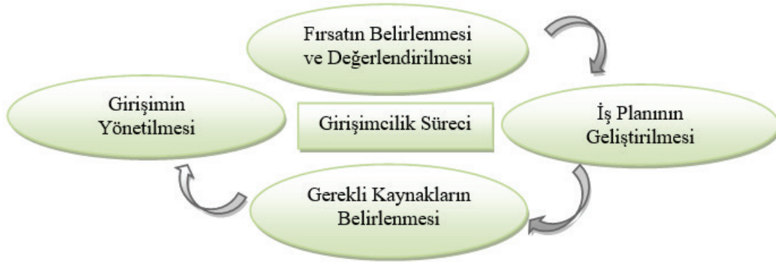
Şekil - 1: Girişimcilik Süreci

Buna göre girişimci ilk olarak bir fırsat bulmalı ve bu fırsatı geliştirmelidir. Daha sonra bu fırsatı değerlendirmek için bir iş planı geliştirmeli ve bunun için ihtiyaç duyduğu kaynakları temin etmelidir. Son olarak işletmesini kurarak yönetmelidir.