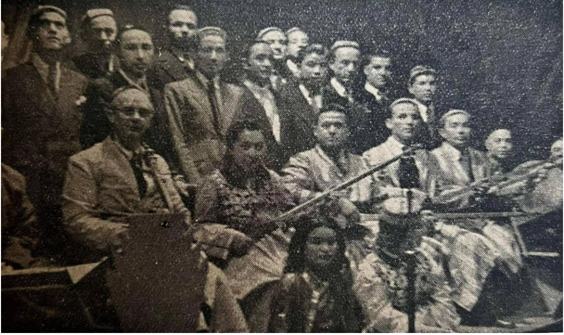
Ek 3, İstanbul'da Maksim salonunda 20 Nisan 1940 tarihinde yapılan Türkistan Gecesinde milli oyun havaları çalan bir grup (Baysun, 1945: 195).