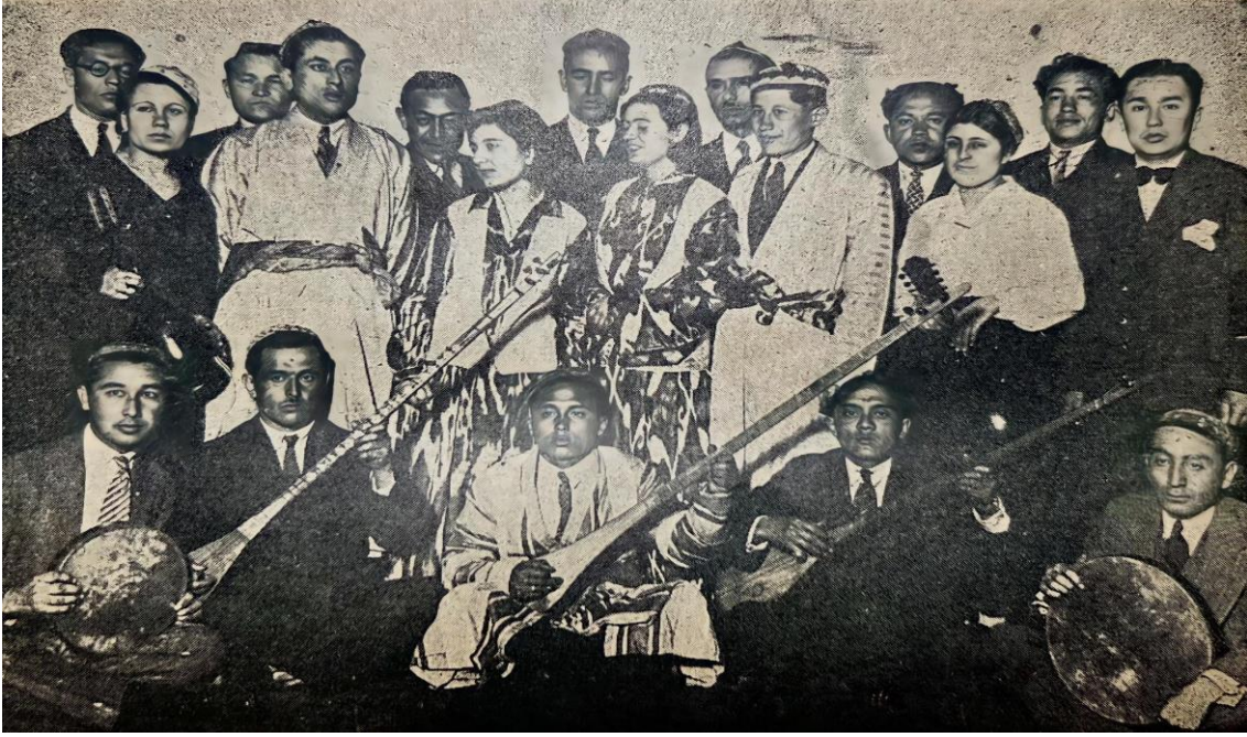
Ek 1, TTGB tarafından 18 Ağustos 1933 tarihinde hazırlanan deniz gezintisinden bir hatıra (Baysun, 1945: 194).