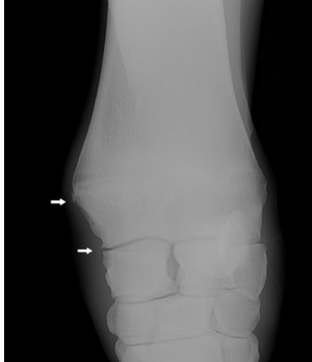
Şekil 2. Osselet olgusunun radyografisi.