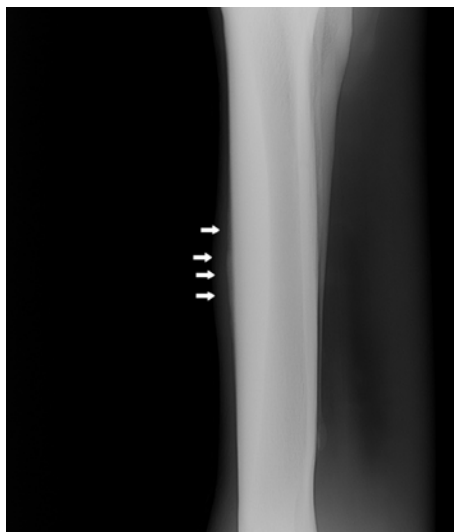
Şekil 3. Sore-shine olgusu.