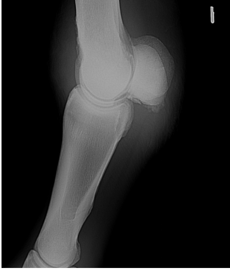
Şekil 1. Os sesamoidea da tespit edilen ekzostozisin radyografik görüntüsü.