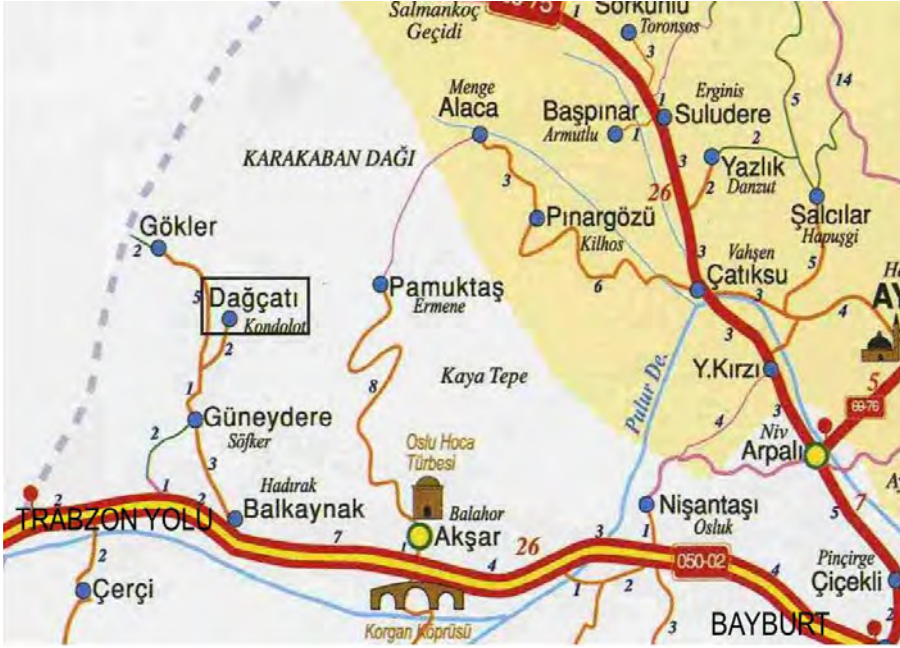
Harita 1: Bayburt/ Dağçatı Köyü Konumu.

Sağıroğlu, A.(2005). Kayseri Zamantı Irmağı Çevresindeki Bezemeli Mezar Taşları , Kayseri.