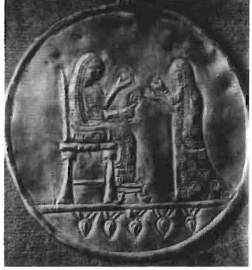
Resim 2 : Altın Madalyon, Doğu Berlin Müzesi (Akurgal)