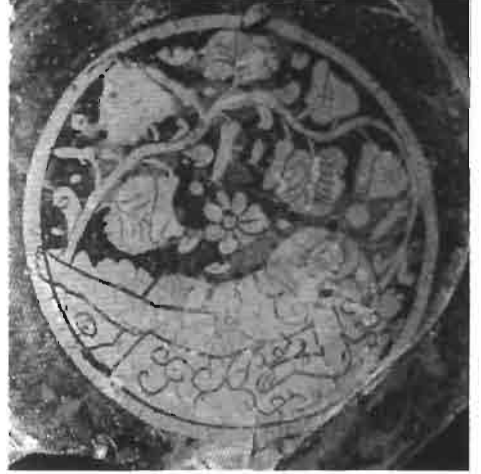
Resim 10 : Cam Kase (Ödekan)