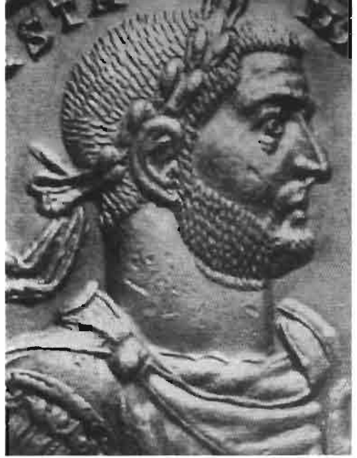
Resim 4 : Costantius Klorus