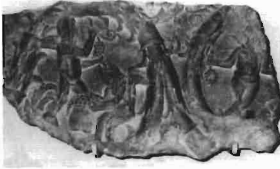
Resim 13 : I. Constantinus'un Marmar Lahtine ait Parça, İstanbul Arkeoloji Müzesi (Ödekan)