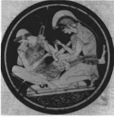
Resim 5 : Troia Savaşından Bir Sahne (Estin)