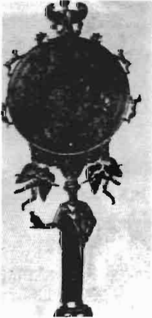
Resim 7 : Tunc Ayna Kapağı, New York Metropolitan Müzesi (Rihter)