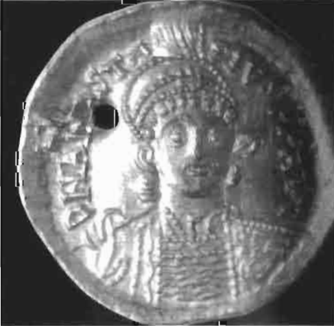
Resim 15 : Anastasius Tasvirli Altın Sirke (Tekin)