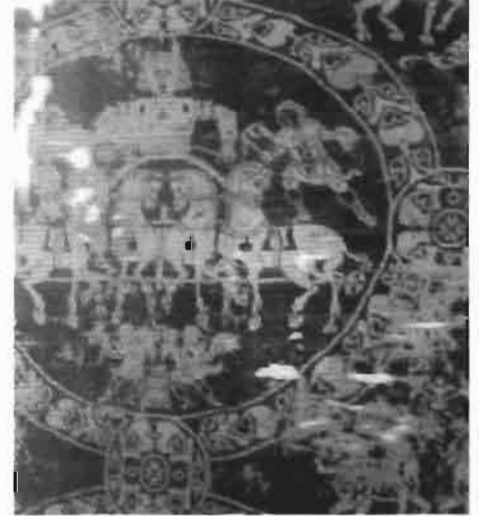
Resim 12 : Araba Yarışı, İpek Dokuma Cluny Müzesi, Paris (Ödekan)