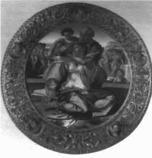
Resim 19 : Kutsal Aile. Uffizi Galeri Floransa (Könemann)