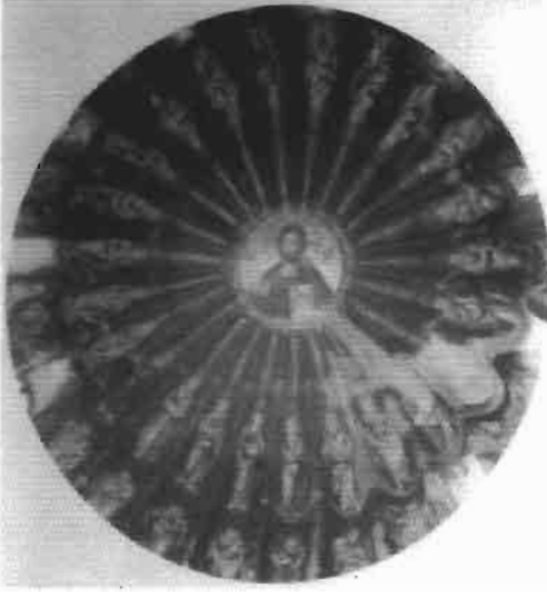
Resim 17 : Kubbede İsa, Khora Manastrır Kilisesi, İç Narteks Kubbesi (Ousterhout)