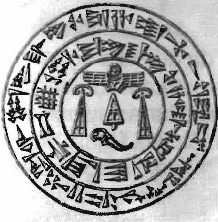
Resim 1 : Kral II. Mursili'e Ait Mühür (Akurgal)