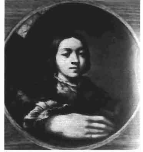
Resim 20 : Parmigianino'nun Portesi. Kunsthistorisches Müzesi Viyana (Atasoy)