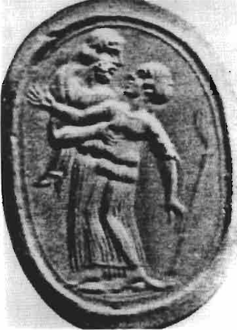
Resim 3 : Yüzük Taşı (Richter)