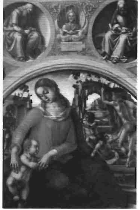
Resim 18 : Meryem ve Çocuk İsa. Uffizi Galeri Floransa (Könemann)