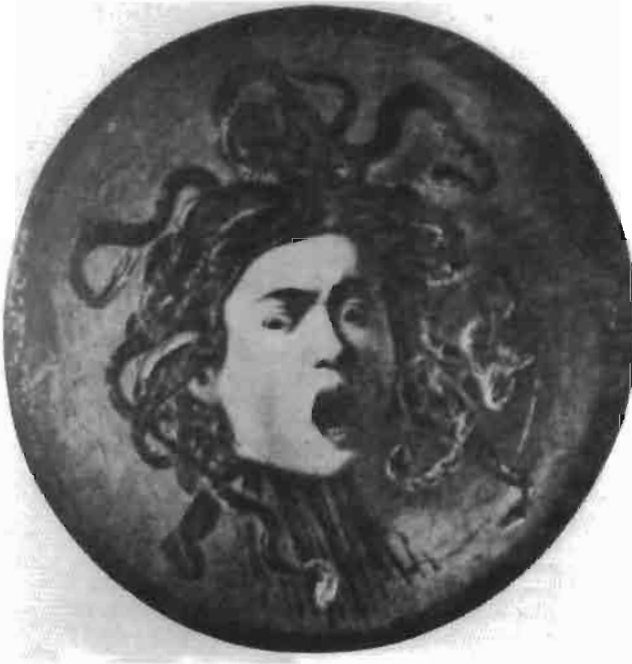
Resim 22 : Medusa. Ulfizi Galeri Floransa (Atasoy)