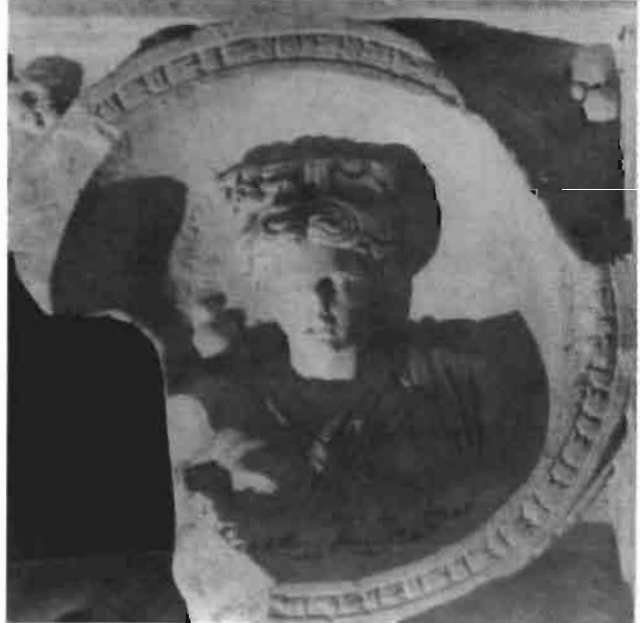
Resim 8 : Side Tiyatrosunda Aedikule'nin Alt Kat Tavan Lehvası (Mansel)