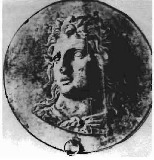
Resim 6 : Ayaklı Tunc Ayna, Walter Baker Kolleksiyonu New York (Rihter)