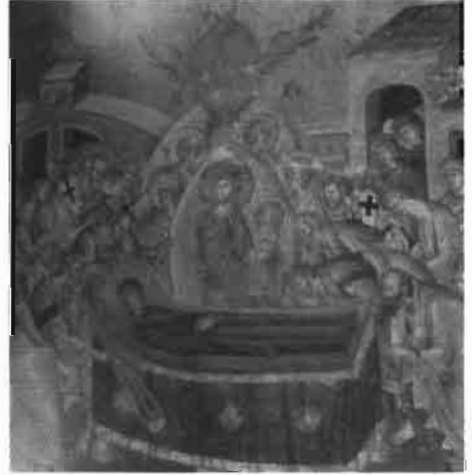
Resim 16 : Koimesis Sahnesi, Khora Manastır Kilisesi (Ousterhout)