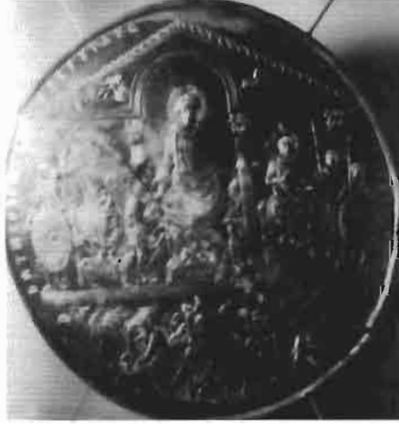
Resim 14 : Gümüş Tabak, Kraliyet Tarih Akademisi Madrid (Ödekan)