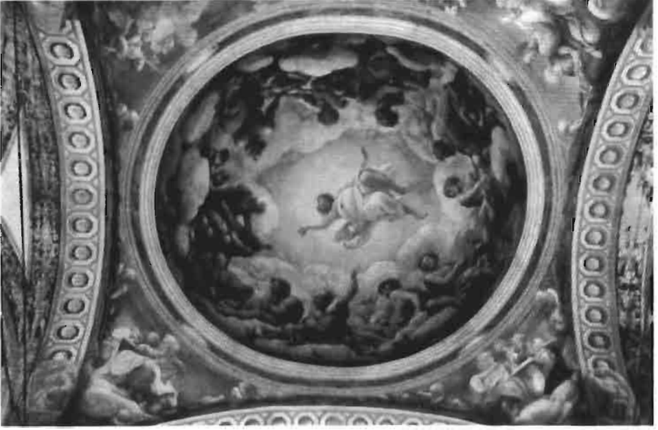
Resim 21 : San Giovanni Kilisesi Kubbe Freskosu (Könemann)