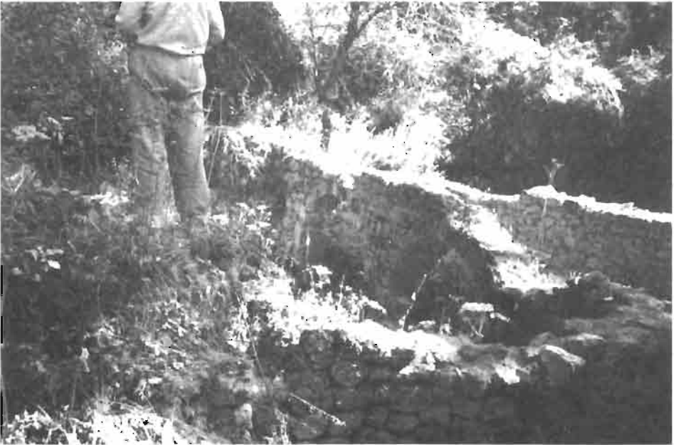
Resim : 5- Boğaz Değirmeni (üstten görünüm)