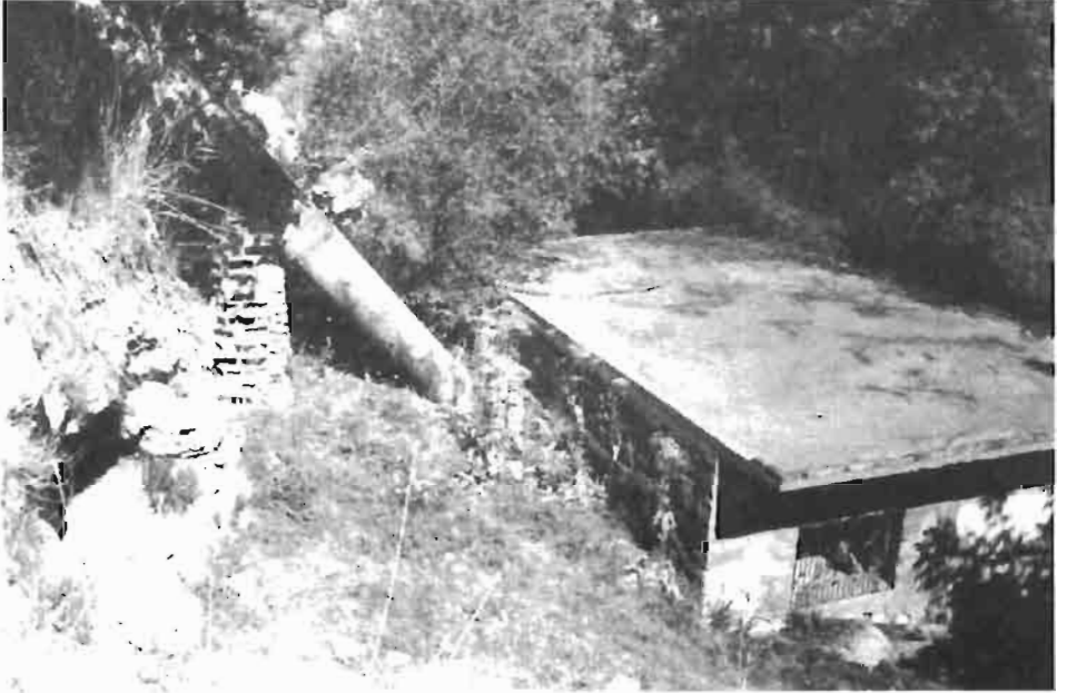
Resim : 1- Kadavan Değirmeni