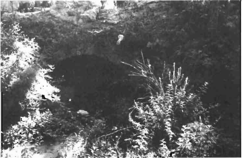
Resim : 7- Osman Ağa Değirmeni yakınında tarihi köprü