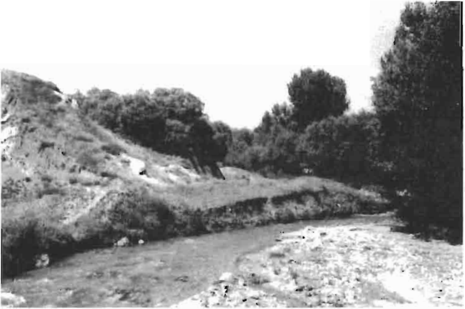
Resim : 8- Vakıf Değirmeni