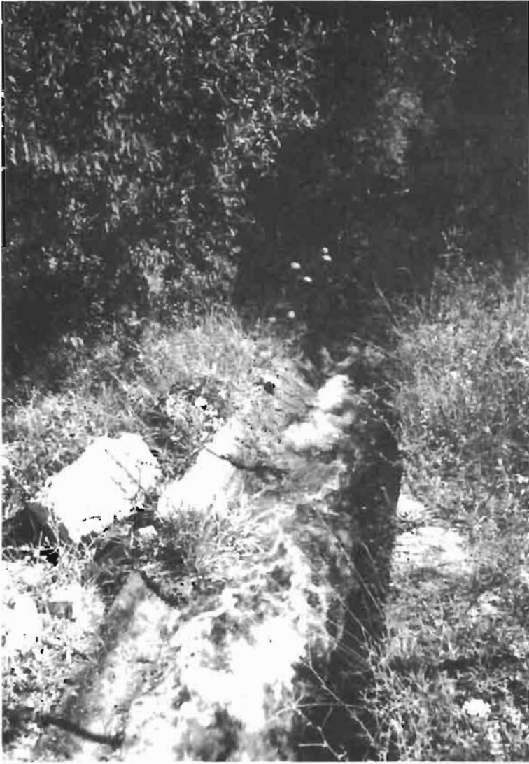
Resim : 2- Kadavan Deęirmeni su giriři