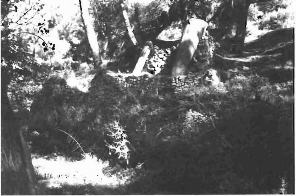
Resim : 6- Osman Ağa Değirmeni