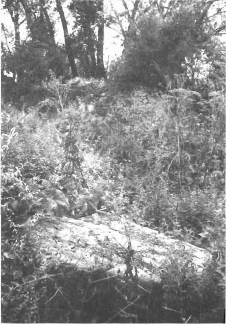
Resim : 3 Hüseyin Bey Değirmeni