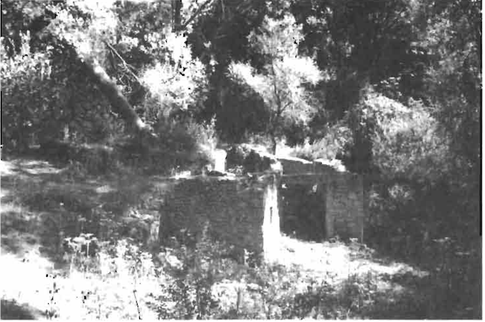
Resim : 4- Boğaz Değirmeni