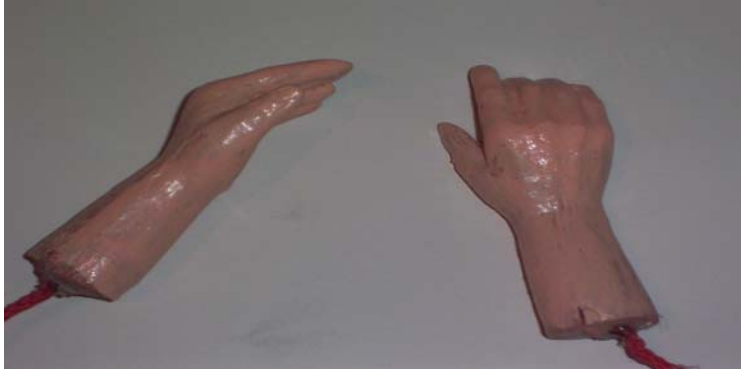
Şekil 14 : Elin ten rengi ile boyanması ve vernik sürülmesi