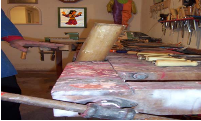
Şekil 3 : Mengene

d- Mengene : Herhangi bir ürünü sıkıştırmak için kullanılan bir çeşit presdir ( Ağakay 1974). (Bkz. Şekil 3).