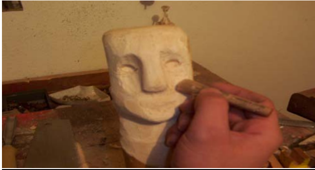
Şekil 10 : Fırça ile yüzün üzerindeki ağaç tozlarının temizlenmesi