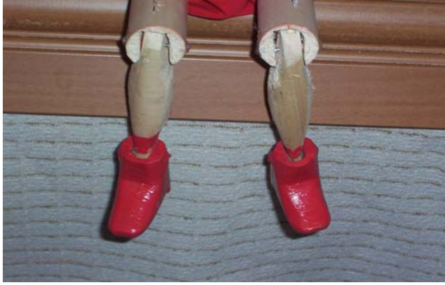
Şekil 15 : Ayağın kırmızı renk ile boyanması