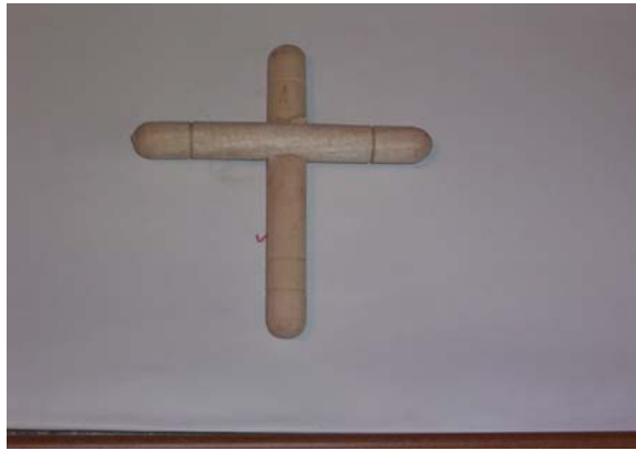
Şekil 19 : İpli kuklanın kumandası