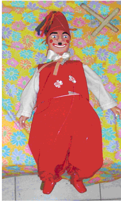
Şekil 21 : İpli Ahşap Kukla İbiş