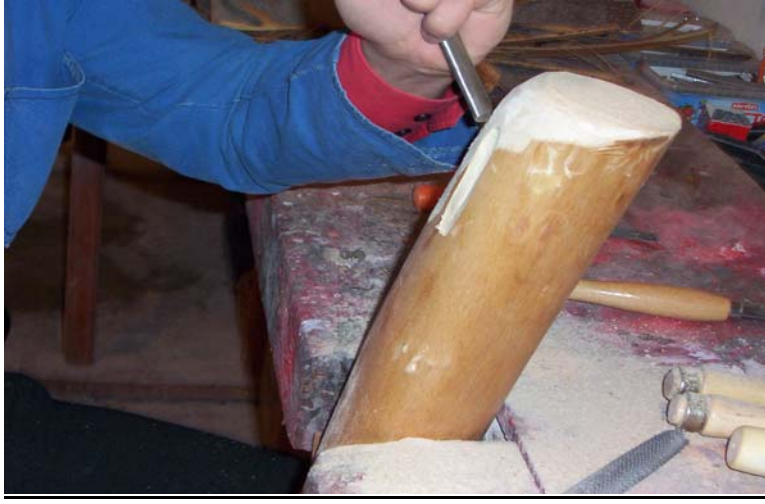
Şekil 6 : İskarpela ile burun yerinin oyulması

c. İskarpela ile ağız yerini oyunuz. (Bkz. Şekil 7).