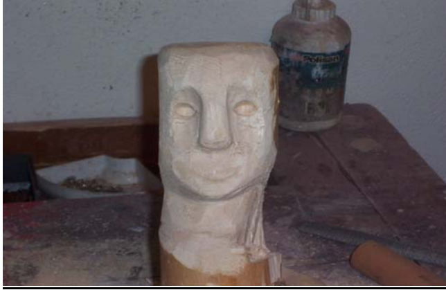
Şekil 9 : Yüzün tamamlanmış şekli