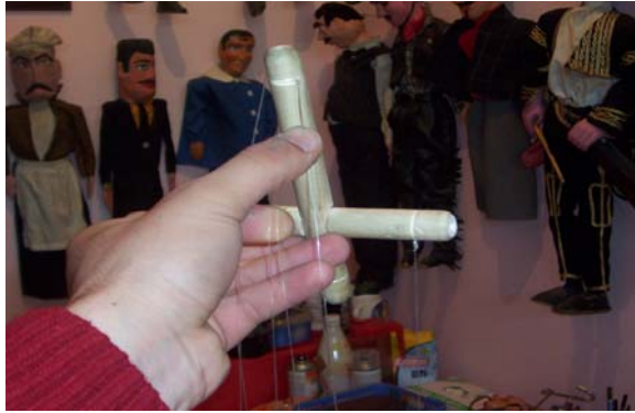
Şekil 20: Kuklanın kumandasına iplerin bağlanıp kuklaya geçirilmesi