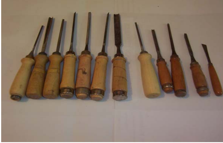
Şekil 1 : İskarpela

a- İskarpela : Marangozlukta ağaç delmek için çelikten yapılmış, ucu badem şeklinde bir araçtır ( Ağakay 1974).(Bkz. Şekil 1).