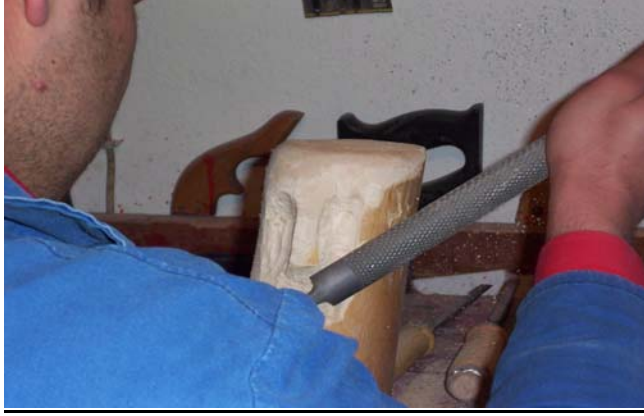
Şekil 8 : Oyulan kısımların zımpara ile düzeltilmesi