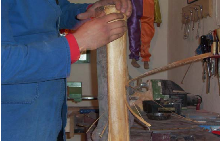
Şekil 5 : Kütüğün kabuğunun soyulması

a. Kütüğün kabuğunu soyunuz. (Bkz. Şekil 5)