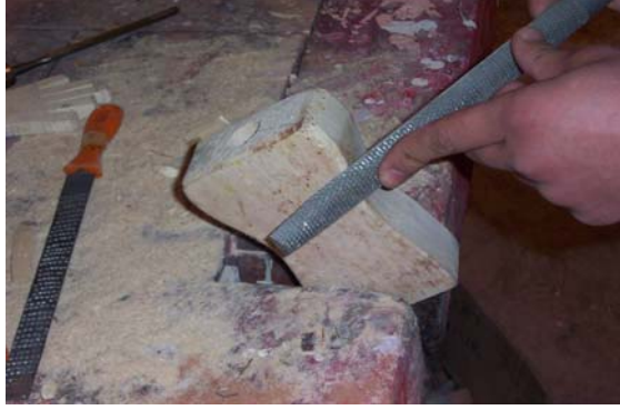
Şekil 18: Gövde olacak parça mengenede sıkıştırılarak şekil verilir.