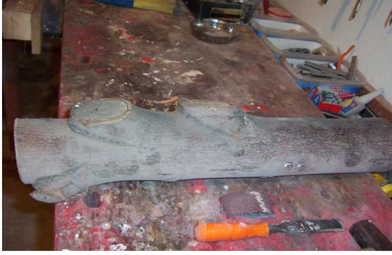
Şekil 4 : Kütük