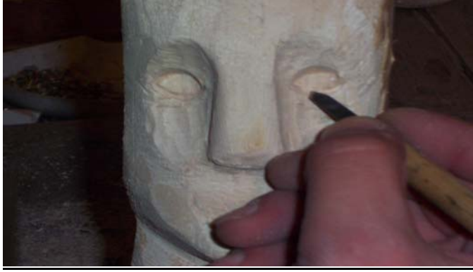
Şekil 11 : Beyaz analin boya ile yüzün boyanması

b. Beyaz analin boya ile yüzü boyayınız (Bkz. Şekil 11).