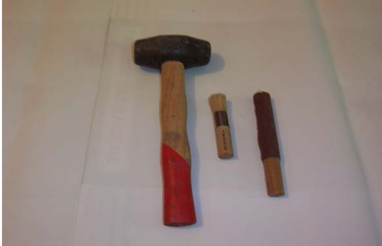
Şekil 2 : Tokmak, firça, zımpara (soldan sağa doğru)

b- Tokmak : Ağaçtan yapılmış iri bir çekiçtir ( Ağakay 1974). (Bkz. Şekil 2).