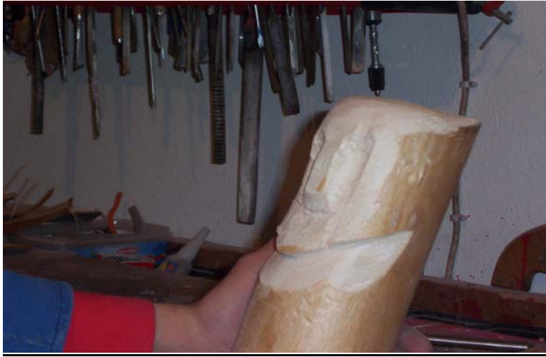
Şekil 7: İskarpela ile ağız yerinin oyulması

c. İskarpela ile ağız yerini oyunuz. (Bkz. Şekil 7).