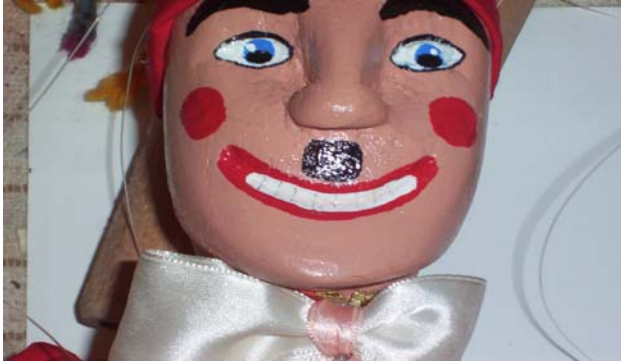
Şekil 12 : Kaş, göz, dudak yerlerinin boyanması ve yüze vernik sürülmesi