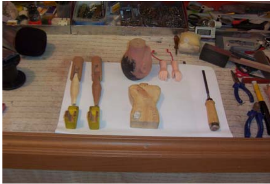
Şekil 17. Ayağın bacak ile birleştirilmesi

(Not : Eklem yerlerinin rahatlıkla oynayabilmesi için vidalı kısmın oluk şeklinde oyulması gerekir.)