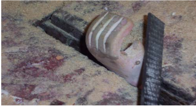
Şekil 13 : Ihlamur ağacının oyularak el şeklinin verilmesi

a. Ihlamur ağacını oyularak, el şeklini veriniz(Bkz. Şekil 13).