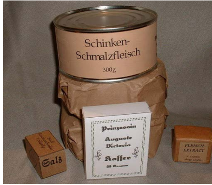
Ek-7: Örnek Alman Rasyonu.

http://17thdivision.tripod.com/rationsoftheageofempire/id5.html (30.04.2020)