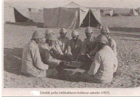
Ek-5: Faruk Yılmaz, General Allenby'nin Hatıratı (Arap Ayaklanması ve Filistin'in Osmanlı'dan Kopuşu), İz Yay., İstanbul, 2013, s. 115.