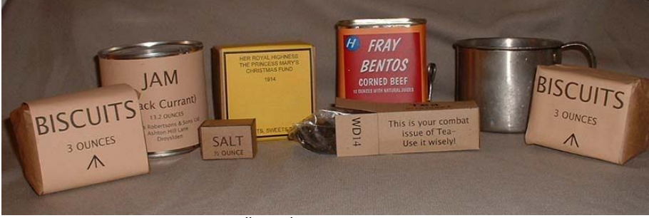
Ek-6:Örnek İngiliz Askeri Rasyonu

http://17thdivision.tripod.com/rationsoftheageofempire/id5.html (30.04.2020)