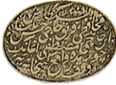
Resim 3: Yedi Sekiz Hasan Paşa'nın Kitaplarında Kullandığı Vakıf Mührü

Vakfedilen kitapların üzerine genellikle ya vakıf mührü basılmakta ya da vakıf kaydı eklenmekteydi. Vakıf kayıtları daha çok İslam dünyasında görülmekte, Osmanlı Devlet'inde bunun örneklerine çok daha az rastlanmaktaydı. Bunun yerine mühürlerin üzerinde vakfın ismi, vakfın bir şartı veya bir vakıf kaydı bulunmaktaydı (Erünsal, 2020: 477). Hasan Paşa'nın kütüphanesi için de yaptırdığı bir vakıf mührü bulunmaktadır. Vakıf mühründe, "Beşiktaş Muhafızı Ferik Hacı Hasan Paşa İbn Hacı Mustafa Ağa'nın Çorum'da vak'î kütüphaneye vakfidir, 1314" yazmaktadır. 10 Mührü genellikle kitaplarının ilk sayfalarına, ortalarına ve sonuna karışık olarak basmıştır.