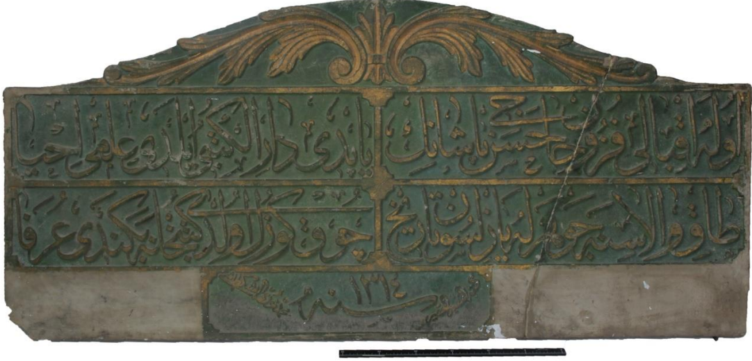
Resim 2: Yedi Sekiz Hasan Paşa Kütüphanesinin Kitabesi

Hasan Paşa kütüphanesinden geriye kitabesi ve kitapları kalmıştır. Kitabesinde “Ola ikbal-i füz’un Hacı Hasan Paşa’nın / yaptı darü’l kütübi eyledi ilmi ihya / tak-ı vâlâsına cevherle yazulsun tarih/ çok güzel kütüphane oldu beğendi u’refa / ketebehu el fakir el hakir sene 1314, Mehmed Nuri el-Beşiktaşî” yazmaktadır. Hasan Paşa kütüphanesinin kitabesi bugün Çorum Müzesinde muhafaza edilmektedir. 9