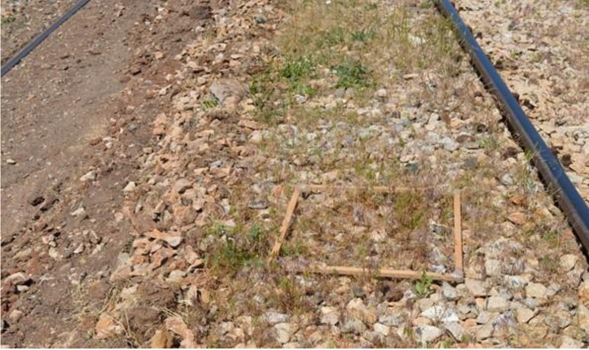
Şekil 1. Yabancı ot sayımları