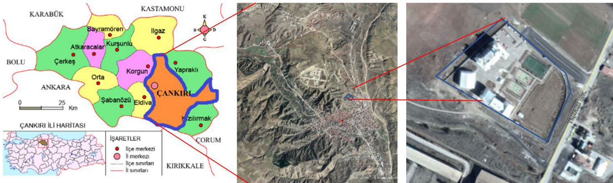
Şekil 1. Ülke ve İl Ölçeğinde Çankırı TOBB Fen Lisesi Coğrafi Konumu

Araştırmaya 460 öğrenci kapasiteli "Çankırı TOBB Fen Lisesi"nden okul yönetiminin önerisi doğrultusunda gönüllü olarak 21 öğrenci dahil olmuştur.