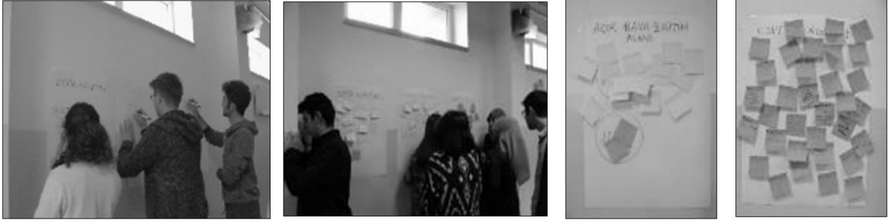
Şekil 5. Katılım yöntemi: katılımcı soru sorma eylemi