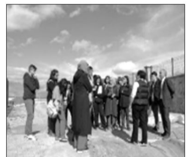
Şekil 3. Alanın öğrencilerle gezilerek bizzat yerinde tespitlerde bulunma aşaması