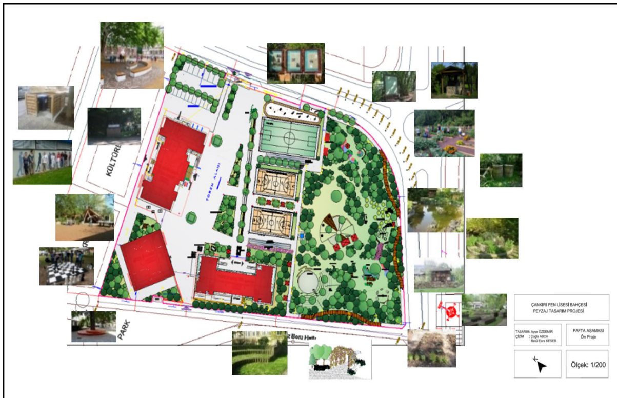
Şekil 7. Alana yönelik tasar önerisi Figure 7. Design proposal for the space

Bununla birlikte “okul bahçesinin dönüşüm sürecinin hangi aşamalarında yer almak istersiniz?” sorusuna öğrencilerin vermiş oldukları cevaplarda aşamalardan; araştırma ve tespit yapma, sorun ve olanakları belirleme, fikir geliştirme, tasarım projesi hazırlama, uygulama ve bakım ve onarım aşamalarında, yani tüm süreçte yer almak istedikleri tespit edilmiştir. Bu çalışmada ise tasarım projesi hazırlama aşamasına kadar gelme şansı olmuştur. Ancak uygulama ve sonraki aşamalarda da öğrencilerin dahil edilmesi daha başarılı bir alan kullanımına götüreceğini söylemek mümkündür. Bu nedenle öğrencilerin okul bahçesi peyzaj tasarımı projesinin uygulanması aşamasında ve sonrasında okul bahçesinin yönetim sürecinde katılımcı yaklaşım/sürecinin diğer yöntemlere ilaveten “katılımcı eylem duvarı”, “aplikasyona katılım” ve “benim fikrim” gibi yöntemleri ile öğrencilerinin etkin katılımının sağlanması önerilmektedir ki, bu da sağlıklı bir alan kullanım sürecinin işleyişine neden olacaktır. Bununla birlikte okul bahçelerinin dönüşüm sürecinde bitkisel ve yapısal peyzaj düzenlemelerinin önceliklerine ve yapılabirliklerine göre yıllara yayılarak gerçekleştirilmesi finans anlamında önemli kolaylıklar sağlayacaktır. Bu aynı zamanda her yıl yeni öğrencilerin sürece aktif katılımının sağlanmasına ve alanın etkin kullanımı ile sürekliliğine zemin hazırlayacaktır (Özdemir, 2011). Bunun için ise bu alan çalışmasına rehber olabilecek eylem ve zaman planı süreci aşağıdaki Çizelge 3’de sunulmuştur.