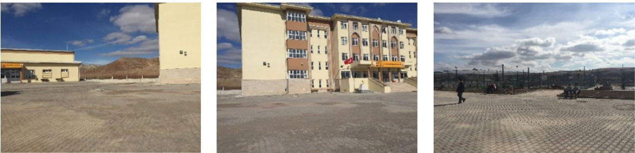
Şekil 2. Araştırma alanının mevcut durumu görünümü