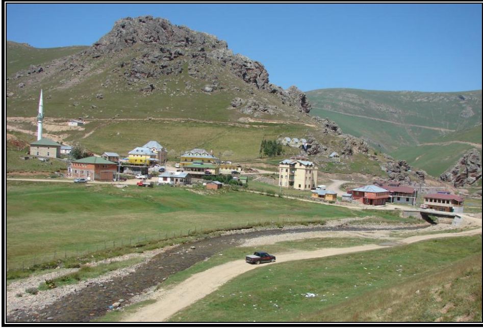
Fotoğraf 3. Taşköprü, turistik işlevleri gelişmiş yaylalara tipik bir örnektir.

bakkal dükkânı ve bunlardaki 30 çalışanı ile dikkati çeker (Fotoğraf 4). Buradaki turistik tesislerde ziyaretçilere büyük ölçüde, çevre yaylalarda beslenen koyun ve büyükbaş hayvan etlerinden ikram edilir. Bunun dışında, Karadeniz mutfağına ait bazı yöresel yemekleri de bulmak mümkündür.