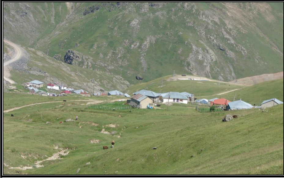
Fotoğraf 2. Hayvancılığa bağlı olarak gelişen Çiçekli yaylasından bir görünüm.

Kalkanlı Dağları'nın yüksek düzlükleri, geçmişten günümüze yaylacılık faaliyet sahası olarak kullanılmaktadır. Bu aktivitenin temelini hayvancılık oluşturmakla birlikte, sağlıklı bir iklimde bulunmayı da geleneksel olarak içermektedir (Alagöz, 1993: 43). Nitekim inceleme sahası ve yakın çevresinde Taşköprü, Taşdibi, Sıcakırmak, Çiçekli, Eğrisu, Kurugöl ve Kavras gibi hayvancılık ekonomisine bağlı olarak gelişen yayla yerleşmeleri bulunur (Harita 2, Fotoğraf 2). Bunlardan Taşköprü, turistik işlevleri ön plâna çıkmış yayla yerleşmelerinden birisi olarak dikkati çeker.