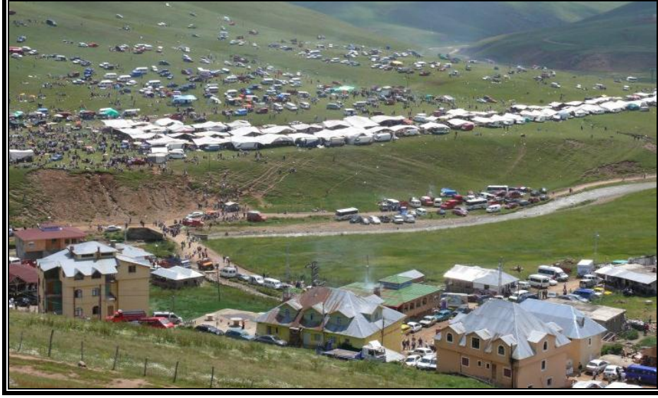
Fotoğraf 6. Geleneksel Taşköprü Kültür ve Yayla Şenliği'nden bir görünüm