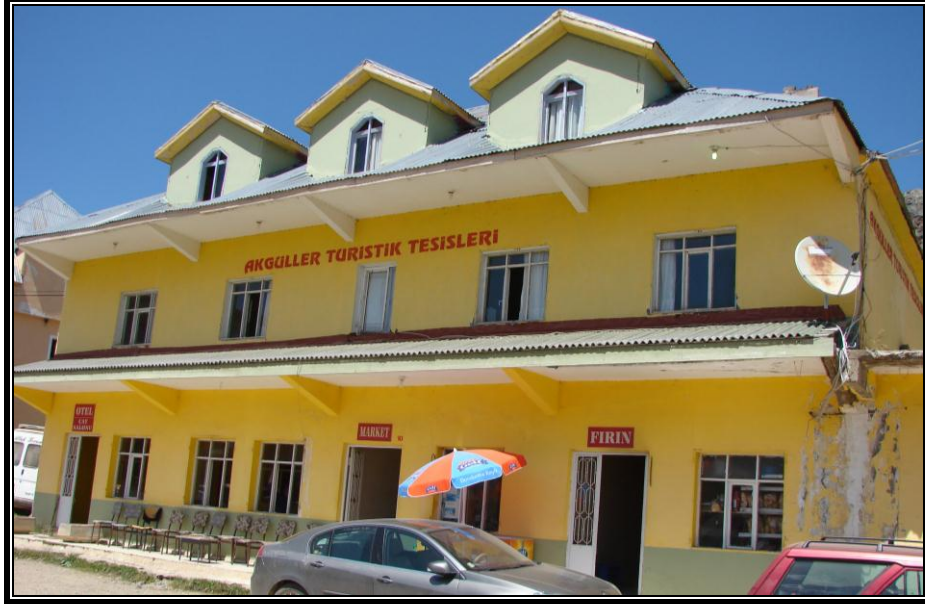
Fotoğraf 4. Taşköprü’de otel, lokanta, market, fırın ve çay ocağı gibi hizmet birimlerinin bulunduğu, ancak doğal ve kültürel ortam özelliklerini yansıtmayan turistik tesislerden bir görünüm.