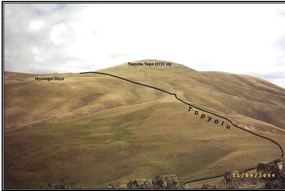
Fotoğraf 1. Horasan-Narman sınırındaki Topyolu Tepe ve yakın çevresi.

“Kars’tan Oltu’ya ve Soğanlı Dağı’nın Bardız üzerindeki Narman Dağına bitişik olan Sultan Selim’den kalma Topyolu’nu yenilemek üzere Ruslar bir alay asker tayin etmiştir ki, bu alay bütün âlet ve edevatıyla çalışan istihkâm alayıdır. Bu Topyolu dağların sırtından ve suların ayırdığı vadilerden gider ve Bursa’ya kadar devam eder. Narman’dan doğruca Erzurum’un Gürcü Boğazı’na gelinir ki, bu Topyolunu evvelden ben de görmüşüm”. 12