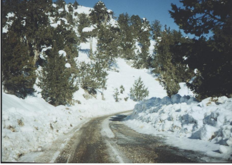
Foto 3. Saklıkent yayla yerleşmesi yakınlarında kar örtüsü ile kaplı karayolu (Şubat 2002)

Bu merkezde kayak sezonu, Aralık ayı ikinci yarısı itibari ile başlar, Mart ayının ortalarına kadar devam eder. Bu süre yaklaşık 90-100 gün sürer. Bazı yıllar, kar yağışı miktarındaki artma ve azalmalara bağlı olarak kayak sezonu süresi değişebilmektedir.