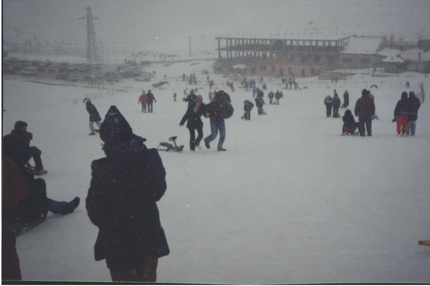
Foto 4. Kayak merkezinde kar kızıağı pisti ve kayan insanlar

Aralık ayı ortaları ile Mart ayı ortalarını kapsayan kayak sezonu devresinde, sahayı günlük 150 araç ya da, ortalama 500 kişi ziyaret eder. ii Ziyaretçi sayısında, hafta sonları, bayram tatilleri ve yarıyıl sonu tatillerinde belirgin bir artış olur. Bu dönemlerde ziyaretçi sayısı ortalama olarak 2000 rakamına ulaşabilmektedir.