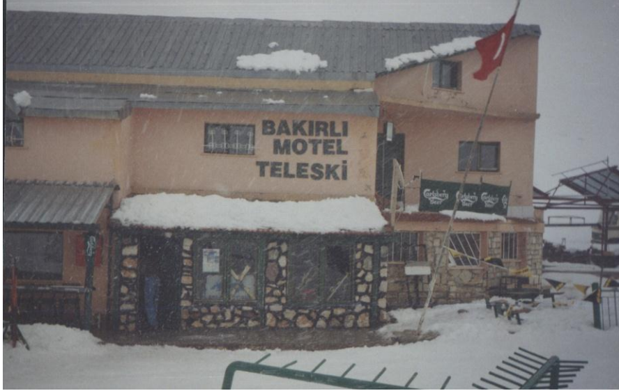
Foto 5. Konaklama tesislerinden Bakırlı Motel

In Antalya As A Winter Tourism Center Which is Less Known: Saklıkent