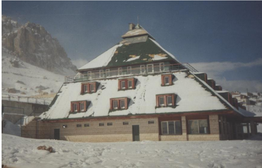
Foto 6. Konaklama tesislerinden Saklıhan Otel

Saklıkent kayak merkezinin Antalya şehrine yakınlığı (53 km) sahaya gelen ziyaretçilerin, günübirlikçi (ekürsionist) nitelikte olmasına