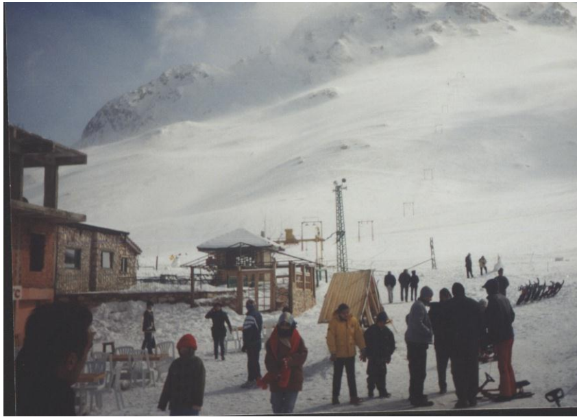
Foto 1.Saklıkent Kayak Merkezinden genel bir görünüm (Aralık 2001)

Kayak tesisleri, Antalya kent merkezine ( Cumhuriyet meydanı) 53 km uzaklıktadır. Bu yol ortalama olarak 1.5 saate alınır. Antalya körfezinin batı kıyılarında hemen hemen deniz kıyısından başlayarak birden yükselen Bey dağları boyunca aşılan bu güzergah, arazinin eğiminin artmasına bağlı olarak, ulaşımda güçlük yaratır.