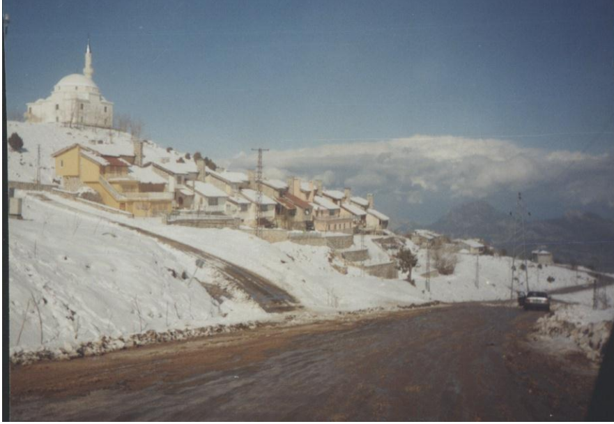
Foto 2. Saklıkent yayla yerleşmesi yol kenarı mahallesi (Şubat 2002)

Saklıkent kayak merkezi adını, yaklaşık 500 m doğusunda yer alan Saklıkent yayla yerleşmesinden almıştır. Yayla yerleşmesinin bulunduğu sahanın, etrafı yüksek tepeler ile çevrili korunaklı bir saha olması, muhtemelen Saklıkent adını almasında etkili olmuştur. Ayrıca, yöre halkının bir kısmı da sahayı saklı yayla olarak adlandırmaktadır.