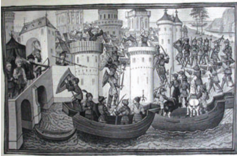
13. Haçlıların denizden İstanbul'u kuşatması.