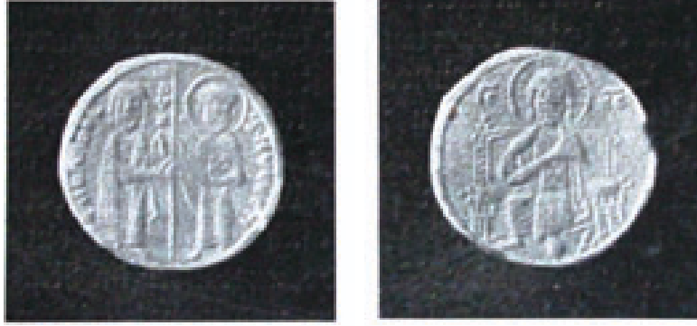
14. Enrico Dandolo'nun Venedik Sikkeleri.