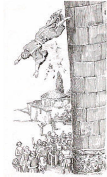
11. 1952 yılında haftalık bir dergide çıkan IV. Haçlı Seferi hakkında yayınlanan bir yazı için çizilen düşük İmparator Murtzuphlos'un bir sütunun tepesinden atılarak öldürülmesinin temsili resmi.