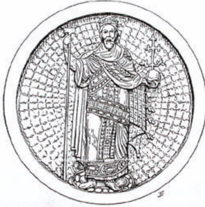
12. Venedik'te bir evin duvarında, üzerinde kim olduğu teşhis edilemeyen bir Bizans imparatoru kabartması olan plaka.