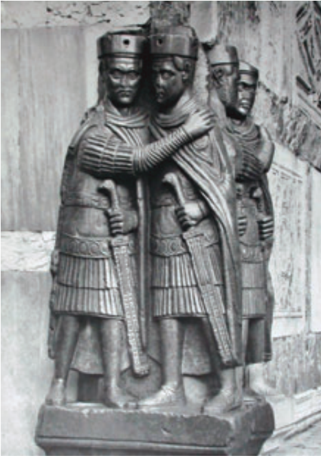
2. San Marco Kilisesi'nin dış köşesinde birbirini kucaklayan dört imparator heykeli.