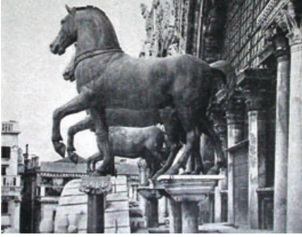
1. San Marco Kilisesi'ndeki atlar.