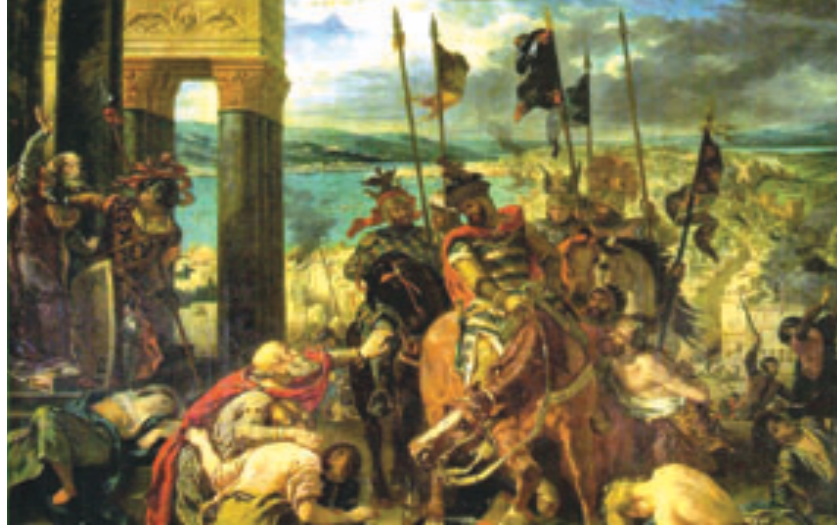
9. Fransız ressam E. Delacroix'in IV. Haçlı Seferi'ni İstanbul surları önünde gösteren tablosu.