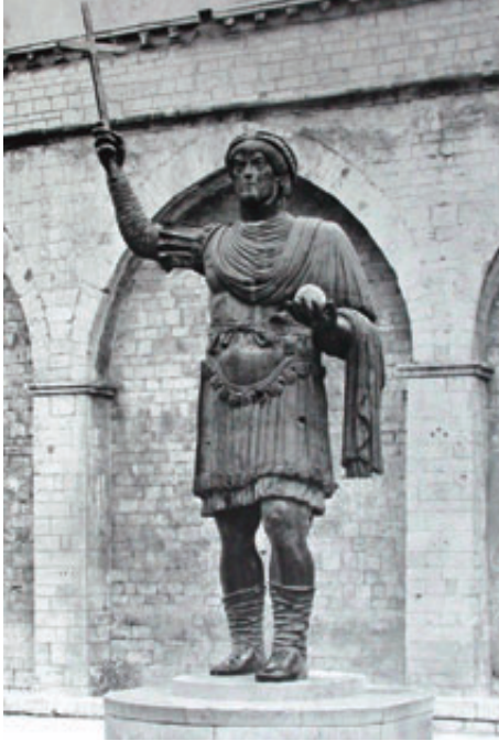
8. İstanbul'daki bir anıttan götürüldüğü anlaşılan Barlette bronz heykeli.