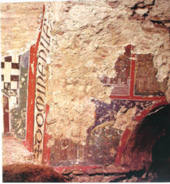
7. Kalenderhane Camiinde Assisili Saint Franciscus'un adını veren kitabe fotoğrafı (a) ve çizimi (b).