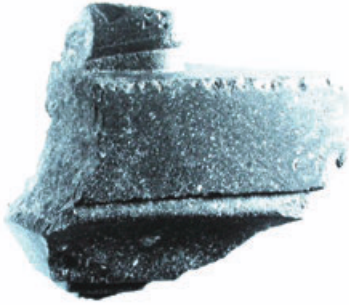
3. Dört imparator heykelinin 800 yıl sonra İstanbul'da bulunan eksik ayağının İstanbul Arkeoloji Müzesi'ndeki parçası.