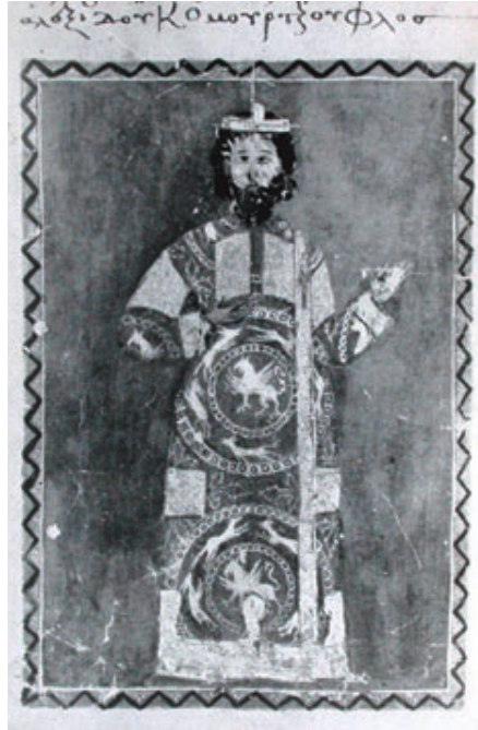
10. Aslı Viyana'da olan Khoniates el yazmasında İmparator V. Aleksios Murtzuphlos'u tasvir eden bir minyatür.