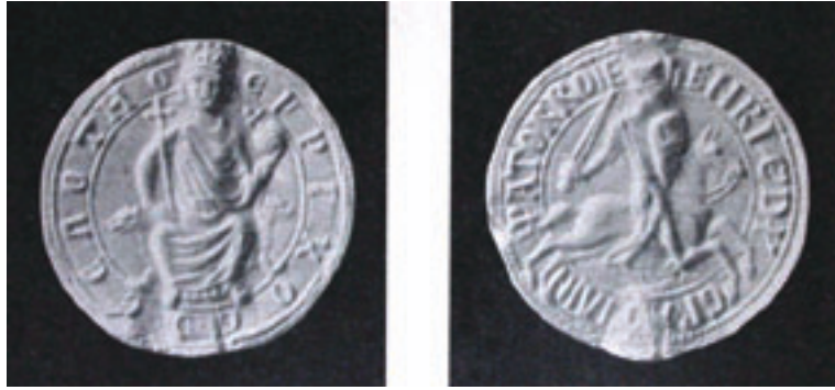
15. İstanbul'un II. Latin İmparatoru Henri de Flandern'in mührü.