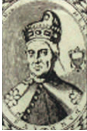
16. Enrico Dandolo'nun portresi.