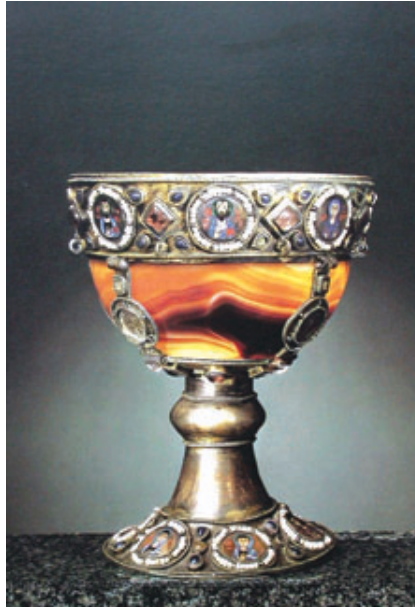
5. İstanbul yağmasından götürülüp San Marco hazinesine konulan kutsal kupa.