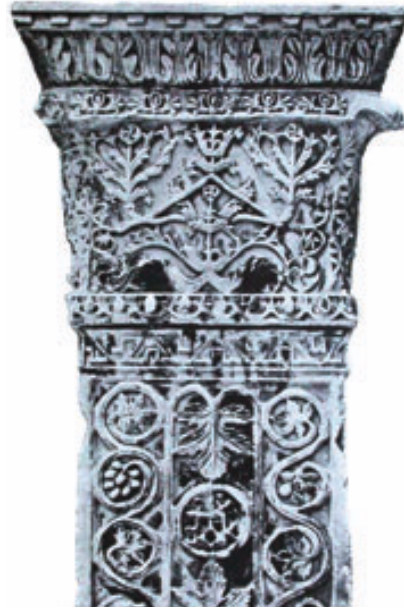
6. Venedik'te dış yüzleri işlemeli mermer paye.