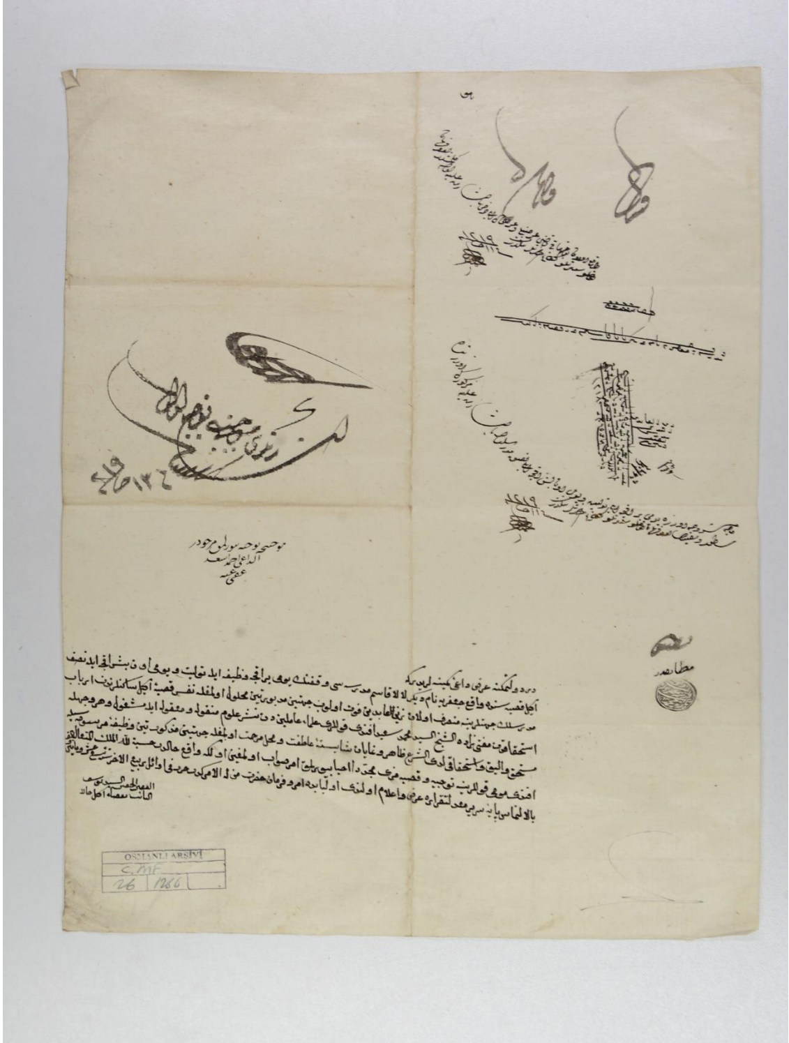
Ek: 3 Caferiye/Lala Kasım Medresesinin Eğil’de Oluğunu Gösteren Belge.