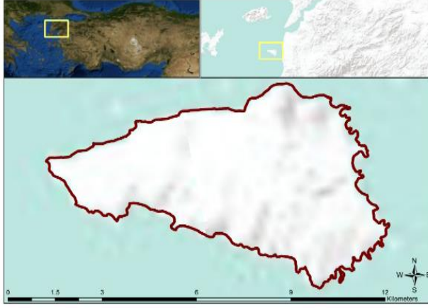
Şekil 1. Çalışma Alanının Coğrafi Konumu Figure 1. Geographical Location of the Study Area

Çalışmada toprak örnekleri temel materyal, çeşitli toprak, jeolojik ve topoğrafik haritalar ile hava fotoğrafları ise kartografik materyal olarak kullanılmıştır. Çalışma alanına ait iklim, jeoloji ve topoğrafik özelliklere ait veri ve haritalar çalışmanın ilk bölümünü içeren “Bozcaada Toprakları-I (iklim-jeoloji-topoğrafy) adlı makalede (Yiğini ve Ekinci, 2018) sunulmuştur. Çalışmanın bu bölümünde ise, tanımlanan 12 adet toprak serisine ait toprak profillerinden alınan toprakların bazı fiziko-kimyasal özellikleri, haritalanması ve sınıflandırılması ele alınmıştır. Bu amaçla yürütülen toprak etüd çalışması sonucunda belirlenen 12 adet toprak serisini temsil eden toprak profilleri morfolojik olarak incelenmiş ve horizon esasına göre toprak örnekleri alınmıştır (Soil Survey Staff, 1993). Çalışma alanına ait kartografik materyallerin işlenmesi ve yorumlanmasında uzaktan algılama ve coğrafi bilgi sistemleri yazılımları kullanılmıştır. Topoğrafik haritaların sayısallaştırılmasında işlenmesinde, hava fotoğraflarının analizlerinde, toprak veri tabanlarının hazırlanmasında, dijital yükseklik modeli, yöney, eğim haritası, topoğrafik nemlilik indeksi katmanı ve sayısal toprak haritasının üretilmesinde ArcGIS 10.2 (ESRI, 2014) ve SAGA GIS (2014) coğrafi bilgi sistemleri ve ERDAS IMAGINE (2010) uzaktan algılama yazılımları kullanılmıştır.