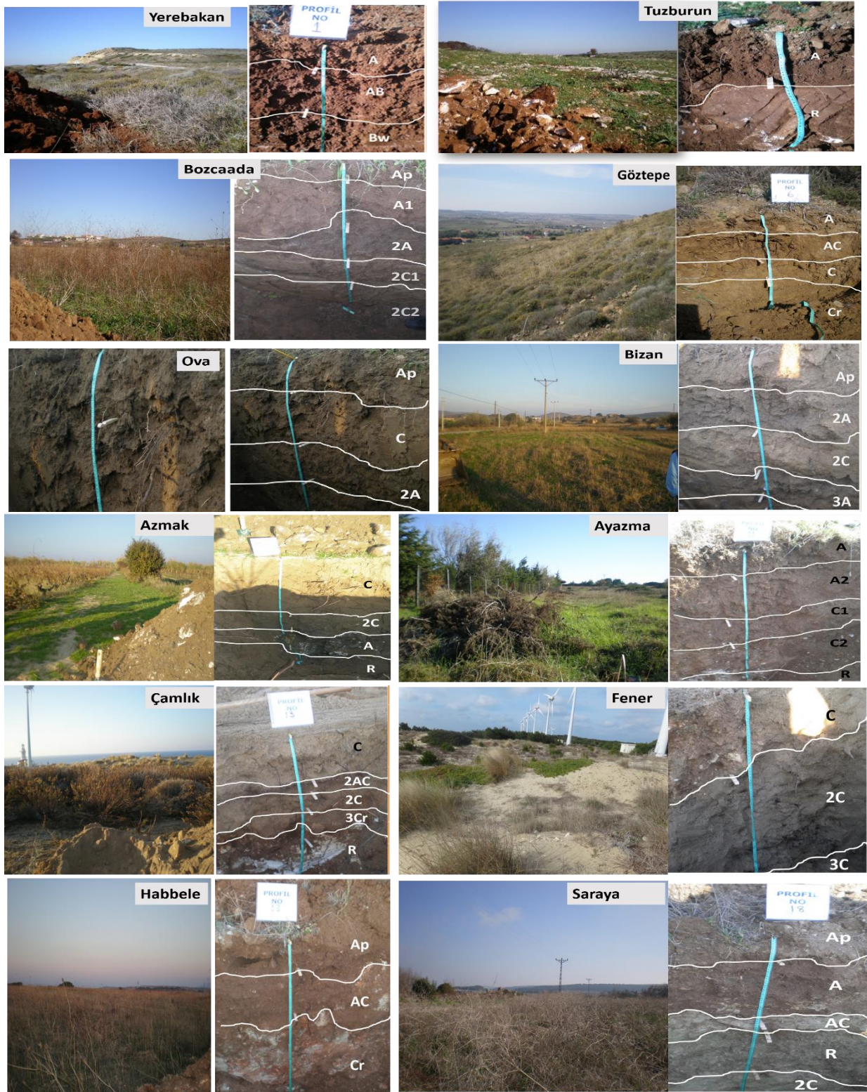
Şekil 5. Çalışma alanında saptanan toprak serilerinin çevresi ve profil görünüşleri. Figure 5. Surroundings and profile views of the soil series detected in the study area.

Toprak profillerinin bazı morfolojik ve fiziksel özellikleri (Çizelge 1), toprak serilerini temsil eden toprak profillerine ait bazı kimyasal özellikler ise Çizelge 2 de sunulmuştur.