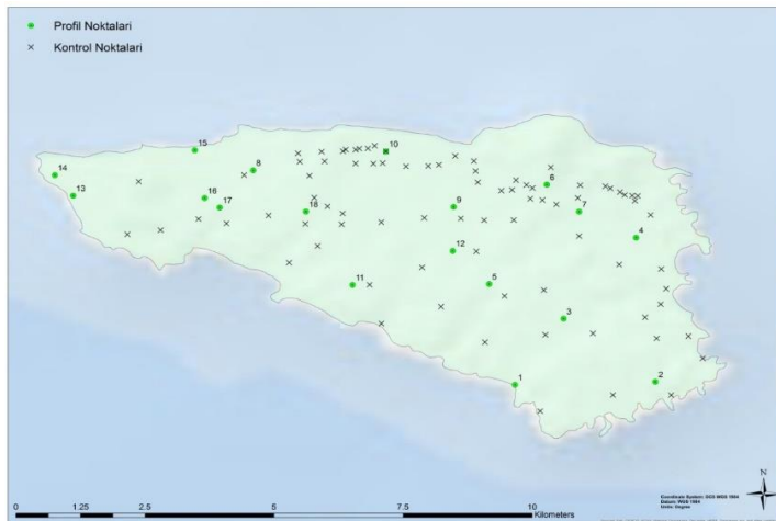
Şekil 3. Çalışma alanında açılan toprak profillerinin yeri ve kontrol noktaları Figure 3. Location and control points of soil profiles opened in the study area