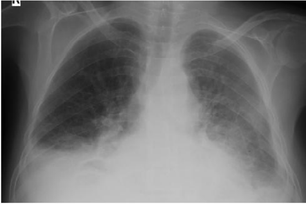
Resim 3: Hasta taburcu edilmeden önce çekilen akciğer grafisi