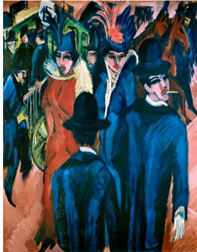
Resim 3. Ernst Ludwig Kirchner, Sokak Sahnesi, 1913, Brücke Müzesi, Berlin

Resimlerde dışavurumculuğun sert hatları değil, daha dingin ve yumuşak tonlara başvurmuşlardır. Boyayı üst üste yoğun halde bırakarak tabakalar elde etmişlerdir. Kontur çizgileri net ifade edilse de paletlerinde parlak ve diri renkler tercih etmişlerdir (Erden, 2016; Lynton, 2015; Batur, 2015).