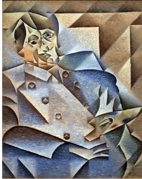
Resim 1. Juan Gris, Pablo Picasso'nun Portresi, 1911

Görünen gerçekliğin geleneksellikten aykırı betimlenmesinden etkilenen ve bu akıma katılan sanatçılar arasında; Pablo Picasso'nun ardından arkadaşı Georges Braque, Albert Gleizes, Juan Gris ve bu akımdan hareketle kendine özgü 'tübist' tavrıyla Fernand Leger bulunmaktadır (Lynton, 2015).