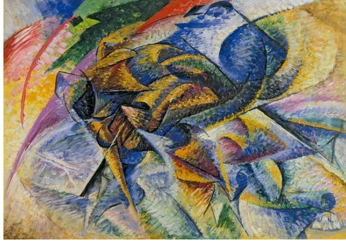
Resim 4. Umberto Boccioni, Bisikletçinin Dinamizmi, 1882-1916, Özel Koleksiyon