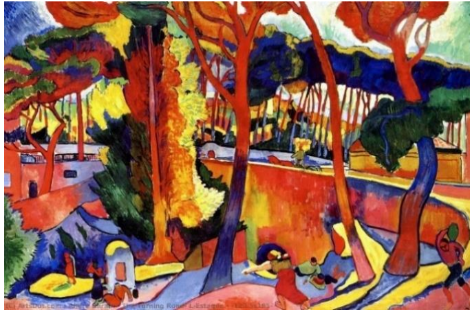
Resim 2. Andre Derain, The Turning Road Le'staque, 1906, Güzel Sanatlar Müzesi, Houston, ABD

Fovizm 1905 ve 1907 yılları arasında kısa bir dönem gibi gözükse de etkisi kendinden sonraki tüm akımları etkileyen bir öneme sahiptir.