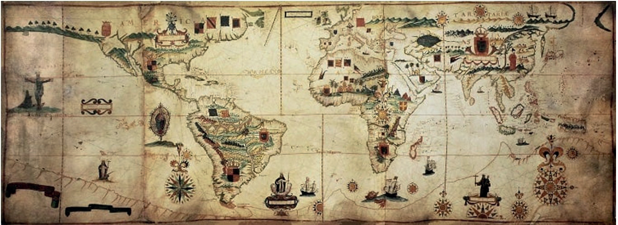
1. An African Map from the Western Colonial Era, 1600s