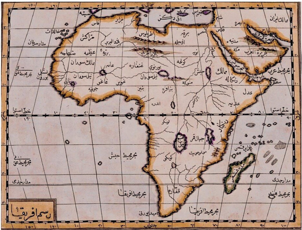
2. An Ottoman Map of Africa drawn in the 1600s (Katip Celebi)