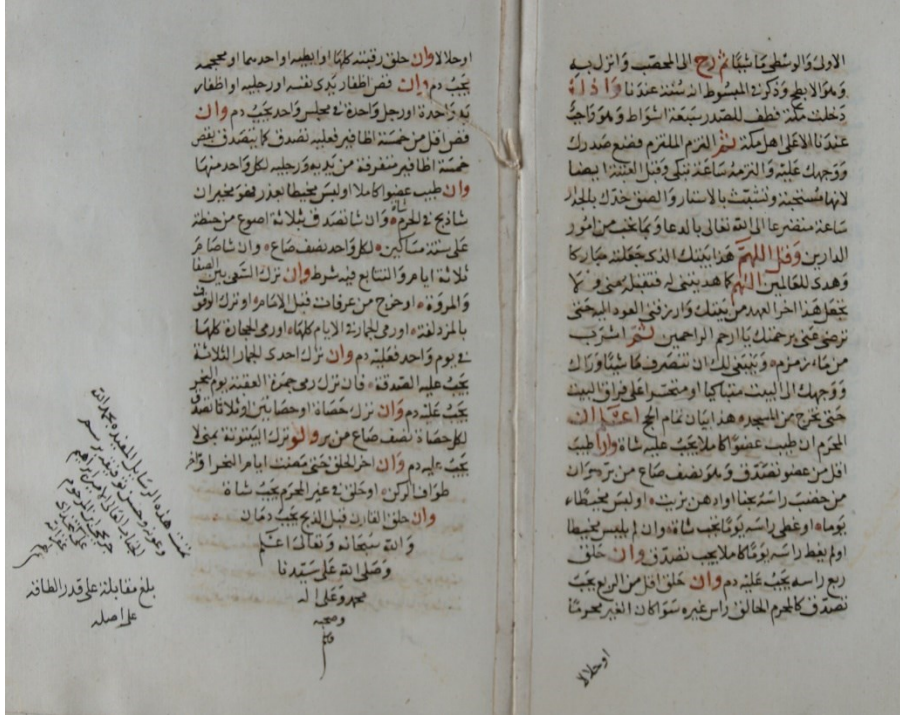
صورة الورقة الأخيرة من نسخة (أ) مكتبة ولي الدين أفندي