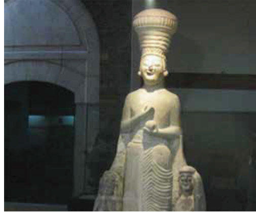
Çatalhöyük ve Frig Ana Tanrıça Heykelcikleri

Orta Asya Türklerinde “balbal” geleneğini görmek mümkündür. Bir Türk öldüğünde, o kişi cesursa ve birini öldürdüyse, öldürdüğü her kişi için tahtadan bir insan tasviri oyulup, mezarı üzerine yerleştirilir. Bunlar ona cennette hizmet edecek kişilerdir”. Çin kaynaklarında da; “Türkler, bir alp öldüğünde, mezarının üstüne bir hatıra sütunu dikerler. Bazıları için 100 hatta 1000 taş dikilmiştir.” denilmektedir. Orhun ve Yenisey yazıtlarında da; bu heykellerin mezarda yatan kişi için tarafından öldürülen ve öbür dünyada kendisine hizmet edecek insanları temsil ettiğini doğrulamaktadır[12]. Özellikle Göktürk gibi eski Türk uygarlıklarında gözlenen bu balballar, ilk anıt heykel uygulamaları olarak kabul edilemezler mi? Yada bugün günümüze ulaşan Anadolu beyliklerinin bir çok eserinde yer alan iri kabartma bezemeler (örneğin bir Divriği Şifahane kapısı) , yarattıkları girinti-çıkıntılarla birer rölyef sayılamaz mı? [13].