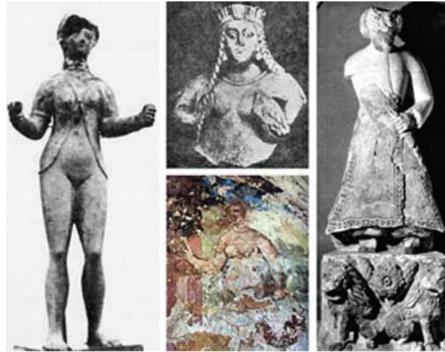
Kasrü'l Hayri'l Garbi'deki heykel ve resimlerden. Sağda Hırbet ül-Mefcir Sarayı heykellerinden birisi.

İslamiyetin etkileri sanat dünyasına, özellikle de heykel sanatına nasıl yansımıştır? İslam ülkeleri, özellikle de Türkler söylenenler hadislerden ne kadar etkilenmişlerdir? Bunun yanıtını bizlere kültürel değeri olan eserler vermektedir. İslami etkilere rağmen aslında bir çok İslam devletinde resim ve heykelin ya da kabartmanın yapılmış olduğu görülmektedir. Bu bağlamda en önemli örnekler arasında Emevi veya Abbasi yapıları verilebilir; 728 tarihli Kasru'l Hayru'l Garbi , Mışatta (743?) ile Hırbetü'l Mefcir (743-48) ve yine 711-715 tarihli Kusay-ı Amra Sarayları bu bakımdan oldukça önemlidir.[8]. Ayrıca Arap dünyasında yaklaşık 630'lu yıllarda, Buhara ve Semerkant kentlerinde heykel üretim merkezleri olması ise dikkate değerdir.[9].