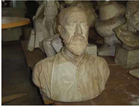
Yervant Oskan, "Osman Hamdi Büstü"; 51x54x30 cm, İ.R.H.M, mermer

Bugün Türk heykelinde yaşanan en büyük sıkıntı, zaten geç başlamış olan bir sanat dalının günümüze ulaşmada yaşadığı problemlerdir. Bunda, eserlerin çoğunlukla alçı gibi dayanıksız malzemeden yapılmış olmasının payı büyüktür. Bundan Oskan Efendi de payını alır ve ne yazık ki sanatçının günümüze çok az eseri baki kalabilir. Bugün bu eserler bronza dökülmediği müddetçe, tümünü aynı kötü kader bekleyecektir. Bu konuda ilgililerin daha duyarlı olmasını ümit ediyor ve bu eserlerin daha iyi şartlarda korunarak, gelecek kuşaklara ışık olmasını temenni ediyoruz