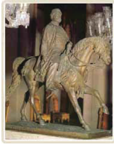
C.F.Fuller, Abdülaziz Heykeli,1871,Bronz Heykel

Osmanlı’da gerçek bir heykel eğitimi için açılacak olan okuldan önce bir Osmanlı sultanı, Sultan Abdülaziz; Avrupa’ya seyahate çıkmış ve burada gördüklerinin etkisinde kalarak kendisinin heykelini yaptırmıştır. Böylelikle Osmanlı’da ilk kez bir padişahın heykeli yapılmış olmaktadır. Sultan Aziz’in heykelini, C.F.Fuller (1830-1875) adlı heykeltıraş at üzerinde betimlemiştir[19].