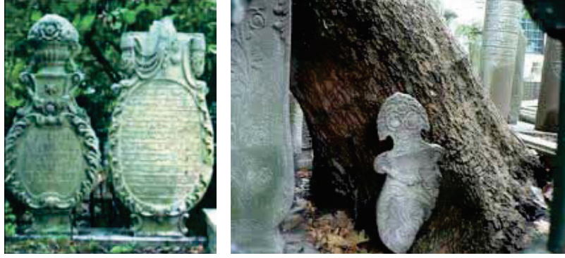
Osmanlı Batılılaşma dönemi mezar taşı örnekleri