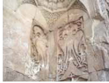
Selçuklu Kartalı-Divriği Ayrıntı

Osmanlı toplumunda “genelde üç boyutlu ve gölgesi yere düşen, etrafında dönülebilir yani rond-bosse halindeki heykellere pek de sıcak bakılmamıştır” demek yanlış olmayacaktır. Bu bağlamda da mimariye bağımlı ve süsleme esaslı anlayışın ağırlıkta olduğu uzun bir dönem yaşanmıştır[14].