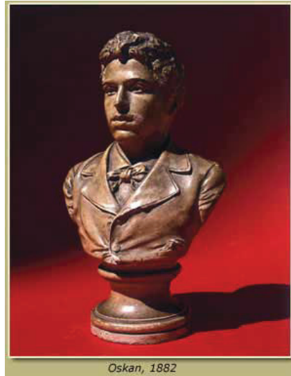
Yervant Oskan, "Kendi veya Kardeşi Dikran Osgan Büstü"

Sanatçı yapıtlarının malzemesinde özellikle; alçı, mermer, bronz yada pişmiş toprağı tercih eder. Bunlarda genellikle tarihsel ve günlük konulara değindiği, hatta mitolojiden de esinlendiği gözlenir. Daha ziyade büst ve rölyef çalışmalar yapmakla birlikte, küçük boyutlu heykel çalışmaları da bulunan sanatçı, form tekrarı yapmaktan kaçınmış ve çalışmalarında özellikle natüralist ve klasik üslubu tercih etmiştir. [27].