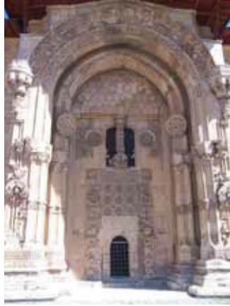
Divriği Taçkapı görünüm