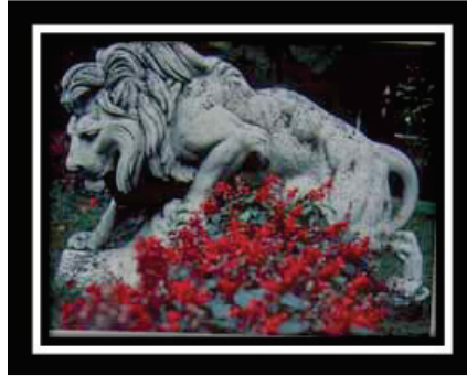
Beylerbeyi Sarayı Bahçesinden, aslan, karaca ve yavrusu; P.Rouilland tarafından, mermer ve bronz, Paris-1864,(Milli Saraylar kitabı,s.150).

Sanayi-i Nefise Mektebi açılmadan önce, heykel sanatı adına yapılan önemli girişimler olduğundan daha öncede bahsedilmiştir. Nitekim, Kanuni Sultan Süleyman zamanında (1520-1562) vezir İbrahim Paşa Mohaç Seferi dönüşünde, Budapeşte'de gördüğü birkaç heykel örneğini (Herkül, Apollon ve Diana) beraberinde getirir ve bu heykeller, İbrahim Paşa Sarayı önüne; At Meydanına (Sultanahmet) dikilirler.[17]. Bu davranışıyla kınanan ve hatta