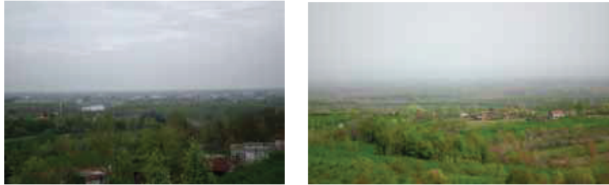
Fotoğraf 4. Çarşamba Ovası'nın (a) Beyyenice Köyü Tepecik Mevkii ve (b) Ağcagüney Beldesi Urumluk Tepesi'nden görünümü.

Çarşamba Ovası verimli toprak yapısı ve geniş alanları ile yöre halkının sosyo-ekonomik gelişiminde önemli yere sahiptir [Fotoğraf 4]. Geçimin tarıma bağlı olduğu ilçede sosyal hayatın içinde su ögesinden sonra en fazla dikkati çeken hiç şüphesiz ova ögesidir. Köylerin hemen hepsi ova üzerinde kurulmuştur. Ova, ekinlerin ekildiği Cennet misali bir geçim kaynağıdır ve türkülerle konu olan sevdaların yaşandığı bir zemindir.