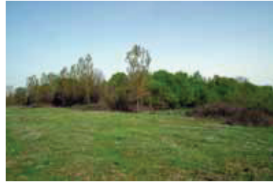
Fotoğraf 5. (a) Sefalı Köyü Kırık Ormanı ve (b) Ağcagüney Beldesi Büyükdağ Ormanı.