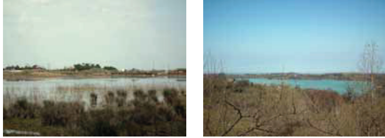
Fotoğraf 3. Çaltı Köyü'nden (a) Aynalı Göl ve Gökçeçakmak Köyü'nden (b) Çakmak Baraj Gölü.

Atma beni göllere de göller derindir Böyle giderse bu yıl Mevla kerimdir [10]