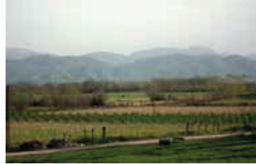
Fotoğraf 6. Canik Dağları'nın (a) Beyyenice Köyü Tepecik Mevkii ve (b) Sefalı Köyü'nden görünümü.