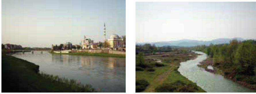
Fotoğraf 2. Şehir Merkezi'nden (a) Yeşilırmak ve Şeyhgüven Köyü'nden (b) Abdal Irmağı.

İrili ufaklı akarsuların Çarşamba yöresi sosyo-kültürel hayatının değişmez bir parçası oluşunun şiirdeki yansımaları, çalışma sırasında en çok gözlenen etkidir [Fotoğraf 2]. Yörede akarsu etkisinin hissedilmediği köy neredeyse yok gibidir. Zira dağlık alanlarda kurulu köylerde halk, ırmak manzarasını görmektedir. Bu nedenle ırmak/dere gibi akarsuyu çağrıştıran yapıyı birçok mânide görmekteyiz.