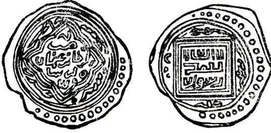
Orhan gazinin ilk akçesi

ve bunun etrafında ise (سنه سبع 2 عشرين سبعمائة) yani 727 hicret tarihi vardır.