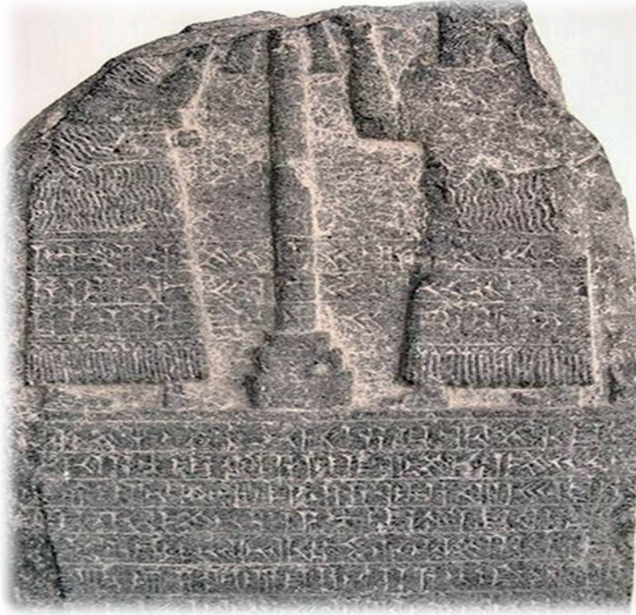
Fig. 3. Antakya Steli (Veysel Donbaz, 1999).