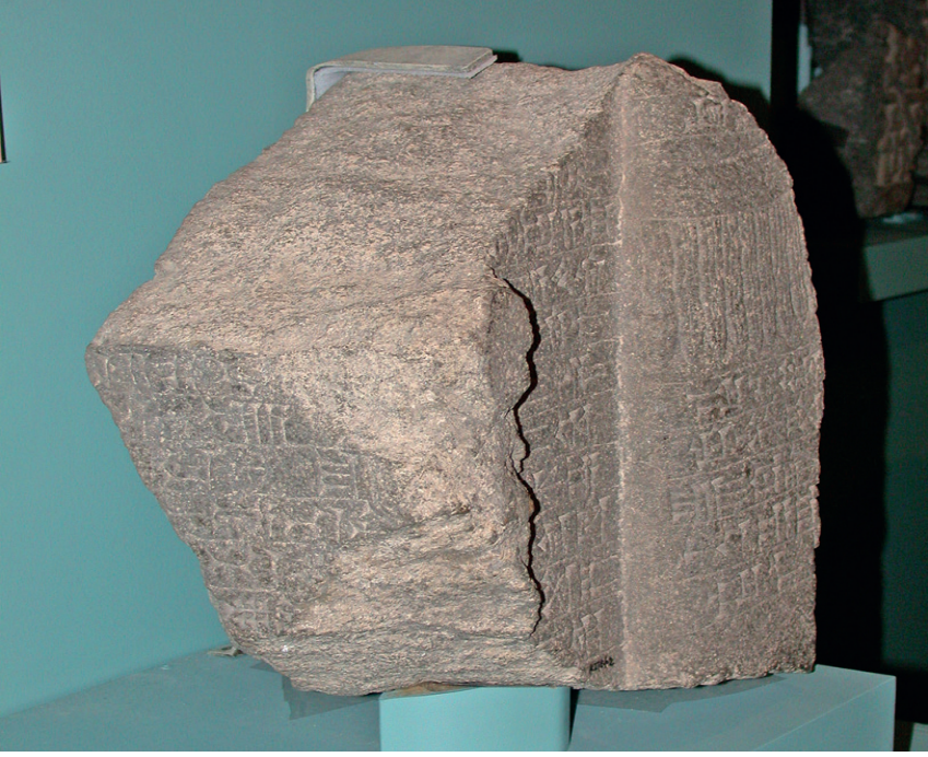
Fig. 4. Tell Tayinat(Kunulua) Kazılarında Bulunmuş II. Sargon'a ait Stel (Jacob Luinger-Batiuk Stephan, 2015).